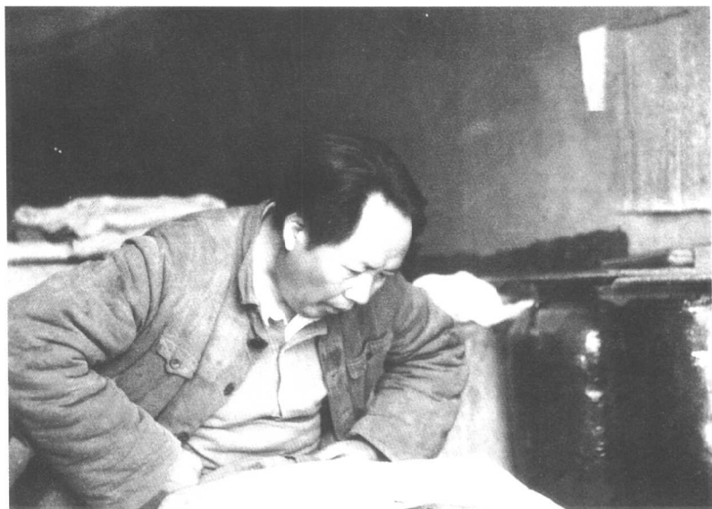
运筹帷幄之中:(毛泽东在陕北窑洞看地图)