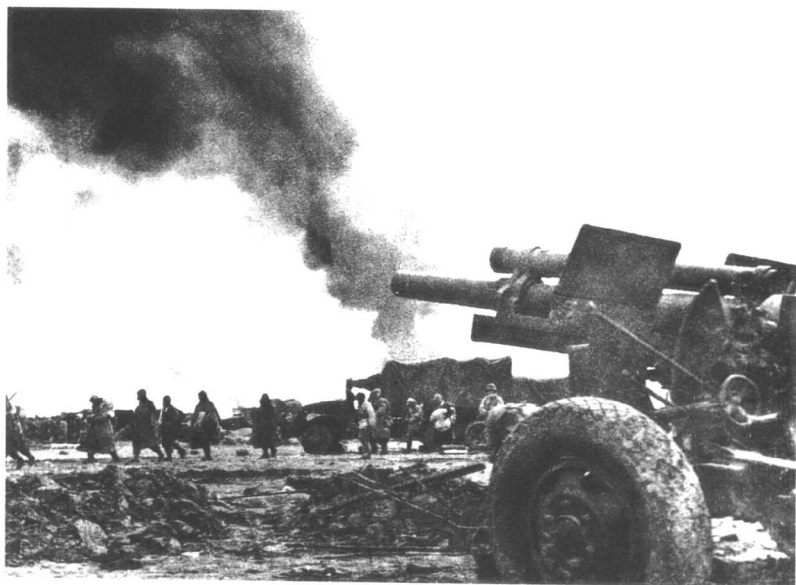
淮海战役:(成群的俘虏被押下战场)