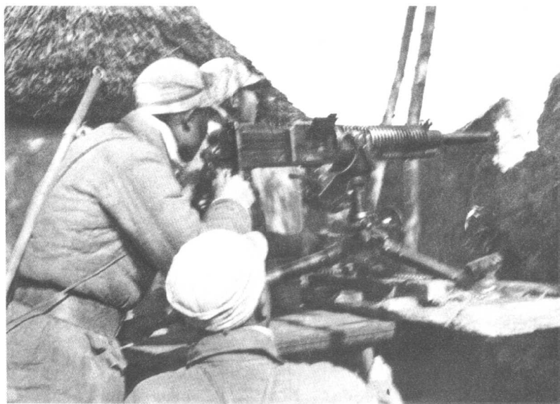
不但要打运动战,也要善于打阵地战