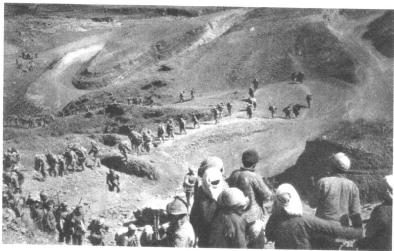
刘邓大军千里跃进大别山