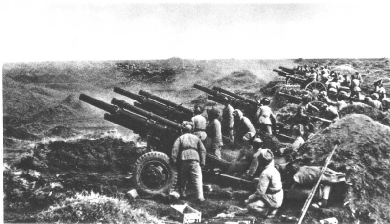
关起门打狗——辽沈战役：(我军强大的炮群轰击锦州城垣)