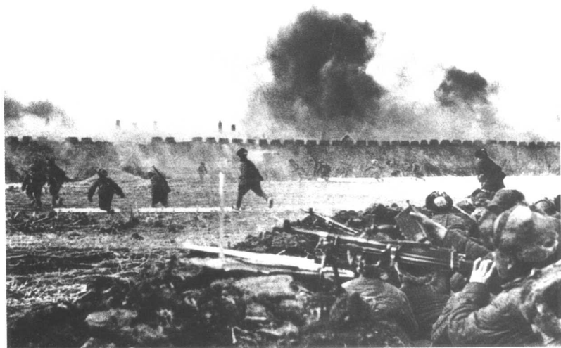
分割包围——平津战役：（我军突破天津外围防线）