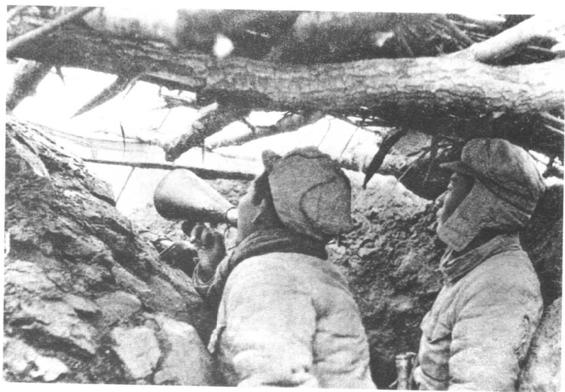
攻心为上(我军在向敌军喊话)