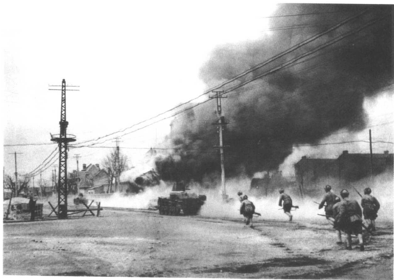
济南战役:(坦克掩护步兵向城内猛攻)