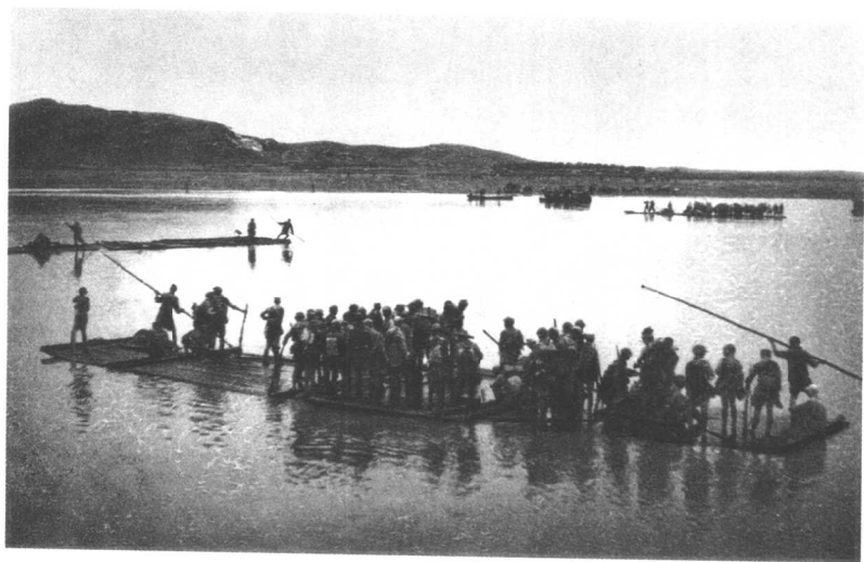
把战争引向蒋管区去