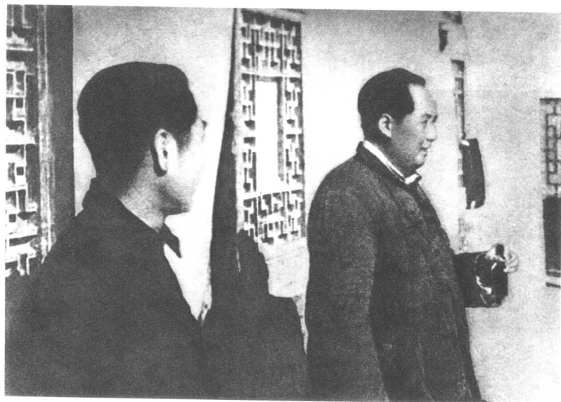
周恩来协助毛泽东指挥全国战场大决战