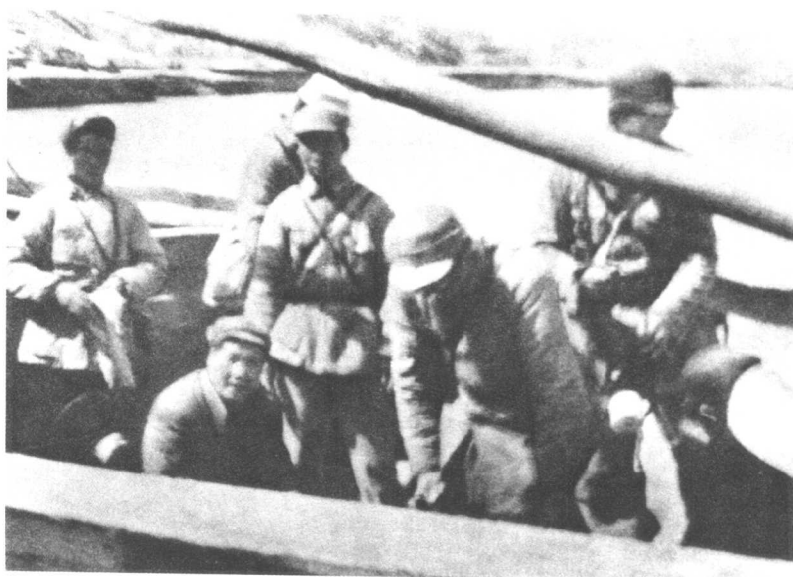
战略退却:(毛泽东东渡黄河)