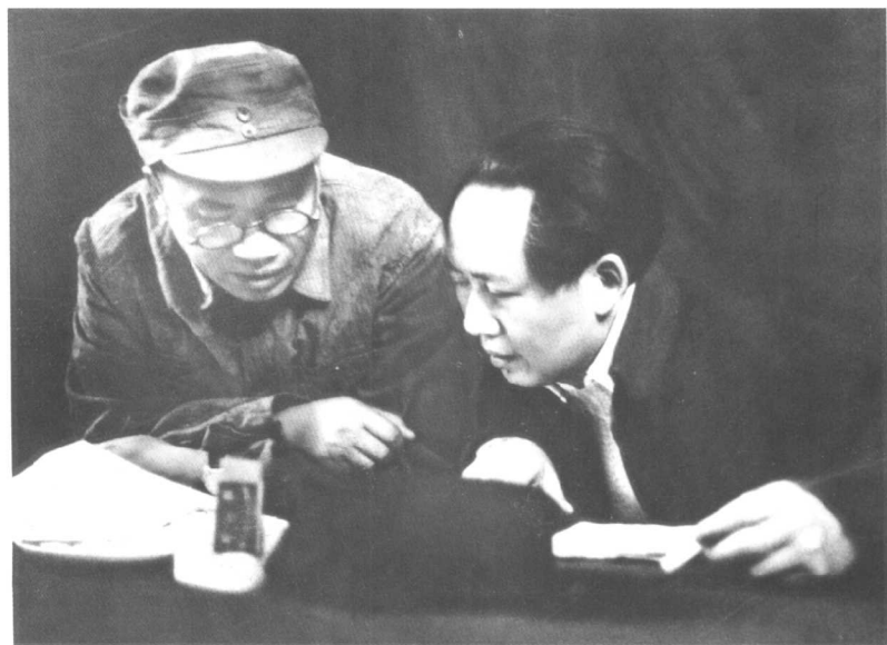
决胜千里之外:(毛泽东和朱德在陕北指挥全国战略大反攻)