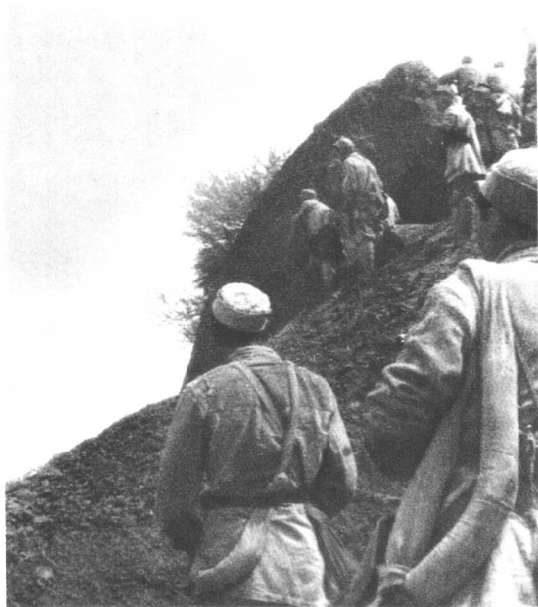
威震西北的沙家店战役