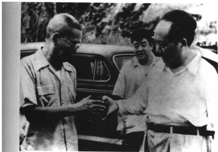
↑ 毛泽东主席和国防委员会副主 席张治中谈论矿石品位