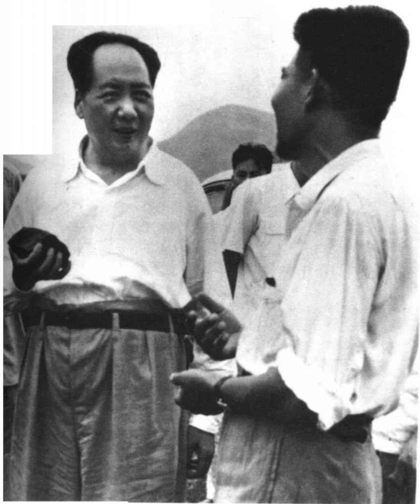
1958年9月15 日毛泽东主席视察 大冶铁矿时询问矿 长陈明江有关矿山 建设情况