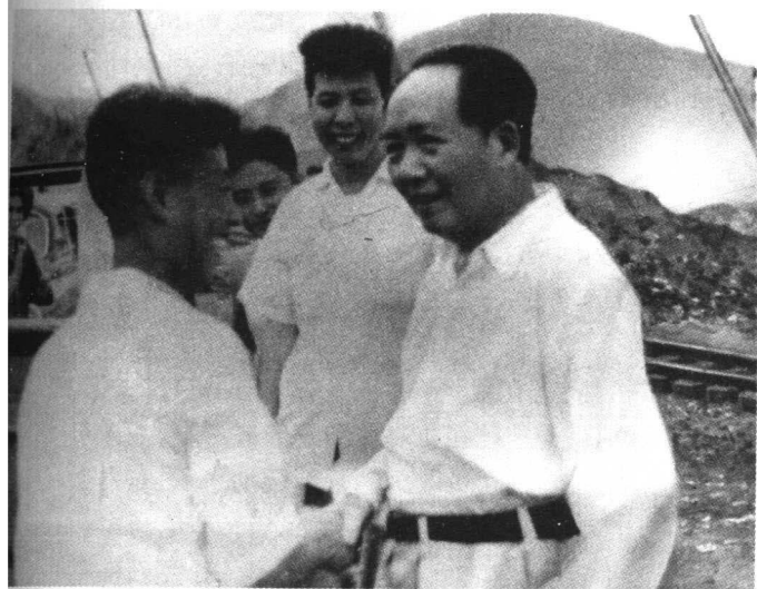
← 毛泽 东主席和 穿孔司机 高才和亲 切握手