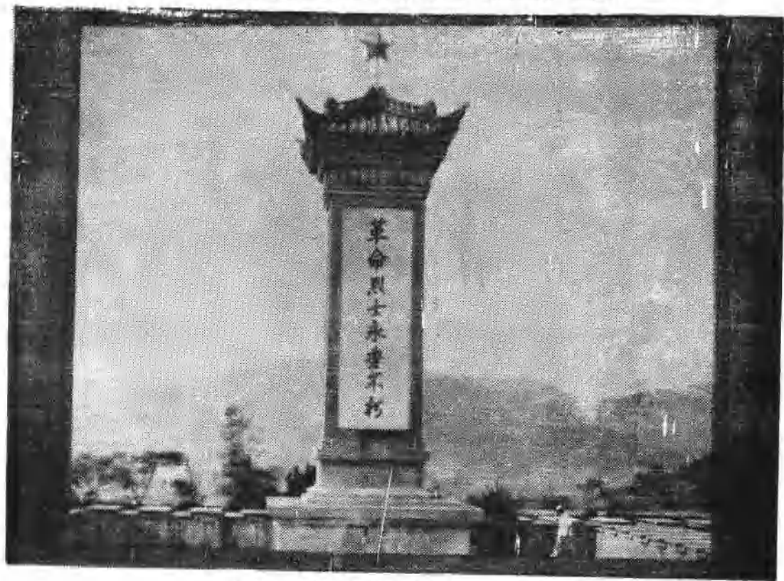
金塘人民为牺牲的烈士建造的纪念碑