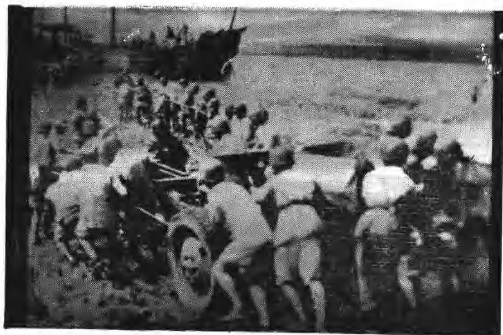
把火炮推上发射阵地