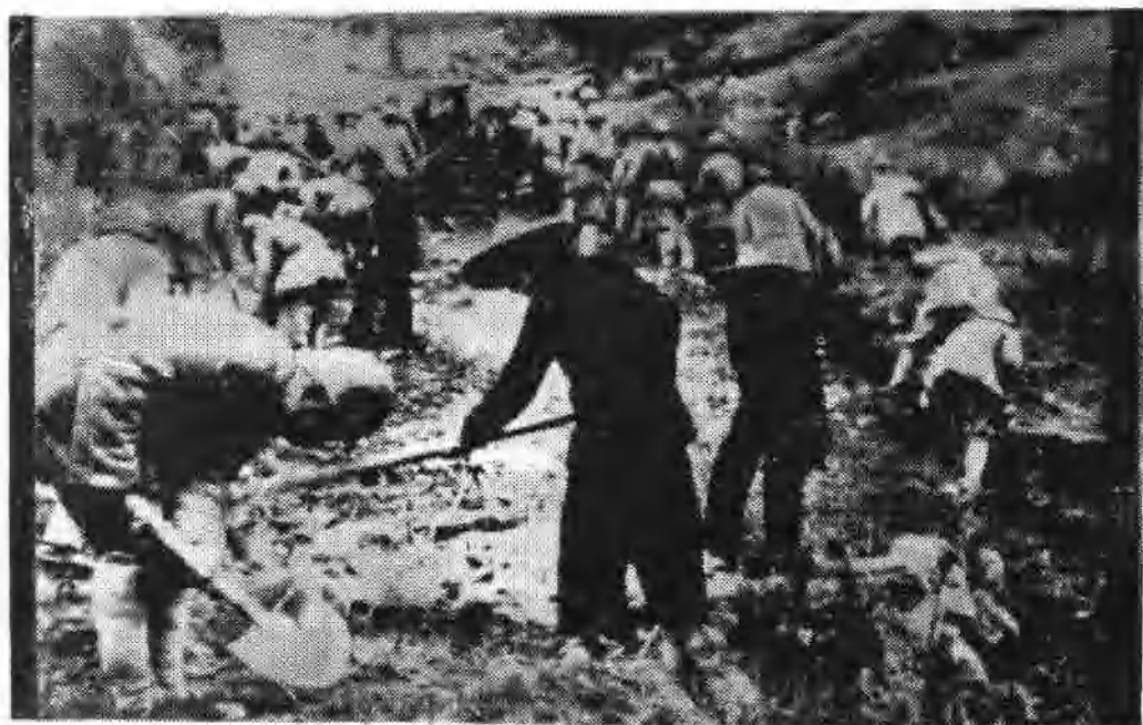
岛上人民协助我军在山谷里修路把重炮推上发射阵地