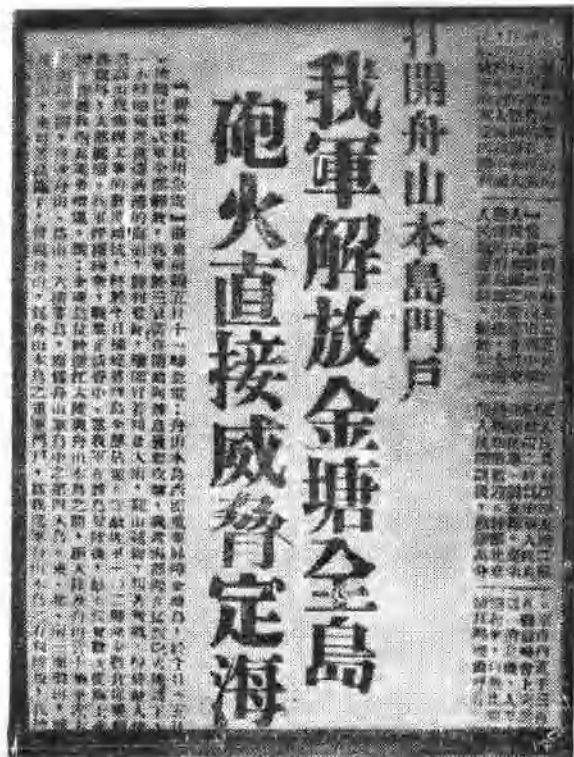
金塘島戰鬥勝利的报道