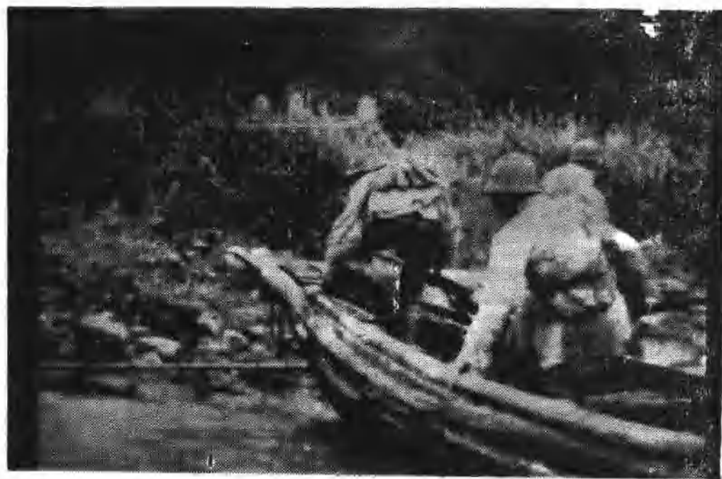
六十六师某连冲上金塘岛