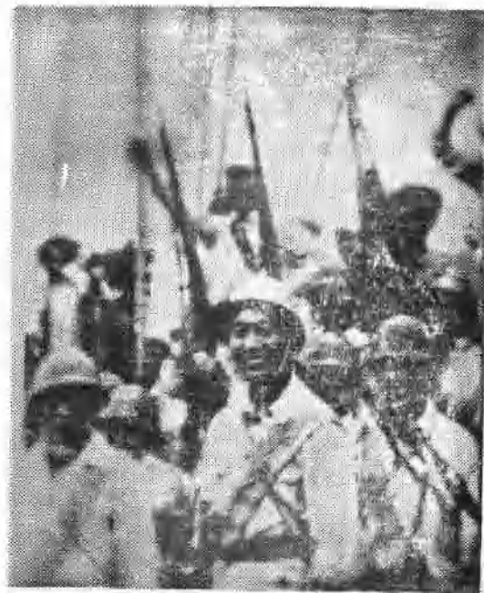
某部战士在阵地上高呼口号表示要以解放金塘的战斗行动，庆祝中华人民共和国成立