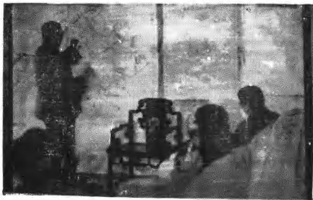
七兵团王建安司令在布置定海战役