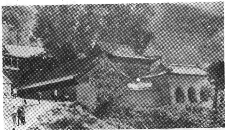
花果山三元宫古建筑群(局部)