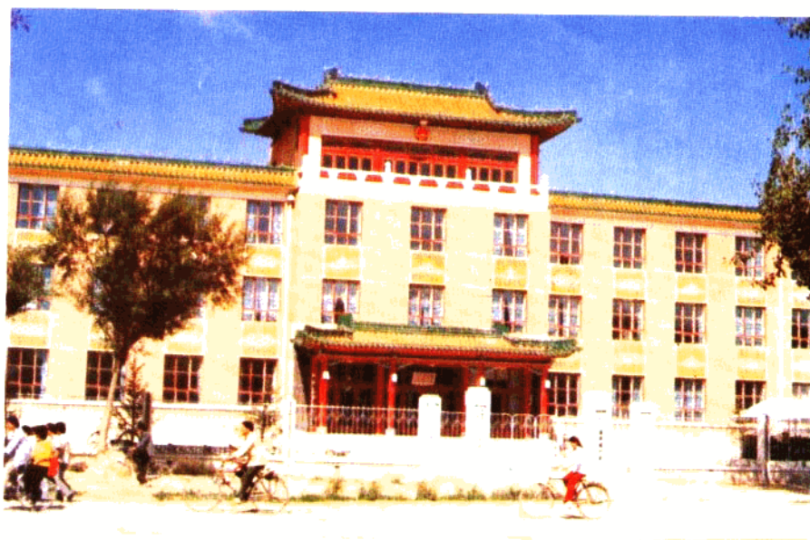
东胜市人大常委会、政协委员会