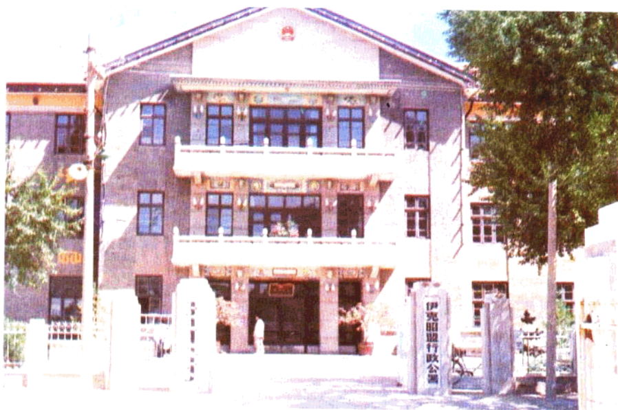
伊克昭盟行政公署