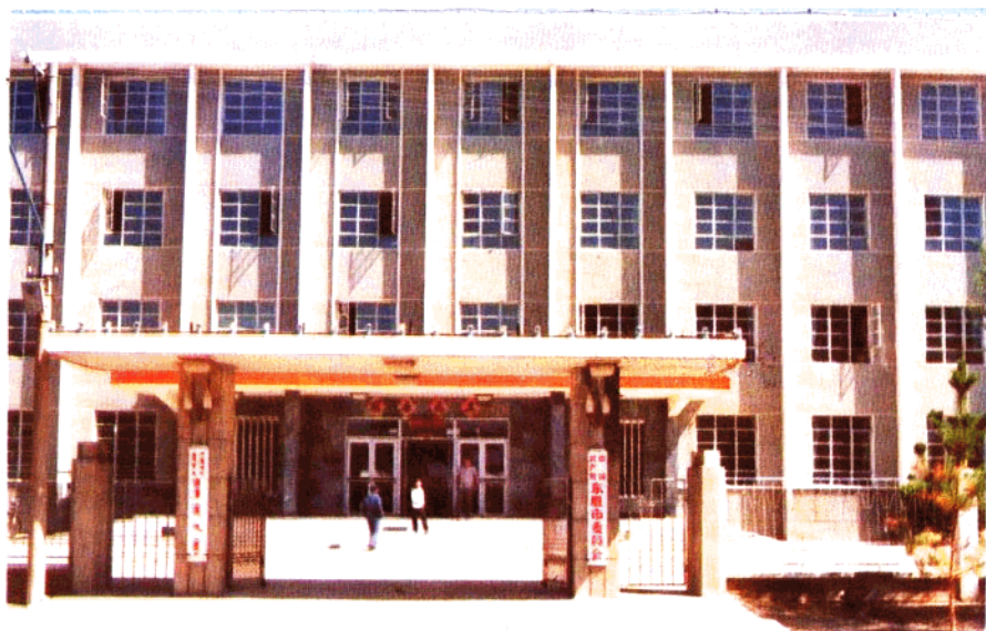
中共东胜市委员会