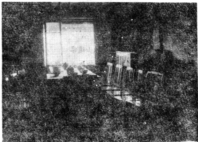
△一九四一年一月，中共武南县委员会成立会址——前黄乡河北沈家村。