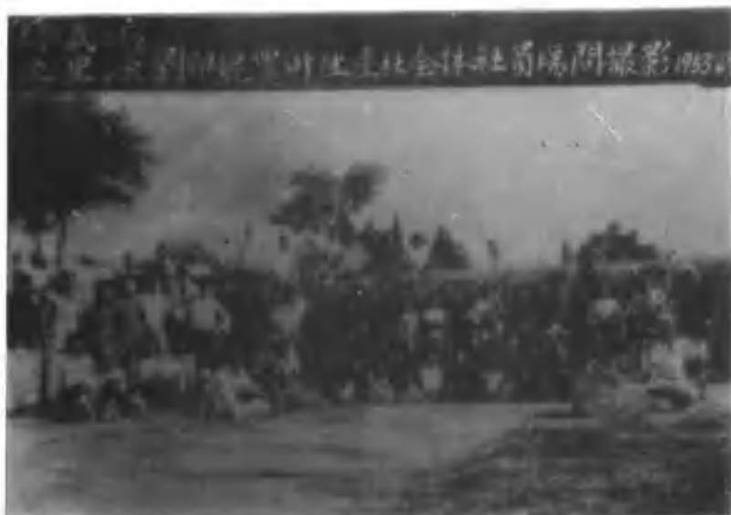
13、修武县五里源刘印坨农业生产社是全县成立最早的一个生产社，这是全体社员场间合影。