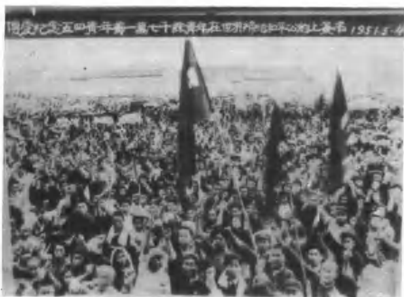
3、博愛縣紀念五四青年節一萬七千餘名青年在世界締結和平公約上簽字。