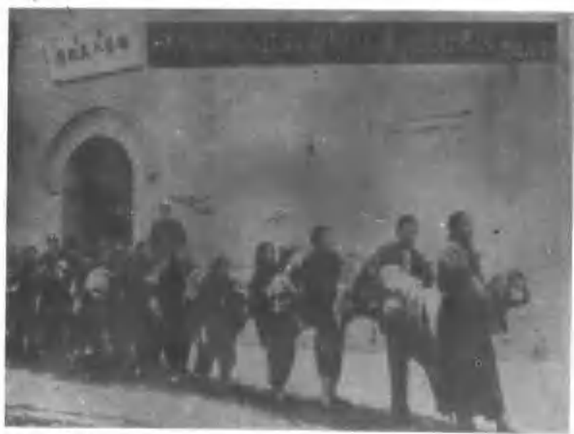
10、焦作矿区人民政府给返乡灾民发寒衣。