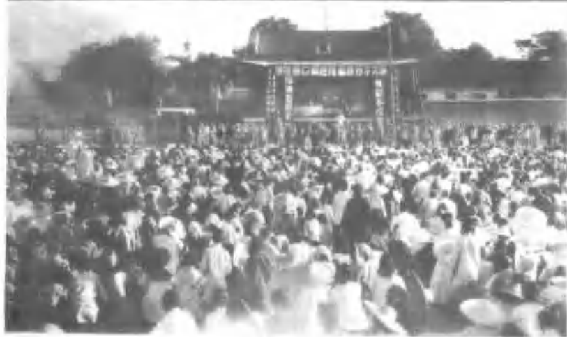
8、焦作礦區公審反革命分子大會會場实况。