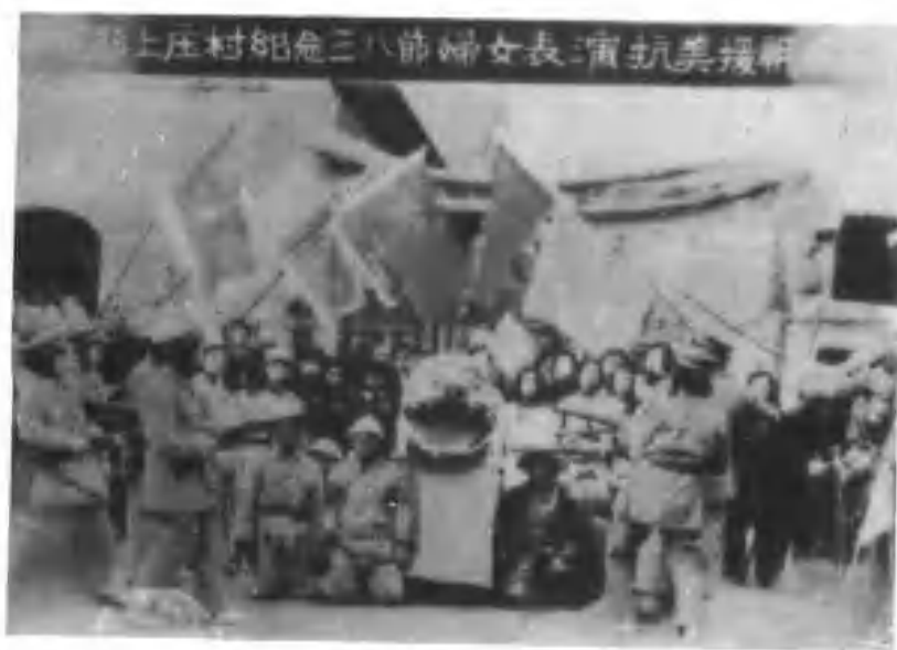
4、博愛縣上庄紀念三八婦女節表演抗美援朝抗美援朝文藝節目。