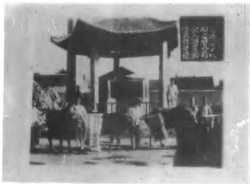
14、修武县劳动模范大会三个互助组受奖合影。