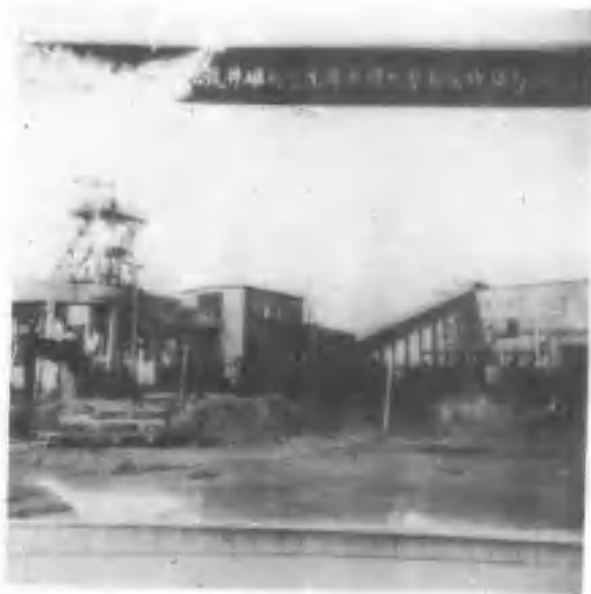
11、建立于1919年的王封矿，1948年10月焦作解放时，矿井被淹没，党和政府发动矿工尽快返矿恢复建设，图为工人们上工时的合影。