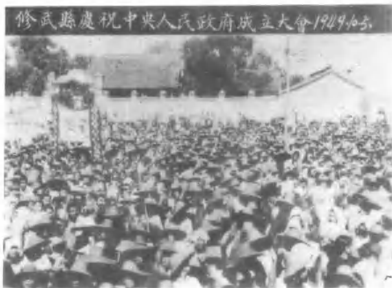
2、修武县庆祝中央人民政府成立大会。