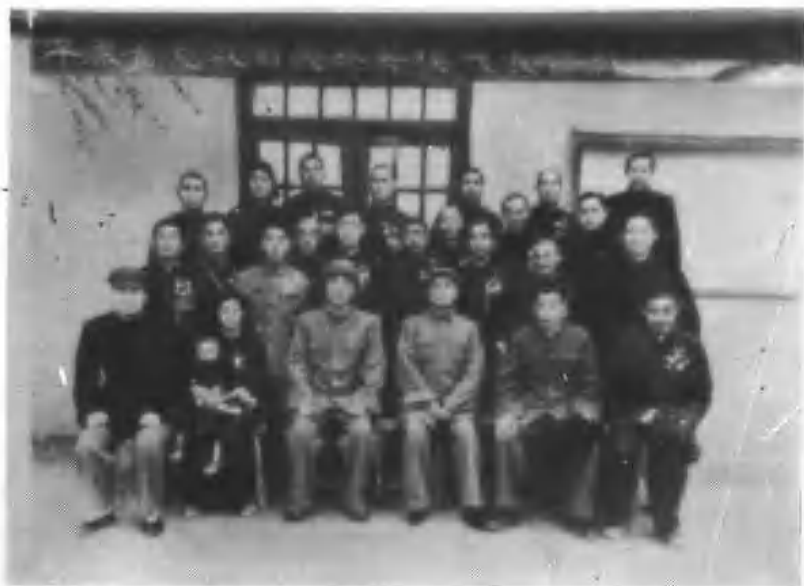
5、平原省党政首长与修武英模代表合影。