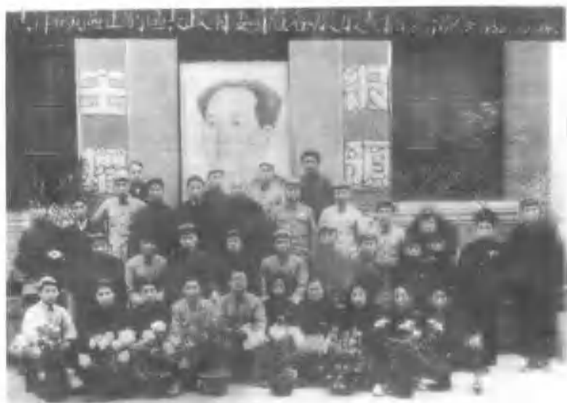
1、焦作矿区正副区长、政府委员和各股股长合影。