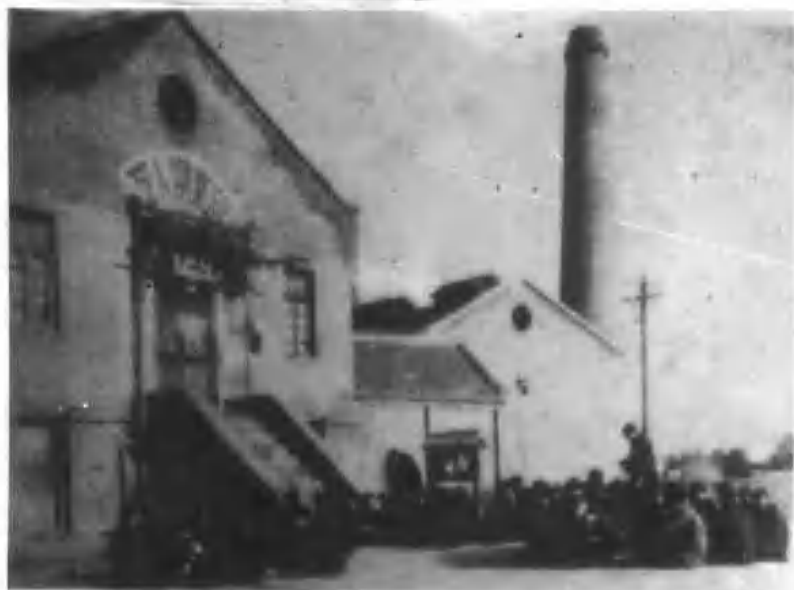
18、党组织十分关心矿工的文化生活，建立了工人俱乐部。图为工人们交流读书心得。

15、为了悼念在抗日、解放战争中英勇牺牲的革命先烈，焦作第二次解放后，政府拨款修建了烈士陵园，并在陵园内修建了太行八分区烈士公墓。