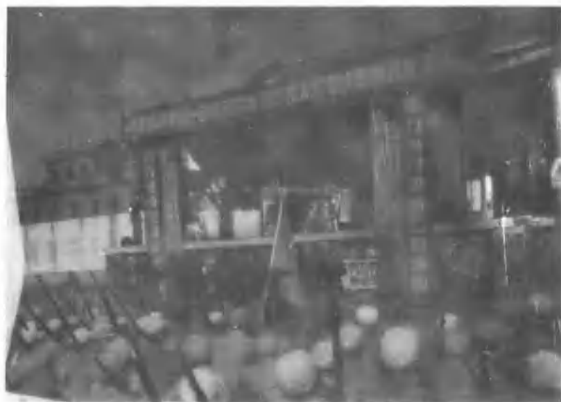
7、1951年焦作各界庆祝中国人民志愿军出国作战一周年胜利大会实况。