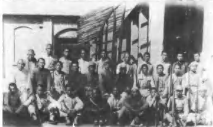
9、焦作矿区参军动员大会当场参军人员合影。