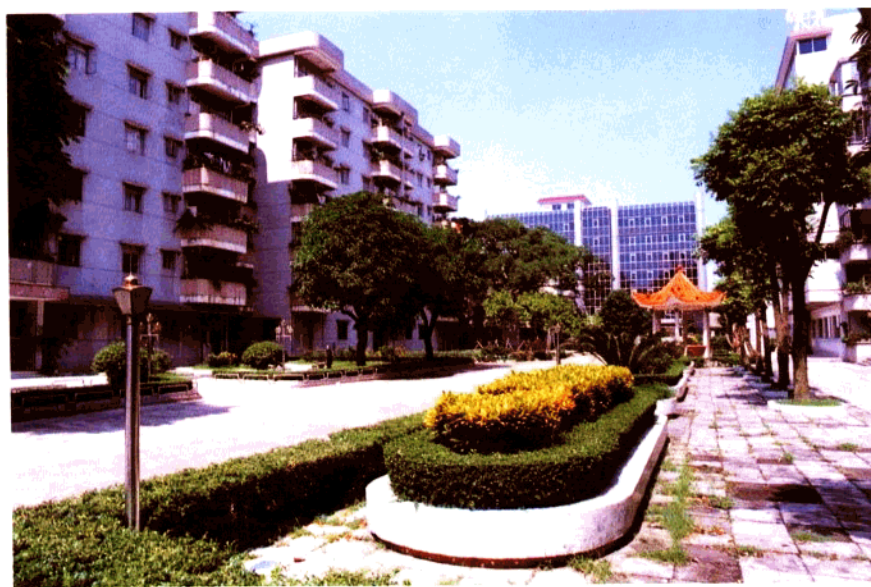
江门海关大院宿舍楼群