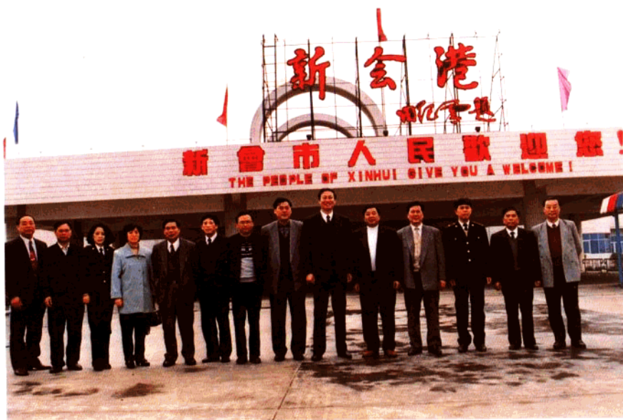
1994年2月11日海关总署署长钱冠林到江门海关视察