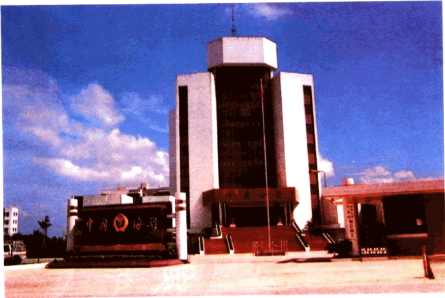
位于新会市的新会海关办公楼