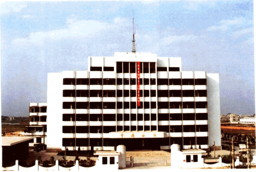
位于鹤山市的鹤山海关办公楼