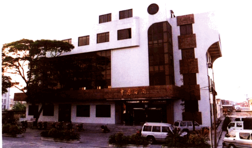
江門海關貨運監管辦公樓