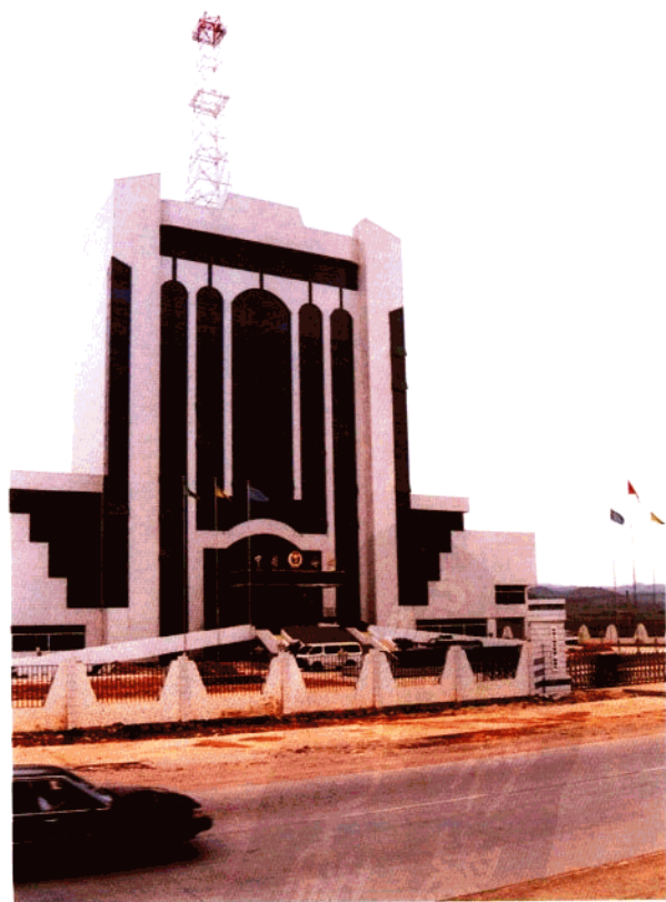
位于台山市的广海海关办公楼