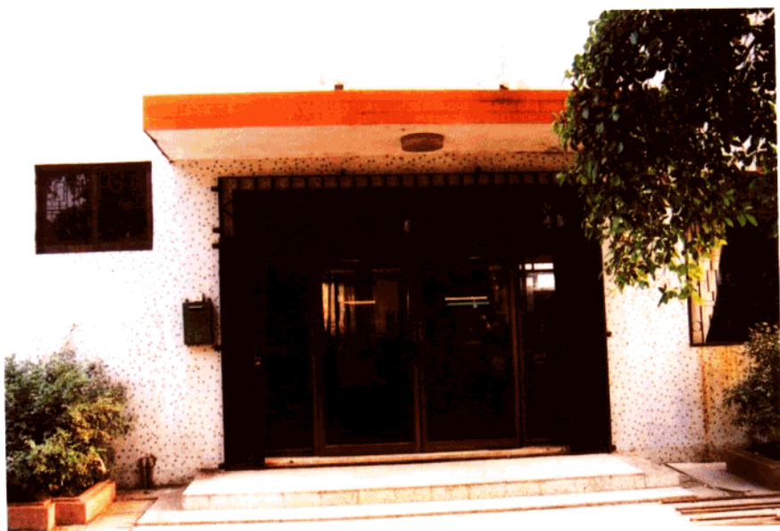
新会海关河口工作组 1981年7月-1986年3月为江门海关驻河口工作组