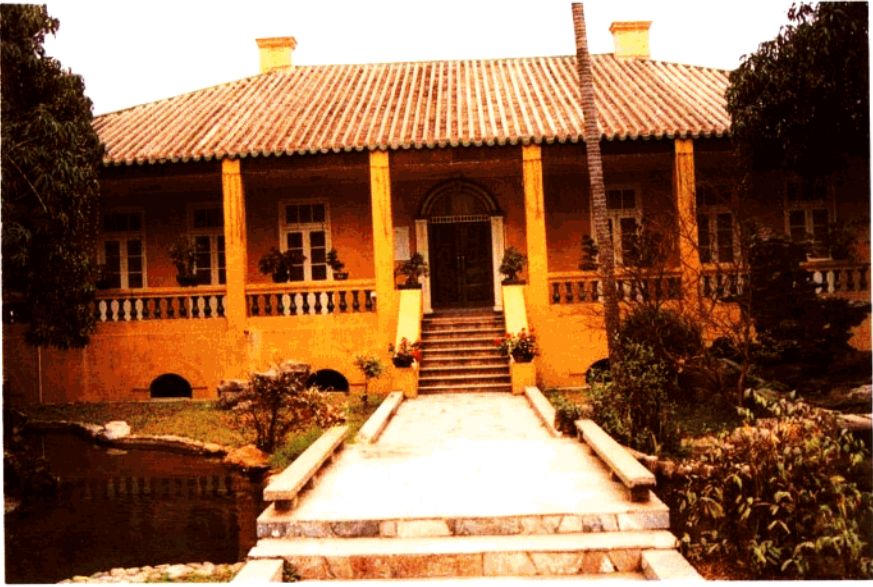
建于 1904 年的原江门关税务司办公室