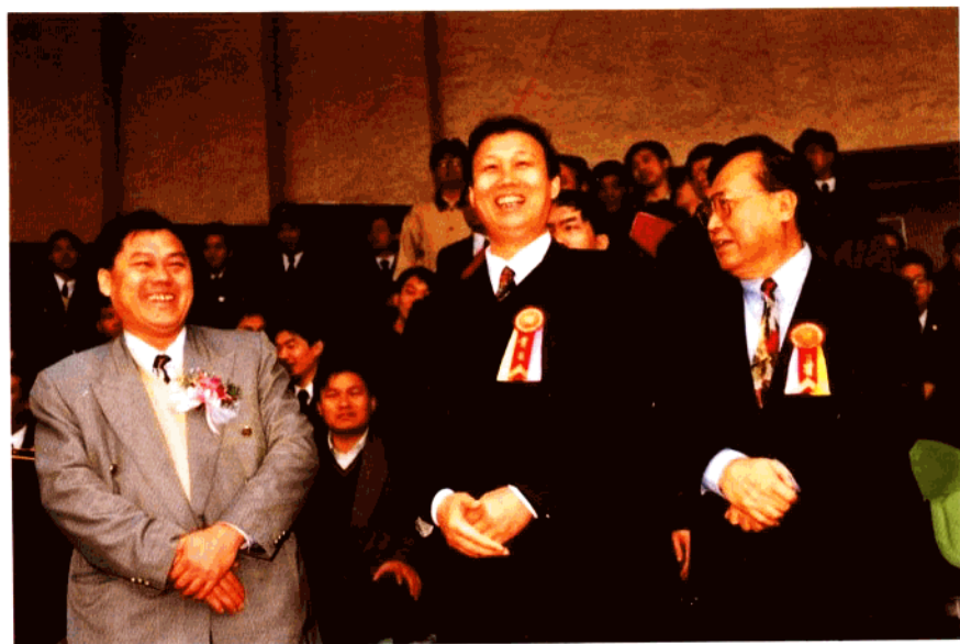
海关总署署长钱冠林、原署长戴杰、江门海关关长吴文灿在足球赛主席台上。