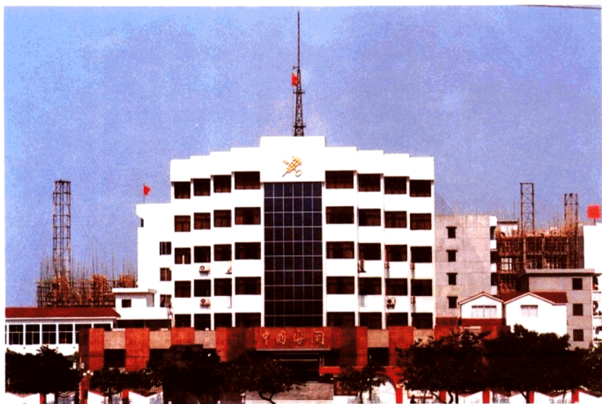
位于恩平市的恩平海关办公楼