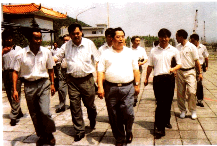
1995年7月海关总署副署长王乐毅到江门海关检查工作