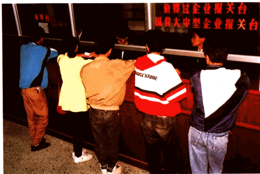
特设专用报关台，优先办理信得过企业、 国有大中型企业报关手续