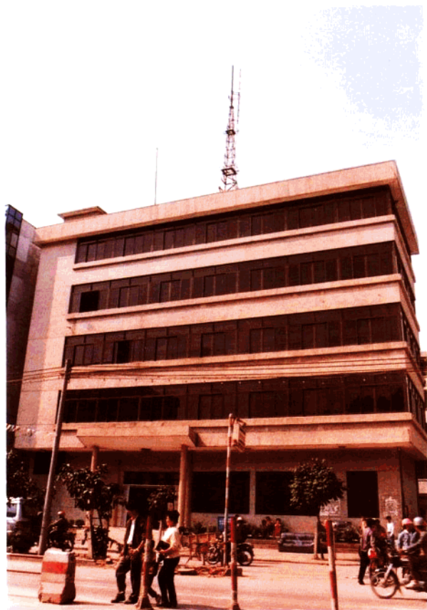
位于阳江市的阳江海关（筹）办公楼