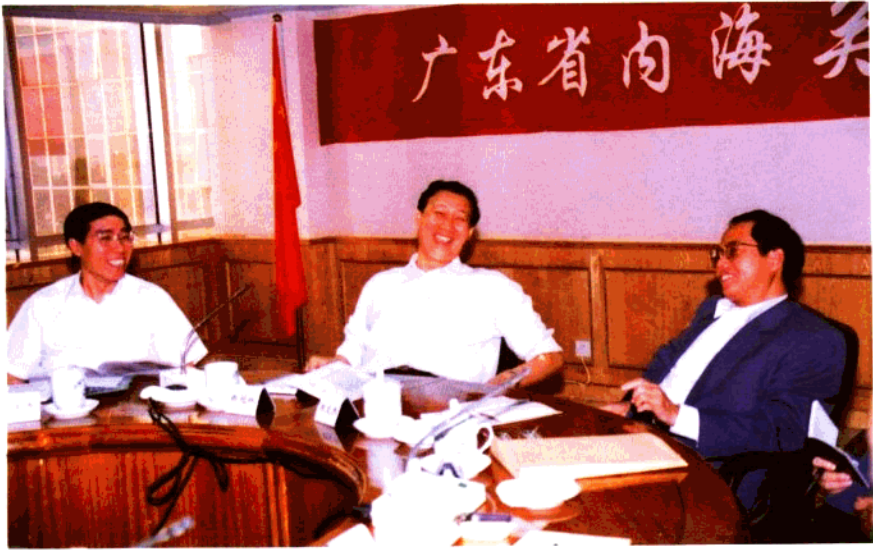
1995年10月18日海关总署署长钱冠林、副署长刘文杰到江门海关检查工作