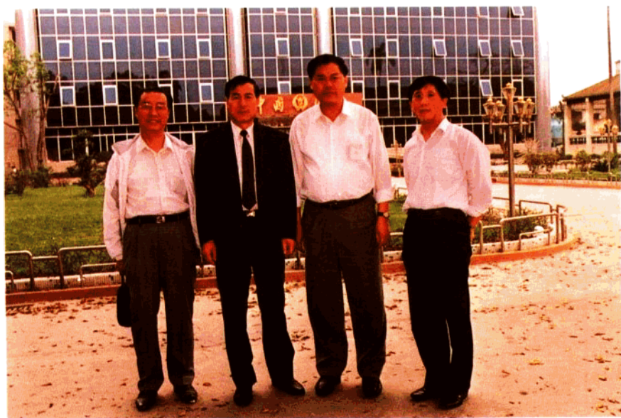
1995年2月海关总署副署长黄汝风到江门海关检查工作