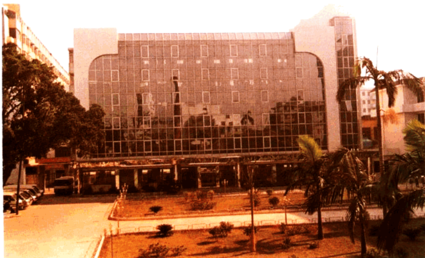
江门海关办公楼副楼