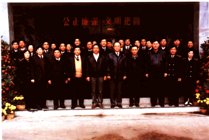
1993年1月21日海关总署署长戴杰到江门海关视察