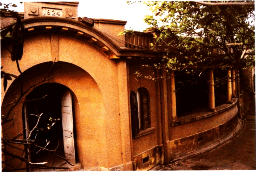
建于 1924 年的原江门关税务司公馆，位于海关大院山顶