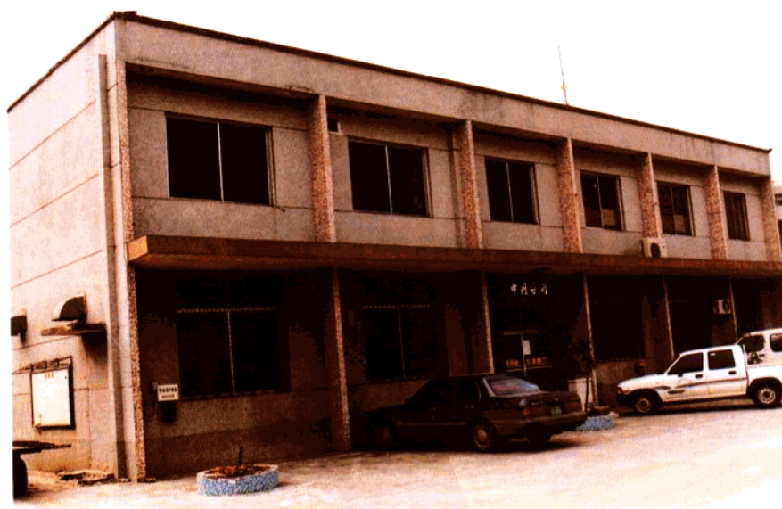
鹤山海关货柜车场 1987年12月-1990年6月为江门海关驻鹤山工作组