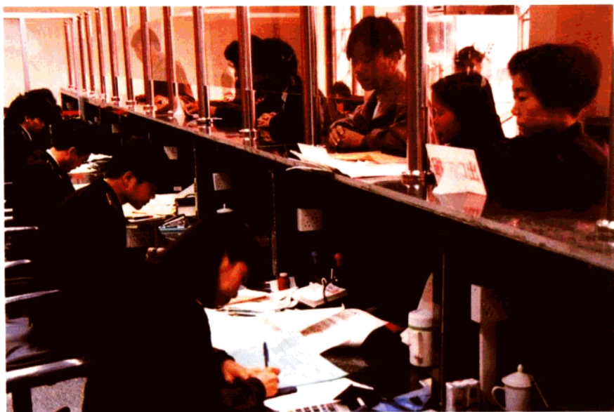
办理进出口货物报关手续