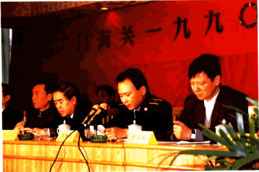
海关总署副署长吴乃文、江门市市长李熊光 参加江门海关1990年度表彰大会