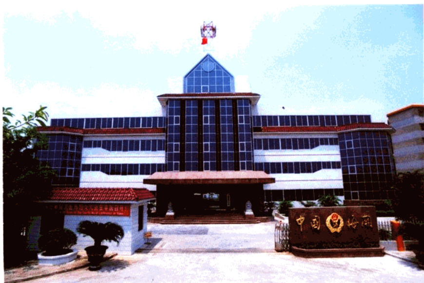
位于开平市的三埠海关办公楼