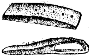
图 A2 七孔石刀、石匕首

同一时期的鹿港庙一座女性墓葬中，也发现大小形状一致，经过打磨的 785 粒骨珠。之后在新石器时代晚期的山东宁阳大汶口、南京阴阳营等龙山文化遗址中，都发现大批玉石玛瑙器和骨雕。从发掘时的记载来看，阴阳营共出土玉石玛瑙器 283 件，其中有放置在死者耳部的玉块，可能是耳坠之类饰物。玉璜一类则放置在死者腋下，可能是项练的部分。其余大小不同的玉珠、玉管、玉坠之类，都分别放置在死者头、颈、腰各部，由此可以断言它们是一整套佩带用装饰工艺品。大汶口 13 号墓中的女尸头部放有马蹄形象牙梳子和管石珠，颈和胸部放有用石珠、玉珠、石环、玉环、绿松石等混合穿成的串饰，手部有玉质管环和指环。墓葬品中还有镂空的象牙筒和骨筒，梳子和筒形器，雕刻技艺精巧，达到了刀法流畅有力不露板结痕迹。（图 A2）。