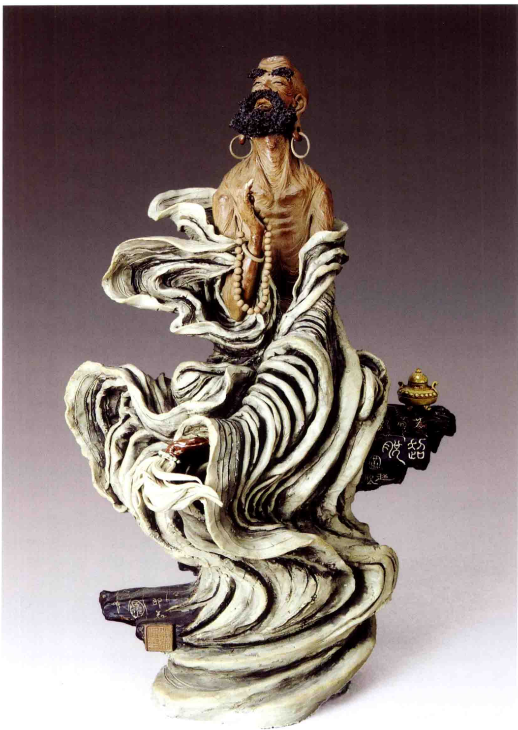
《超脱》(原作) 高45厘米 2003年

作品《超脱》,以一个道行高深的罗汉造型,表现现代人通过不断努力,逐渐升华到一种新境界的超然神态瞬间。作品采用了独创的陶艺手法——“线塑”,吸收了传统中国画线描“十八法”创作手法,用泥条代替线条来刻画形体的形、神、面,每条线条粗细随着形体的变化而变化。颜色上,作品吸收了中国水墨画“墨分五色”的表达效果,使作品看起来犹如一幅立体的中国水墨画。黄志伟的老师——中国著名雕塑家潘鹤先生对此评价:“继传统、创前卫”!