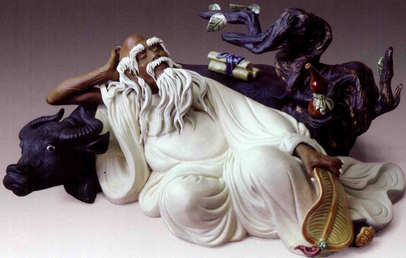
《悠闲老子》 高15厘米×宽30厘米×深22厘米 1998年

作品是把再现性的艺术与中国艺术精神的核心——自然论有机结合。通过对著有《道德经》，被奉为道家始祖的老子的悠闲自得神态的塑造，表现了其“道法自然”的思想及清静、无为的精神世界融于天地之中，感悟自然与自然之道息息相通，使天人浑化一体。