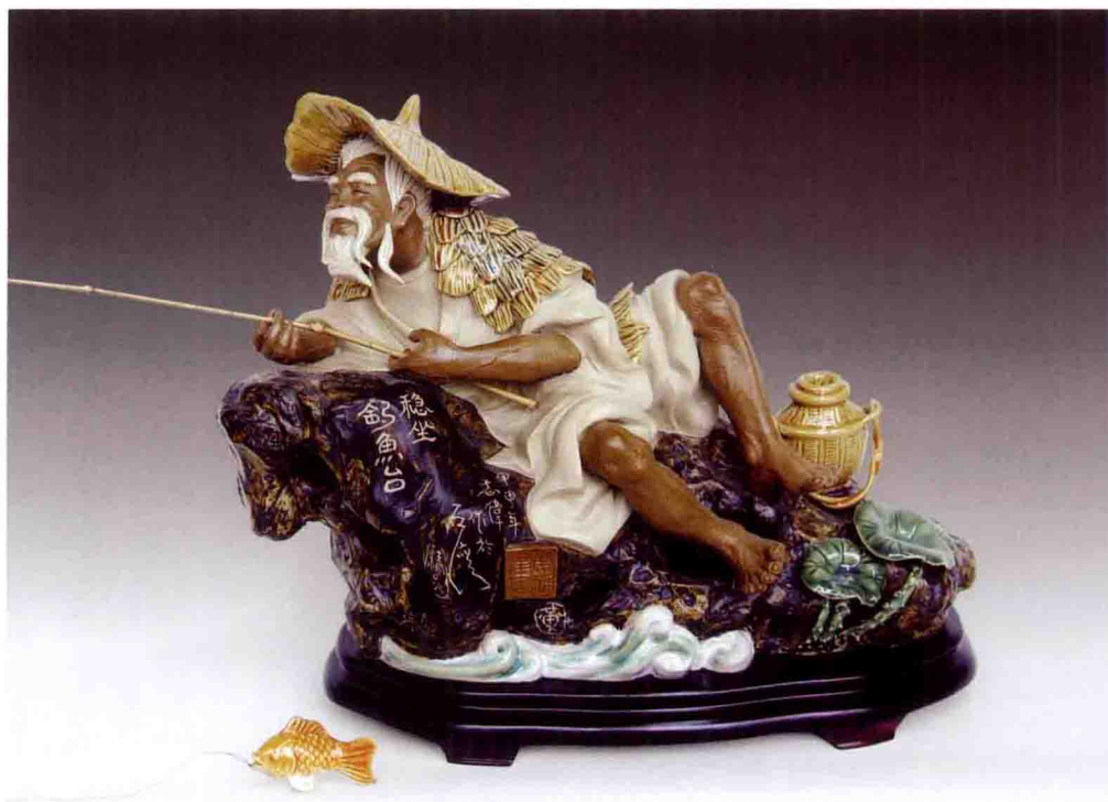
《稳坐钓鱼台》 高20厘米×宽30厘米×深16厘米 2004年

作品表现了平凡生活艺术化，情趣化，使人感到“夏日虽炎夏荷香，清江垂钓意趣长”的诗情画意，大胆地变常规的竖式构图为横面布局。