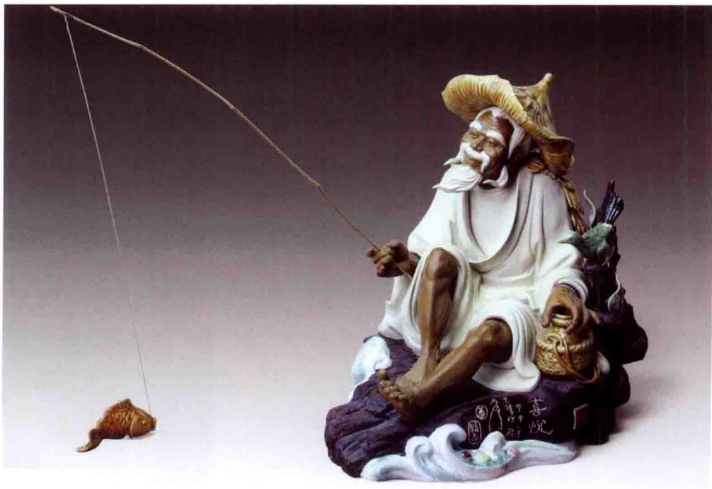
《喜悦》 高30厘米×宽30厘米×深25厘米 2004年

作品表现了平凡生活艺术化，情趣化，使人感到“夏日虽炎夏荷香，清江垂钓意趣长”的诗情画意，大胆地变常规的竖式构图为横面布局。