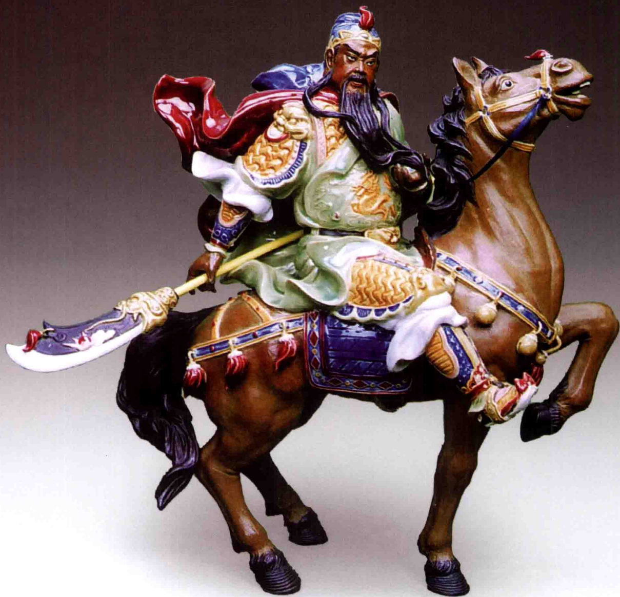
《关云长》 53厘米×55厘米 2002年

关云长是三国时期人，民间广为流传的令人尊崇的忠勇英雄人物，是石湾陶艺作品几百年来老题材，但作者在塑造作品时不落俗套，①取传统之精雕细塑和现代雕塑空间体积感的结合，互相协调。②衣纹在写实基础上，艺术地展扬流畅。③色彩丰富，统一中求变化，打破传统单一色彩，使人物神采奕然。本作品限量生产500件，更具收藏潜力。