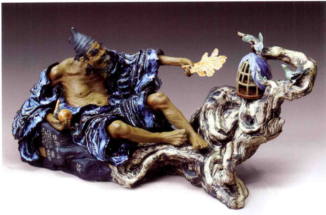
《快乐济公》 高30厘米×宽50厘米×深22厘米 2009年

作品通过塑造济公活佛,在一古树旁上逍遥自在,与枝头小鸟怡情和唱的造型,表达了人们对和谐、快乐社会的追求。 本作品限量生产99件,更具收藏潜力。