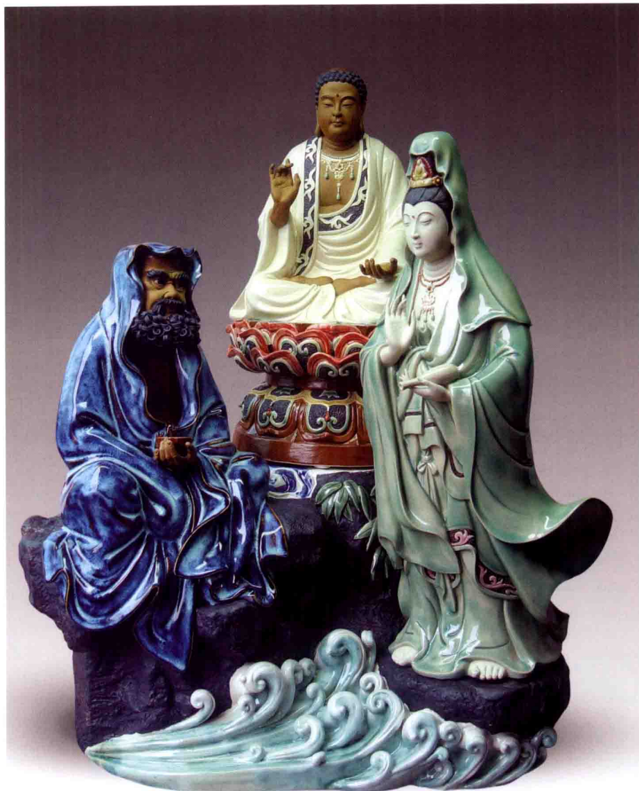
《和谐社会》 高58厘米 2009年