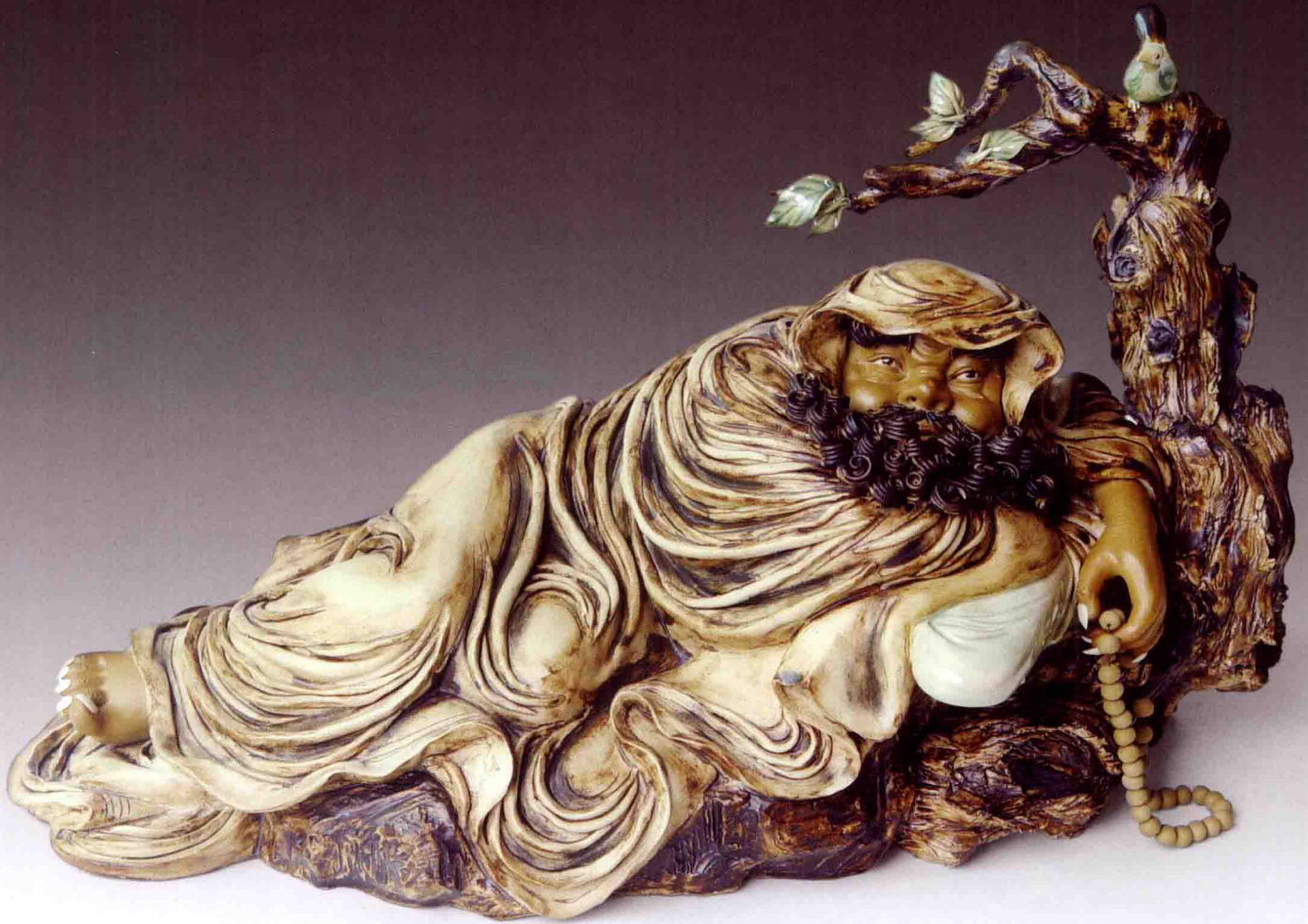
《怡情达摩》 高23厘米×宽38厘米×深23厘米 2006年

达摩是古代南天竺国香至王第三子，从般若多罗出家，后机缘成熟，在中国南北朝时期到中国传法，后被奉为禅宗初祖。禅宗是佛教的分支，作品通过塑造达摩祖师斜靠在一古树上与枝头小鸟怡情和唱，表达了禅宗让人当下顿悟，断诸烦恼，解除束缚，随缘放旷，逍遥自在的主张。