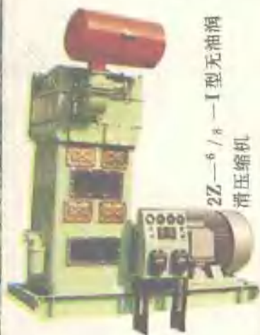
2Z—6 / 8—I型无油滑 压压缩机