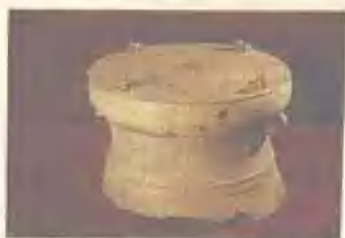
古代铜鼓（冷水冲型飞鹅路出土）