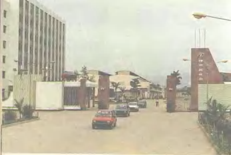
柳州机械厂——广西机械工业的摇篮