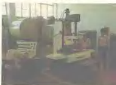
广西工学院研制成功的大功率激光器