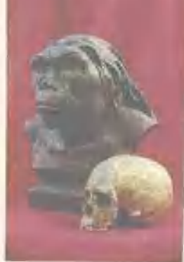
“柳江人”头盖骨及复原像