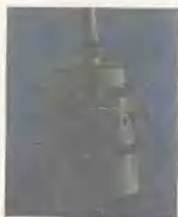
战国变形蝉纹鬲铜（太阳村出土）