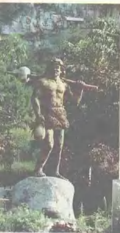
古代柳州城池 ——东门城楼