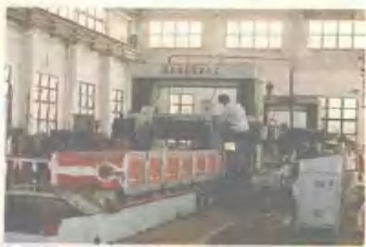
柳州第二空压机总厂 机加工车间