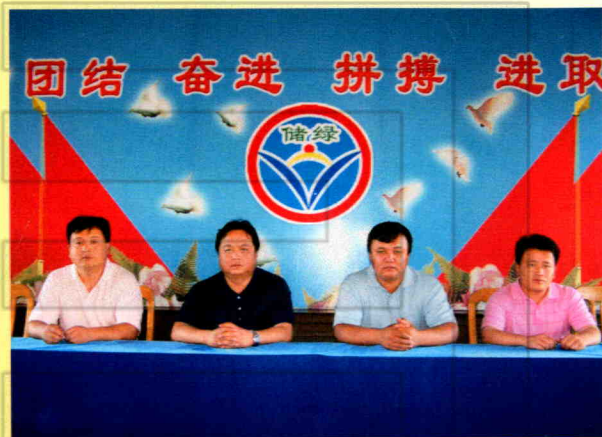
团结奋进的领导班子