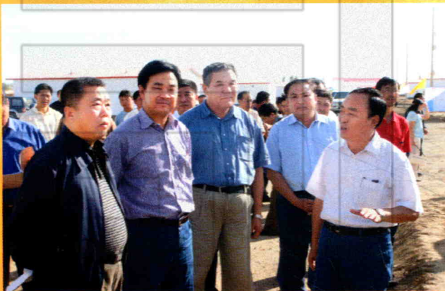
2007年9月7日，自治区牧民定居现场会在塔城市齐巴尔吉迭牧民新村召开。图为塔城市委书记李世玉为参加会议的自治区副主席钱智（左一）、地委书记彭家瑞（左二）等领导介绍情况