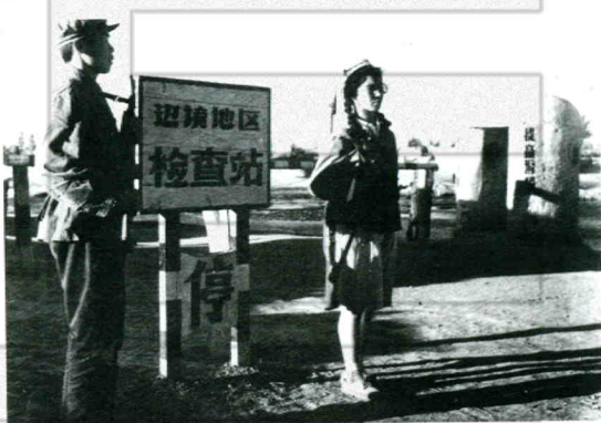
20世纪90年代民兵在边境检查