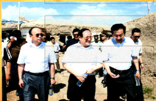
2006年6月18日，自治区副主席贾帕尔·阿比布拉在行署副专员买买提江·阿不拉、塔城市市长努尔岚·赛迪等地市有关领导的陪同下察看塔城市雹灾情况