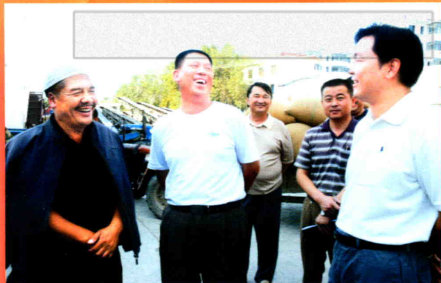
2005年8月1日，地委书记彭家瑞来塔城市调研时与农民亲切交谈