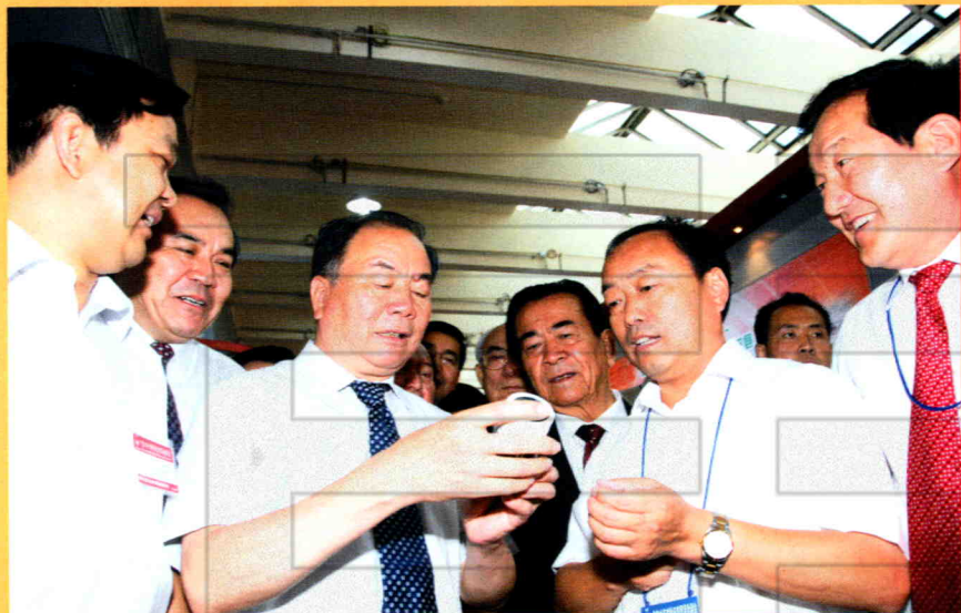
2007年9月1日，中共中央政治局委员、自治区党委书记王乐泉，原全国人大常委会副委员长铁木尔·达瓦买提，自治区领导司马义·铁力瓦尔迪等人在地区领导彭家瑞、铁力瓦尔迪、张其洲、王建新、许明军的陪同下参观塔城市展位