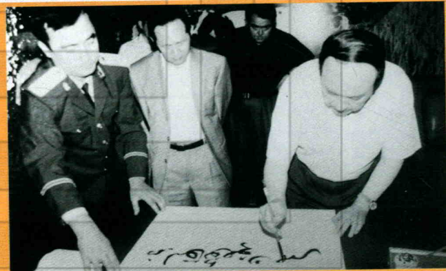
全国人大常委会副委员长司马义·艾买提视察巴克图口岸题词