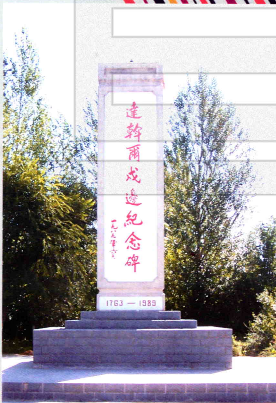
达斡尔戍边纪念碑