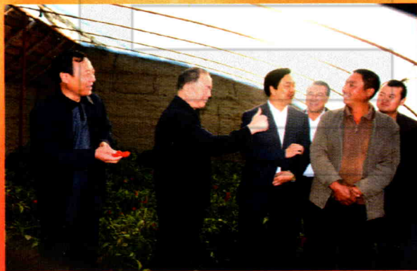
2006年10月3日，中共中央政治局委员、自治区党委书记王乐泉调研塔城市设施农业