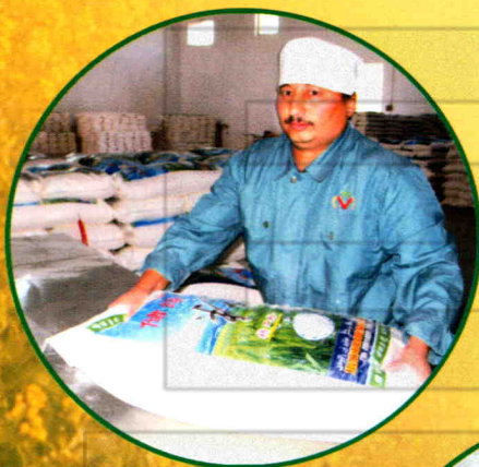
工人在车间忙碌工作

自2002年以来，公司在粮食市场全面开放的新形势下，更新经营理念，创新经营模式，走“产业化经营，规模化生产”发展之路，商业转工业成绩显著，使企业规模不断扩大，市场竞争力不断增强，经济效益不断提高，国有资产不断增值，职工收入稳步提高。