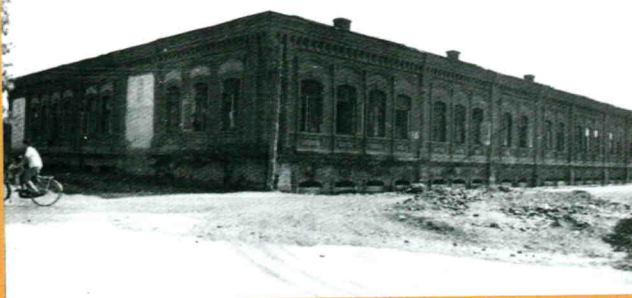
红楼 (1914年建)