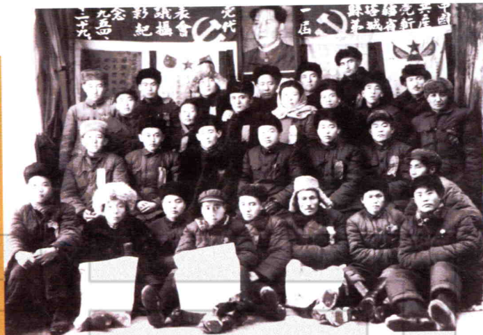
1954年中共新疆省塔城县第一届 党代表会议留影