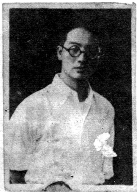
作者 1933 年十九 歲在上海求學時影