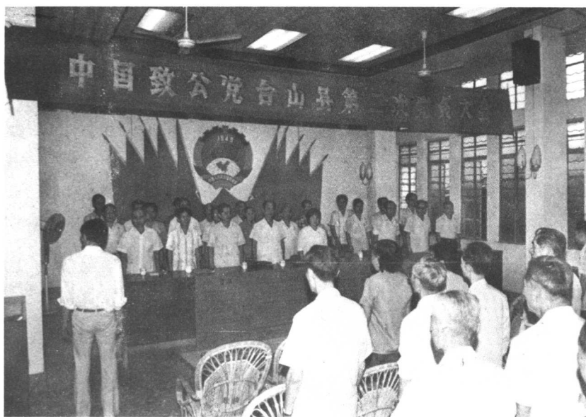
本党台山县第二次党员大会于1988年8月26日在县政协礼堂召开