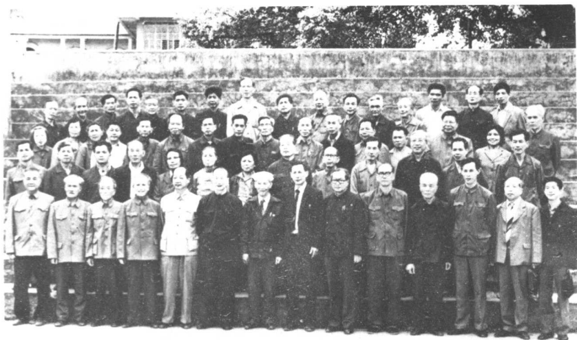
本党台山县第一届委员会成立时，全体党员与领导、嘉宾合影