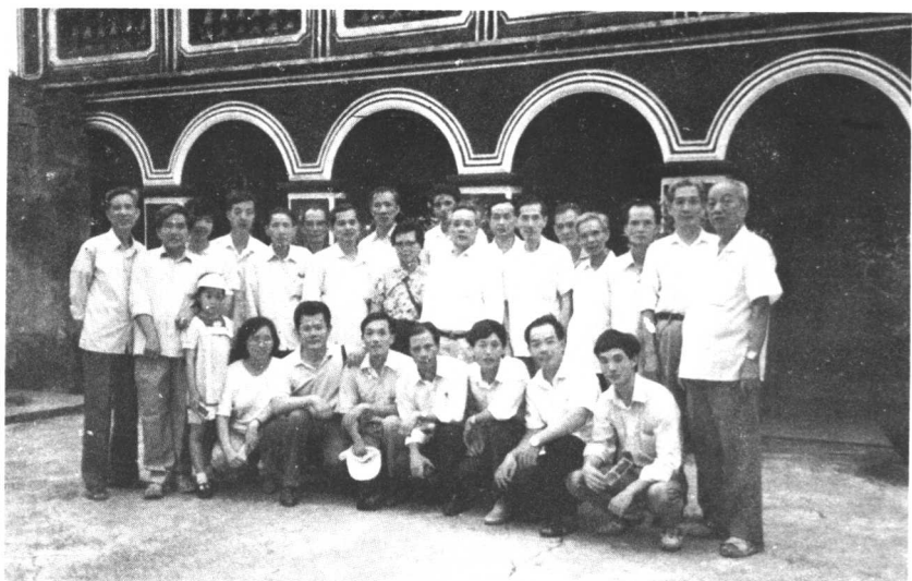
一九八九年十月一日本会组织党员与致华教师参观 中山市翠亨中山故居