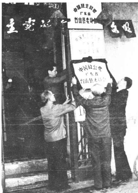
致公党台山县委会（一九八四年） 办公地址：台城西濠路二号地下阁楼