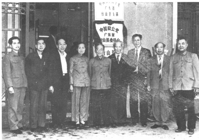
本党台山县第一届全体委员于1984年3月15日在县委成立“挂牌”后合影