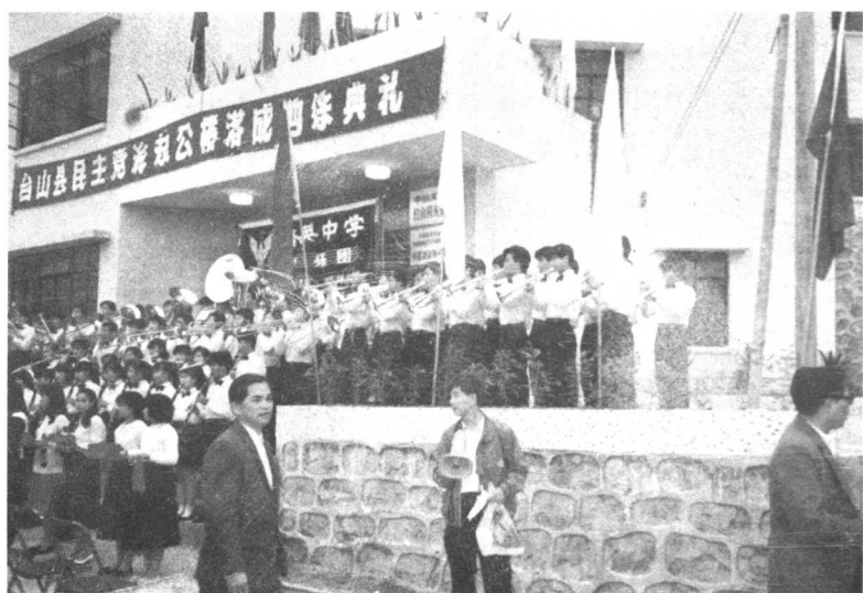
本党台山县委会（一九八九年） 办公地址：台城双亭街十四号