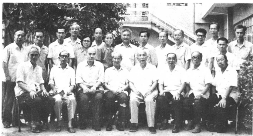
中国致公党中央黄鼎臣主席蒞临台山指导合影留念 81.9.3