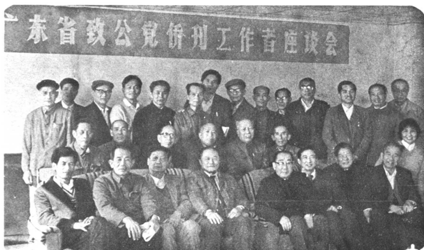
1987年12月8日，本党省委会在台山召开“广东省致公党侨刊工作者座谈会”。图为与会者合影。