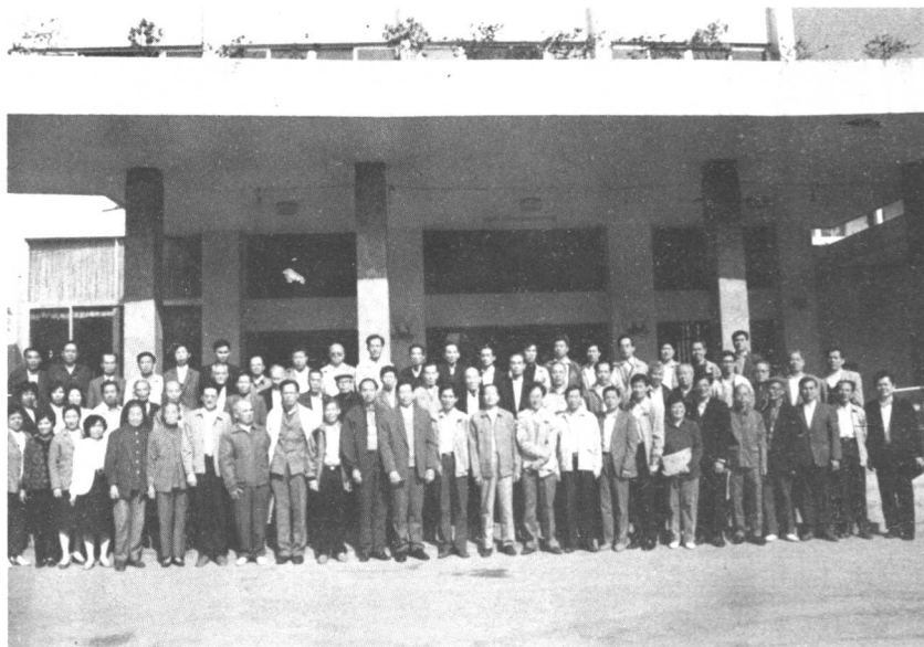
本党台山县第三届委员会成立时，全体党员与领导、嘉宾合影