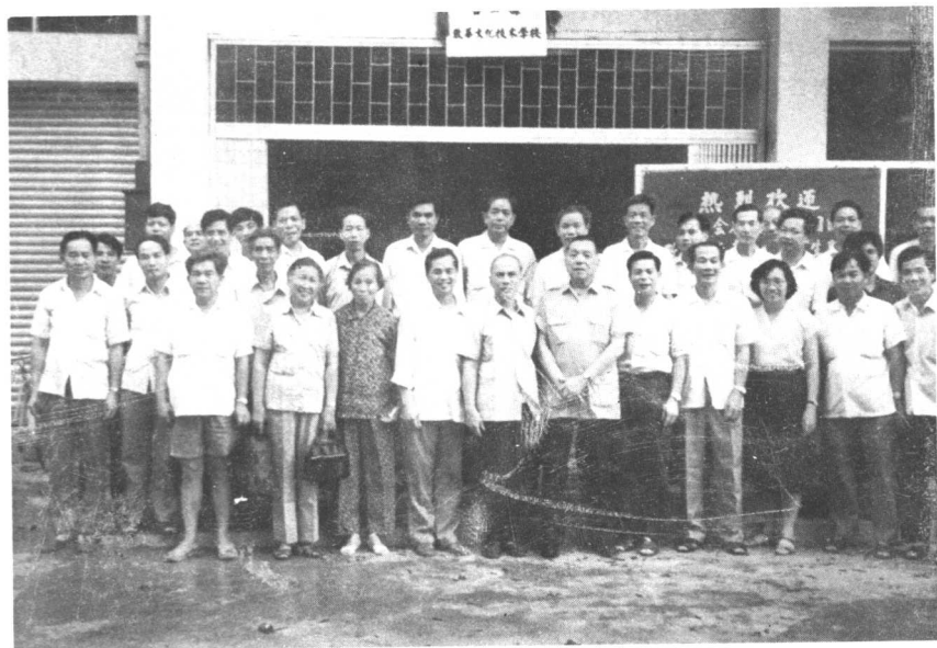
台山致华文化技术学校（高中部）迁址仪式结束后 本会领导、嘉宾、教师合影