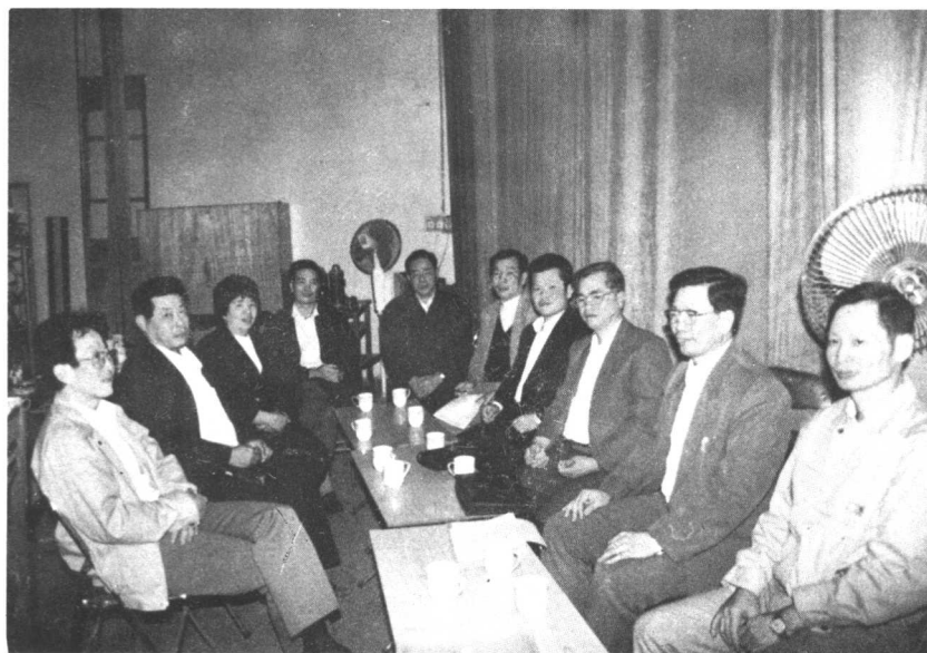
本会第三届全体委员与有关领导在会议时合影