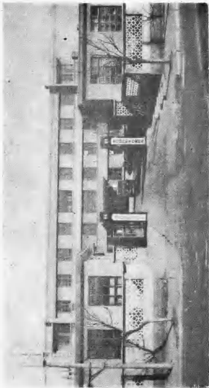
安丘县计划生育委员会、安丘县计划生育宣传技术指导站办公址。