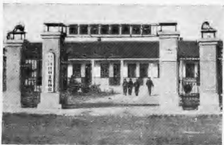
景芝镇计划生育宣传技术服务站住址。 1985年3月动工兴建，同年底竣工。