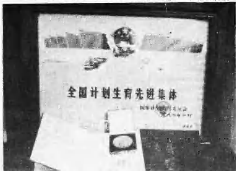
国家计划生育委员会授予安丘县计划生育委员会1985年度“全国计划生育先进集体”。