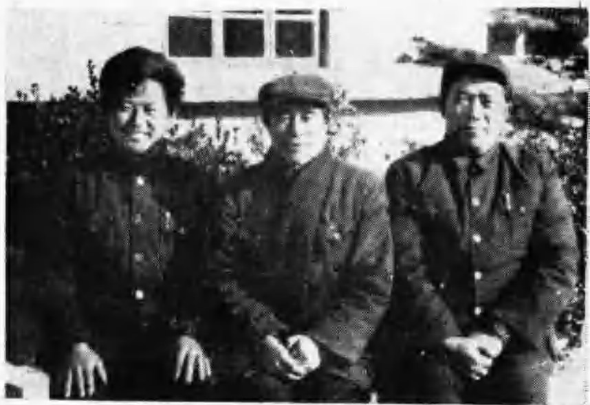
安丘县计划生育委员会主任照片。