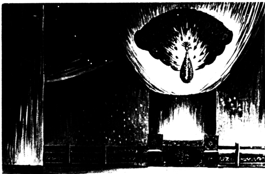
秦腔《凤冠梦》第三场布景气氛图