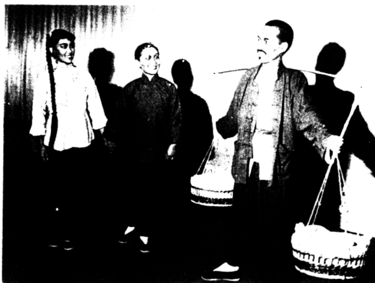
秦腔《一担麦种》剧照