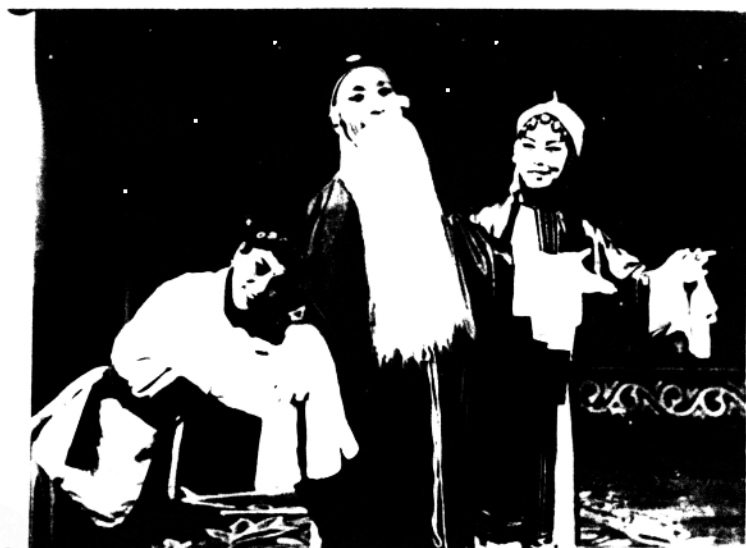
秦腔《三娘教子》剧照