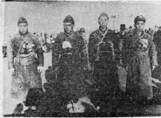
一九四五年春，广北开展了轰轰烈烈的大参军运动，这是大宋村一门四英雄。