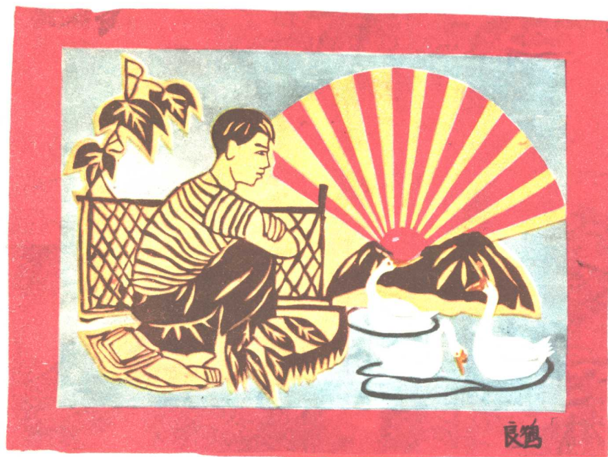
11. 士兵牧鹅 陈良鹤