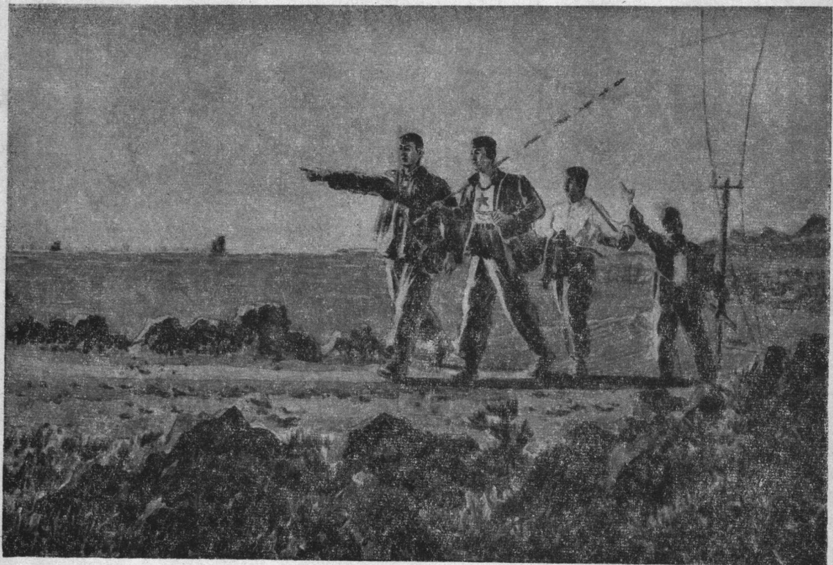
13. 建設祖国海防的尖兵