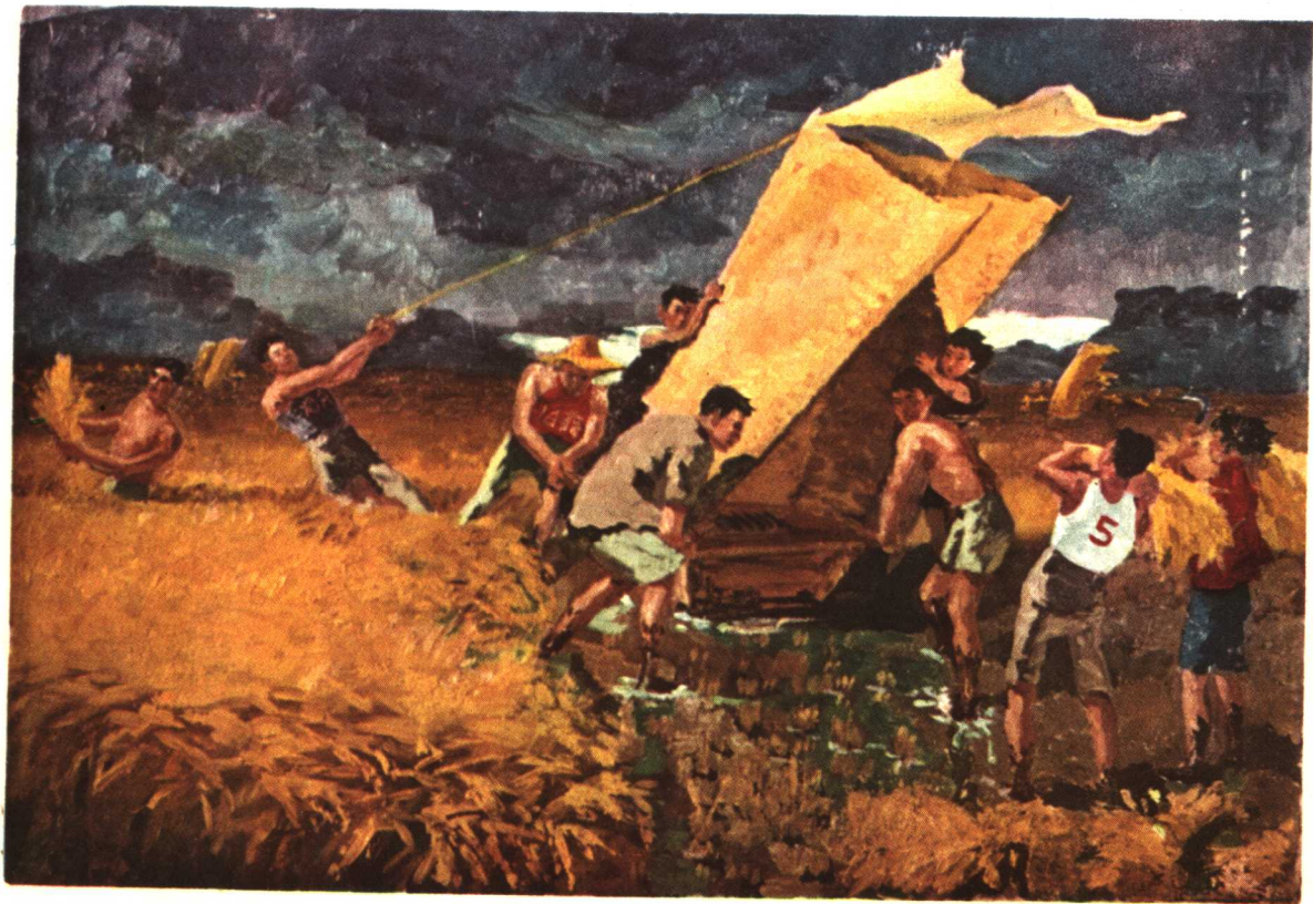
5. 搶 收