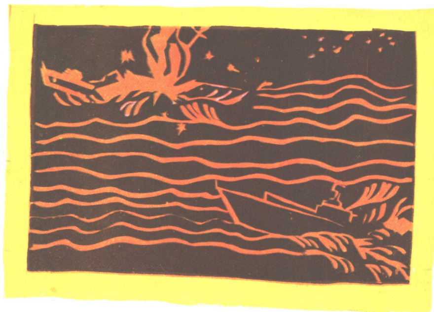
12. 击沉太平号 王顺仁