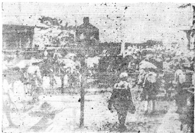
▲中国人民解放军解放嘉兴后，继续向南进发（上图为嘉兴火车站）▲