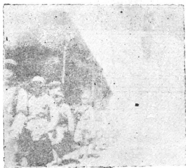
▲中国人民解放军进入海盐县城