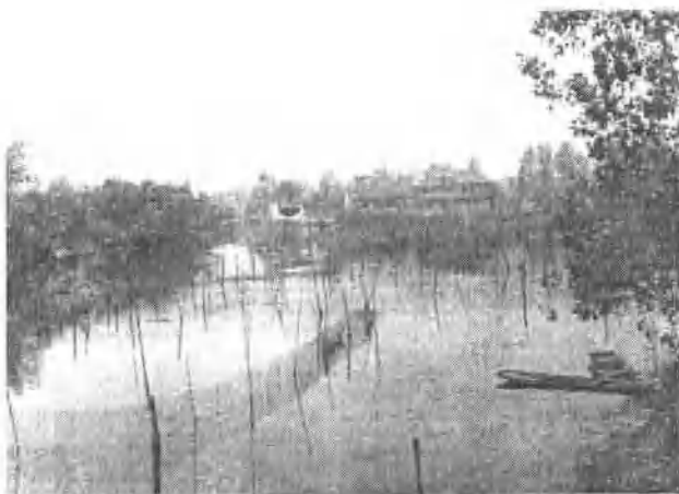
△ 位于鲁垛镇陶林村的“九龙口”远眺。 当年这里是日寇的据点。