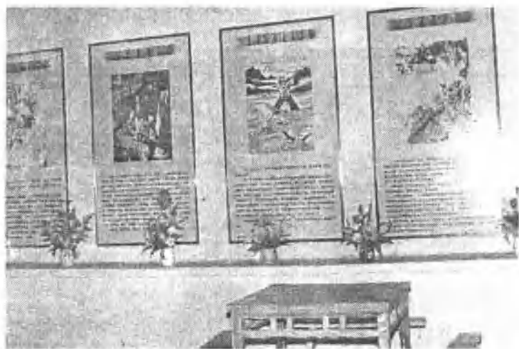
△ 广洋湖镇白鼠村革命史料陈列室内景。