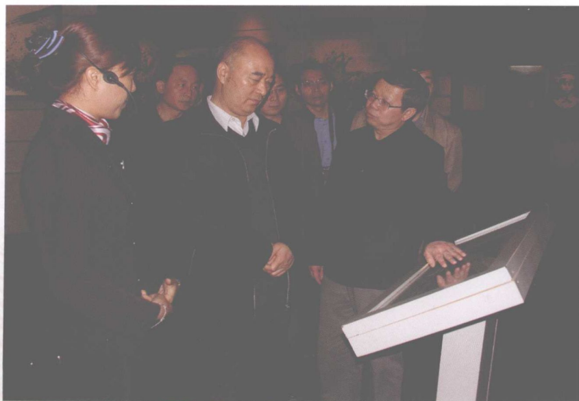
2011年4月8日，中央军委委员、空军司令员许其亮上将参观百色起义纪念馆。