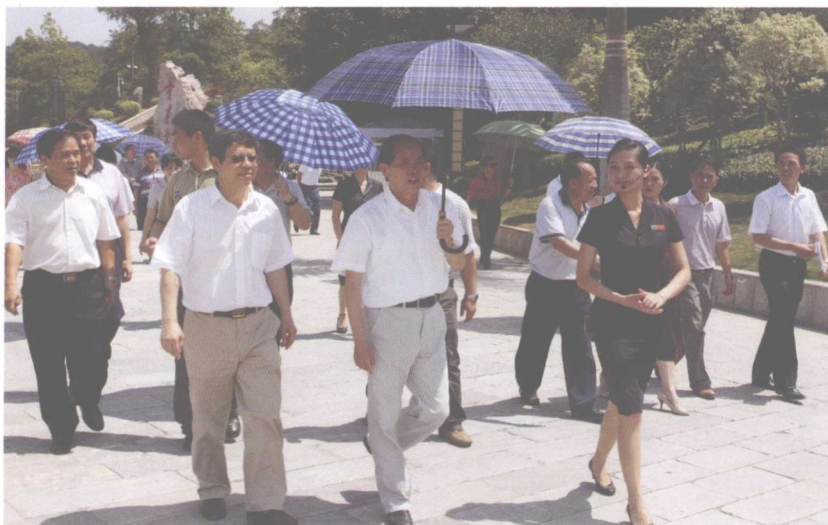
2011年6月4日上午，全国政协副主席李兆焯莅临百色起义纪念公园参观指导工作。