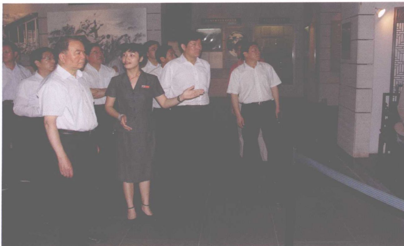
2011年4月22日上午，中共中央政治局委员、中央政法委副书记王乐泉参观百色起义纪念馆。