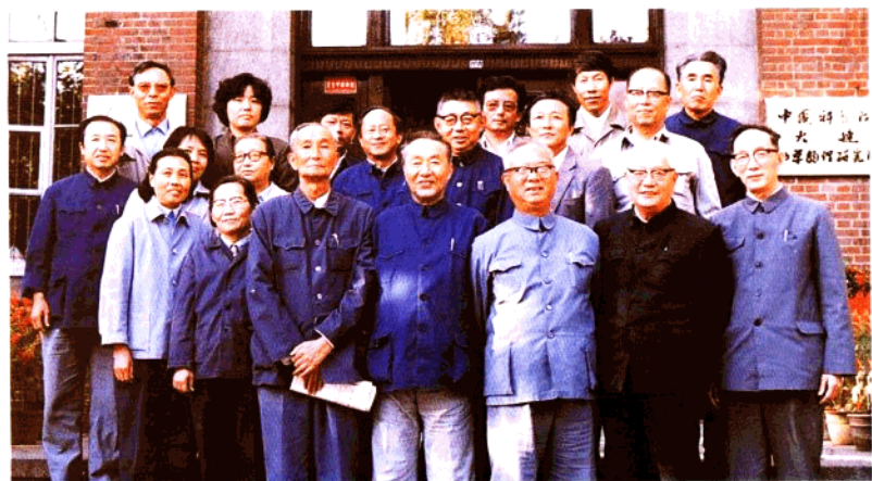
大连化物所民盟盟员合影（1988年）。