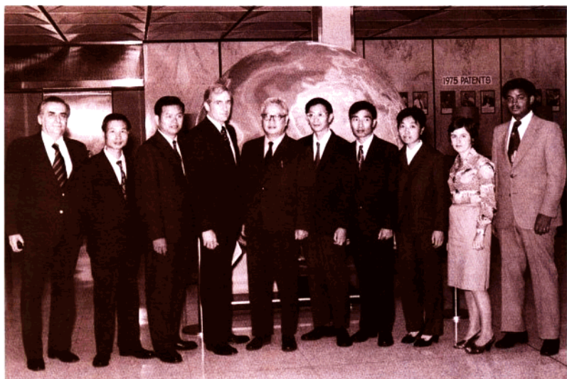
华盛顿美国环境保护局（EPA）实验室负责人接见中国科学院环境科学考察团时留影（1976年）。