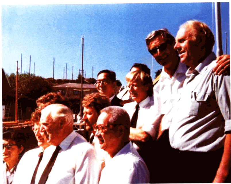
▲1993年6月出席联合国第二届环境理事会议（瑞士日内瓦）。随瑞典海上警卫队考察该国近海环境治理。