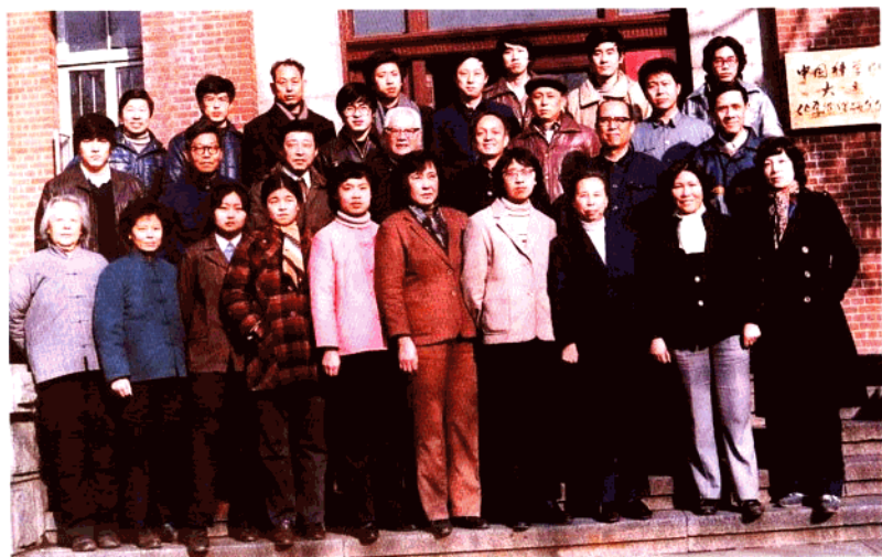
中空纤维膜氮氮分离器（I型）攻关组全体人员合影（1983年）。