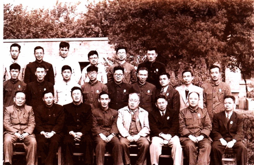
▲ 1956年5月中科院领导接见参加全国先进生产者代表会议的本院代表时合影。前排右起第7.8.9分别为张劲夫、郭沫若、钱学森，二排右起第5人为朱葆琳。