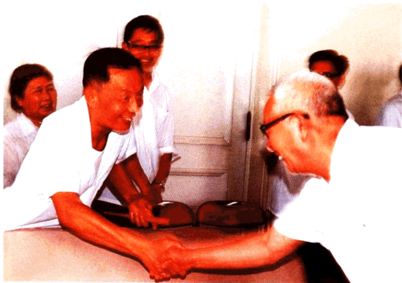
1983年原国务委员、中科院党组书记、副院长张劲夫到大化所视察工作。