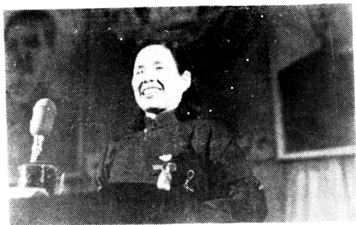
1951年在武汉市第一次劳模代表大会上