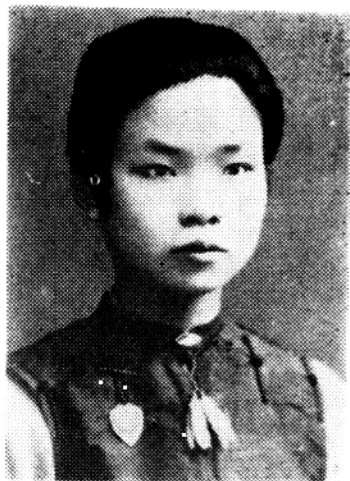
1927年5月在武 昌任小学教员