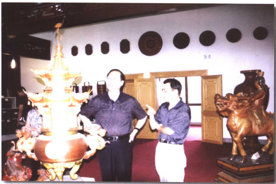
▲ 中国轻工业联合会副会长王世成参观工艺美术展览会