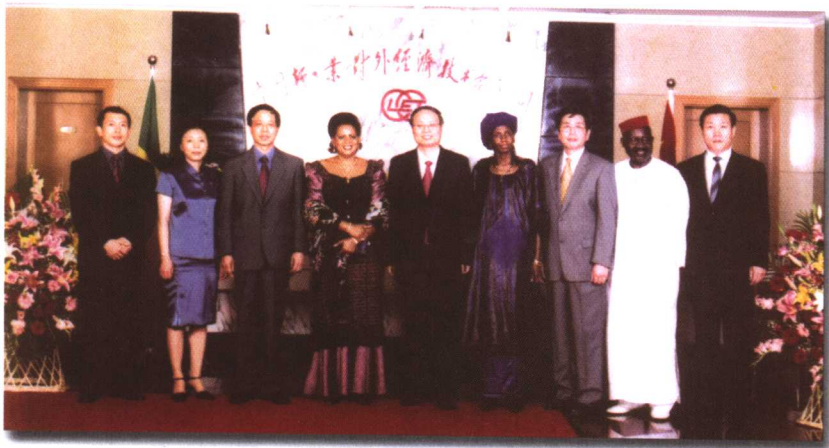
马里总统夫人(左四)来公司访问