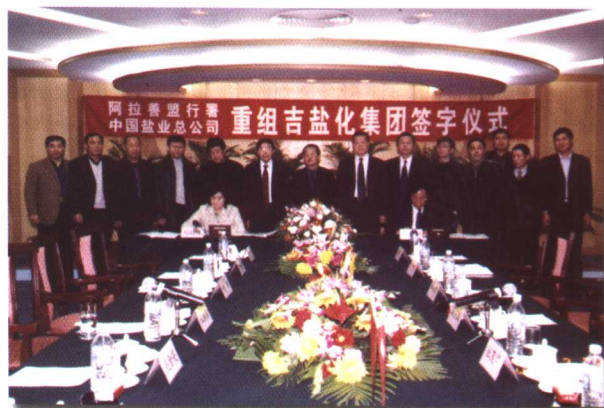
中国盐业总公司与内蒙古阿拉善盟行署重组吉兰泰盐化集团签字仪式