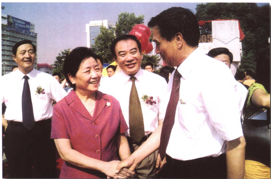
▲ 中国轻工业联合会副会长潘蓓蕾与内蒙古自治区党委副书记、自治区政府主席杨晶(右), 自治区副主席雷·额尔德尼(左), 呼和浩特市市委副书记郭健(中), 在“中国乳都”巨型雕塑揭幕仪式上亲切交谈