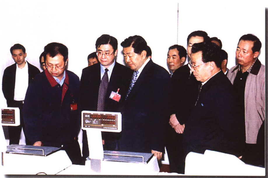
▲ 2004年4月18日, 中共中央政治局常委、全国政协主席贾庆林视察山西太原航空仪表有限公司