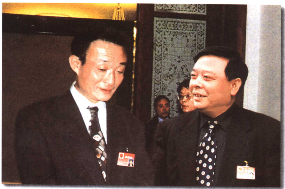
▲ 中共中央政治局常委、全国人大常委会委员长吴邦国与山东太阳纸业股份有限公司董事长李洪信亲切交谈