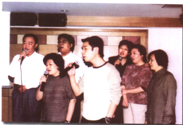
公司职工卡拉OK比赛