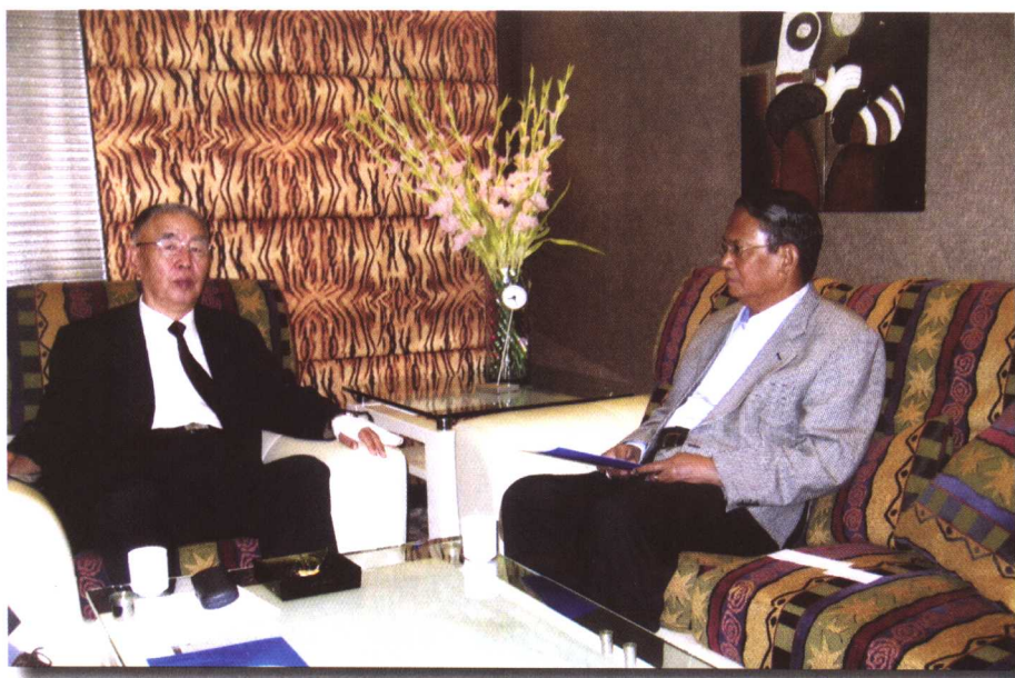
▲ 中国轻工业联合会副会长张善梅会见缅甸第一工业部部长