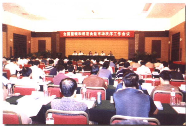
受国家发改委委托,中国盐业总公司主持召开全国整顿和规范食盐市场秩序工作会议