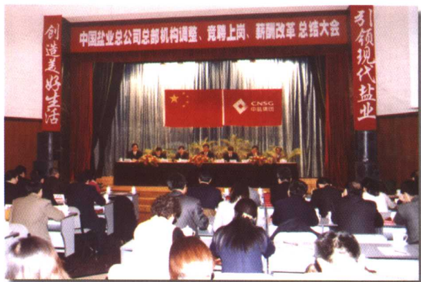
中国盐业总公司总部进行三项制度改革总结大会