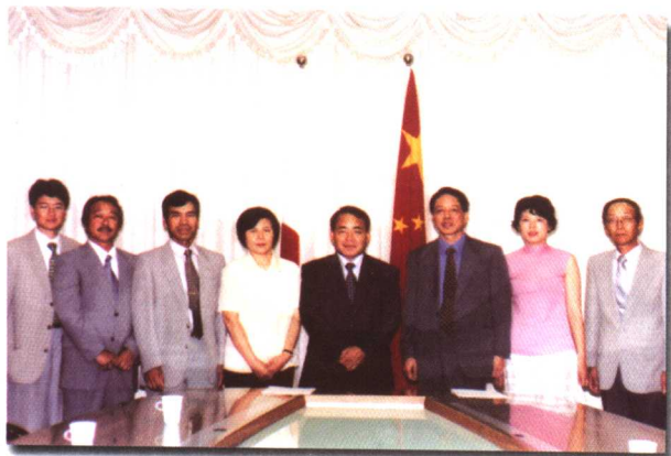
与日本北海道客商签订协议