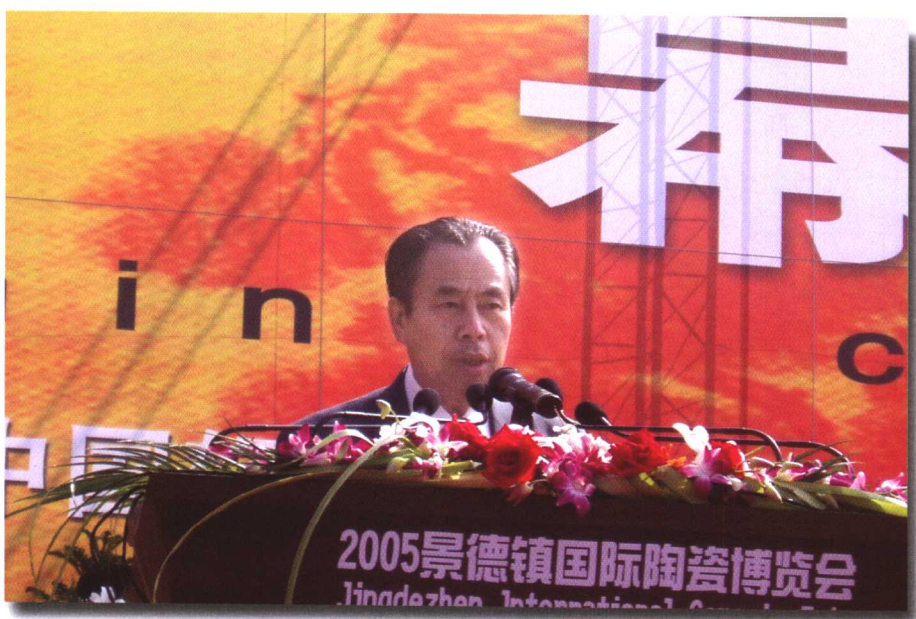
▲ 中国轻工业联合会副会长杨自鹏出席2005年景德镇国际陶瓷博览会开幕式