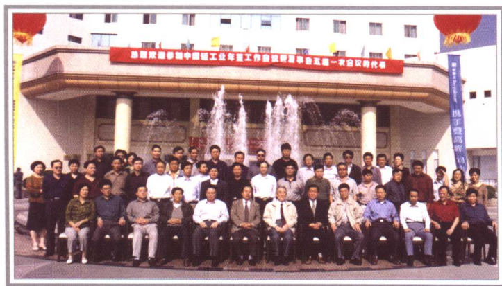
2002年中国轻工业年鉴社董事会五届一次会议代表合影