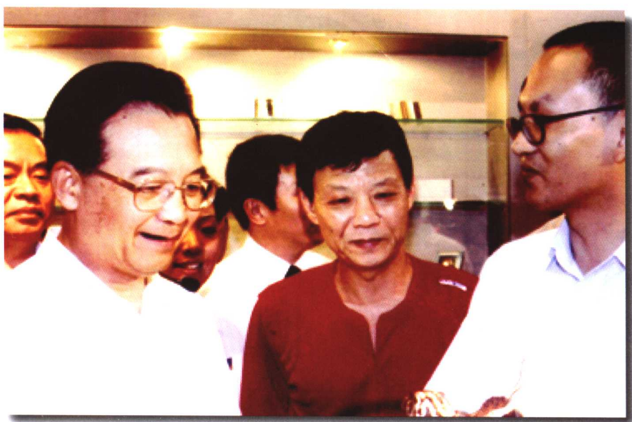
▲ 2004年8月28日, 国务院总理温家宝视察浙江大虎打火机有限公司