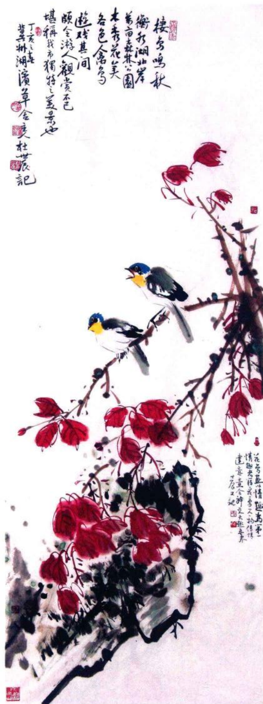
书画名称：栖莺鸣秋 作者：杜世辰 河北省冀州市 河北省美术家协会会员