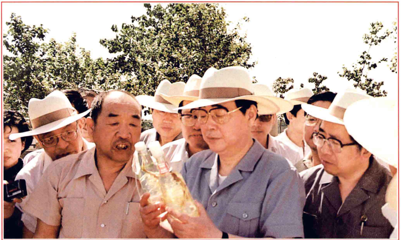
■ 1990年6月15日，国务院总理李鹏视察刘庄