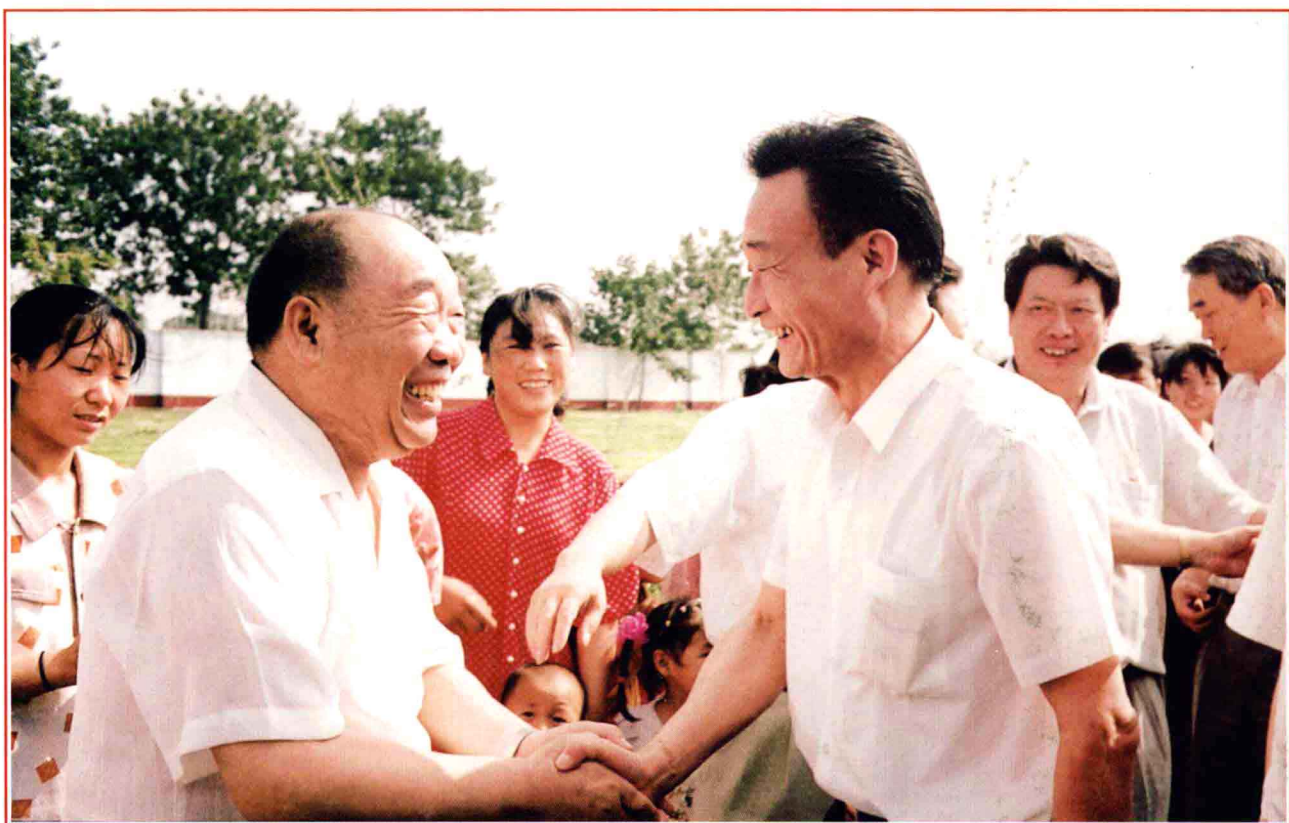
■ 1996年7月2日，国务院副总理吴邦国视察刘庄