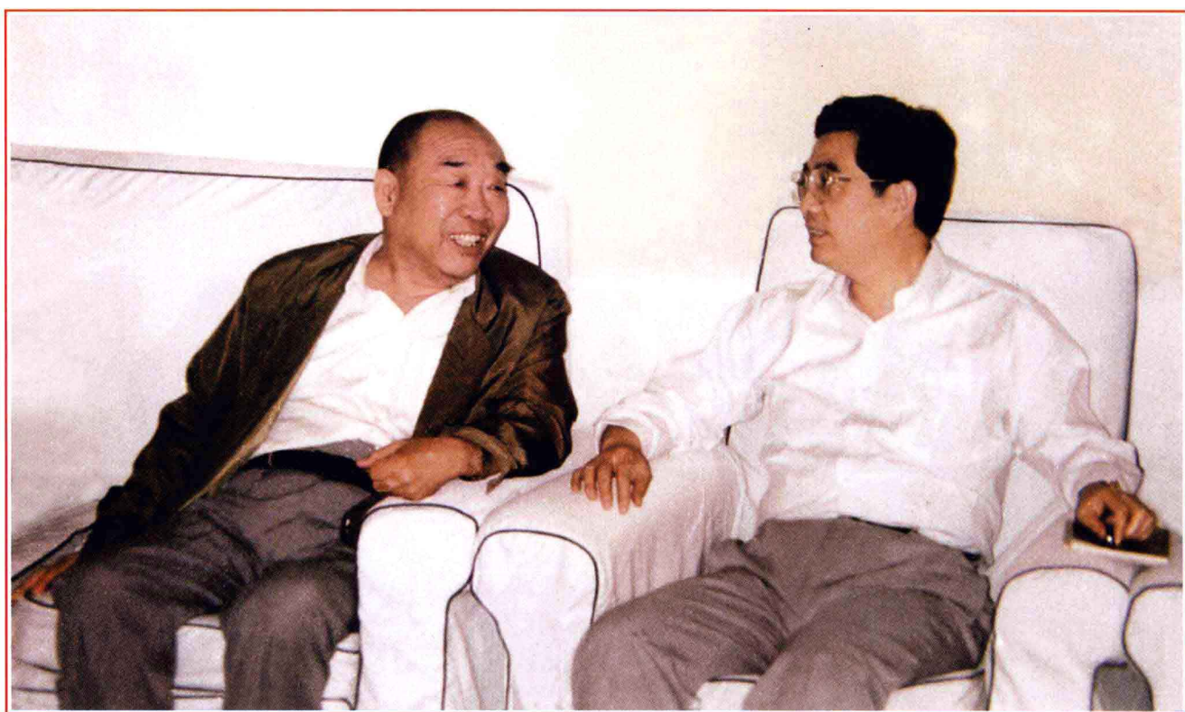
■ 1994年5月12日，中共中央政治局常委、书记处书记胡锦涛视察刘庄，与史来贺亲切交谈