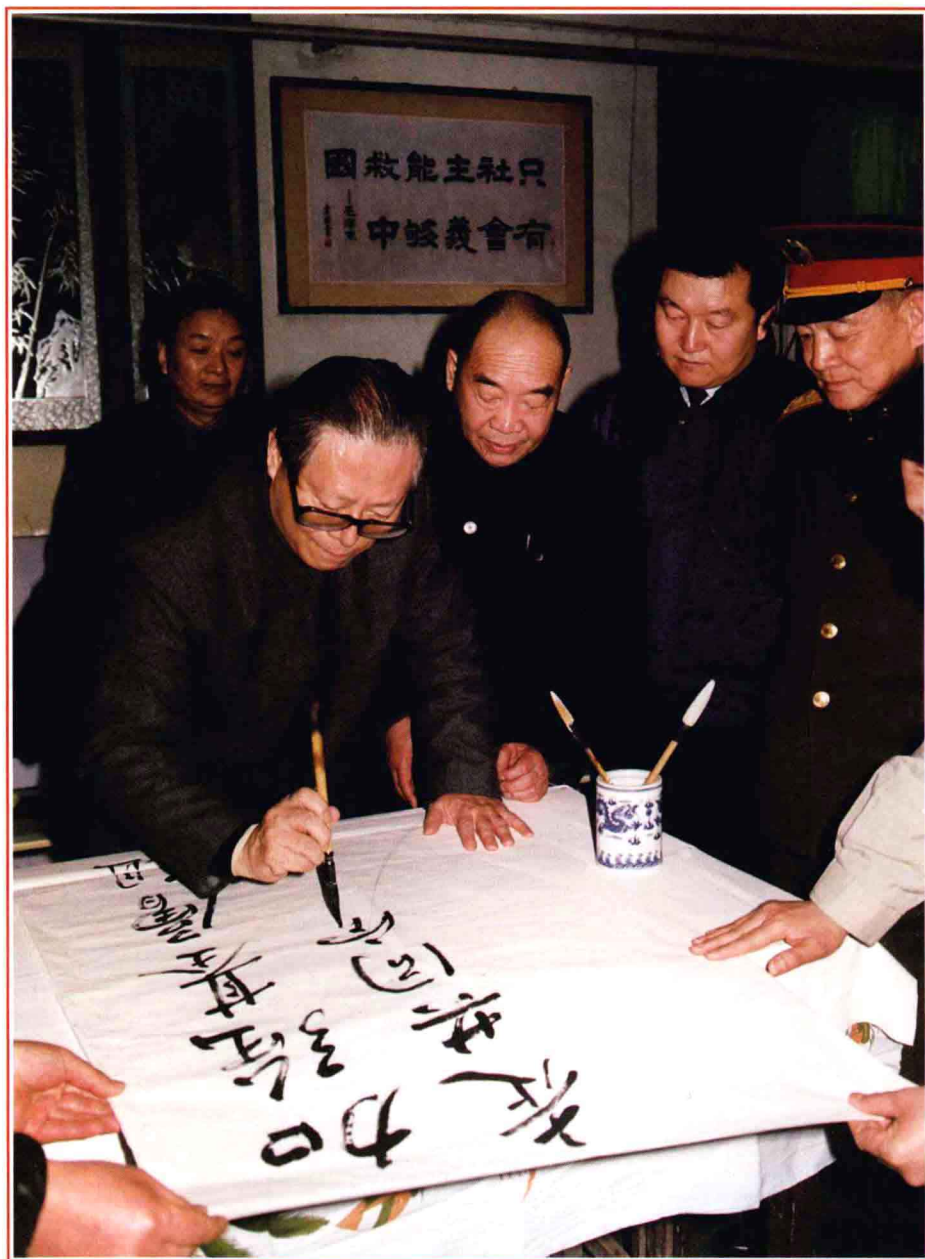
■ 1991年2月6日，中共中央总书记江泽民到刘庄视察，并挥毫为刘庄题词“加强基层组织建设，走共同富裕的道路”