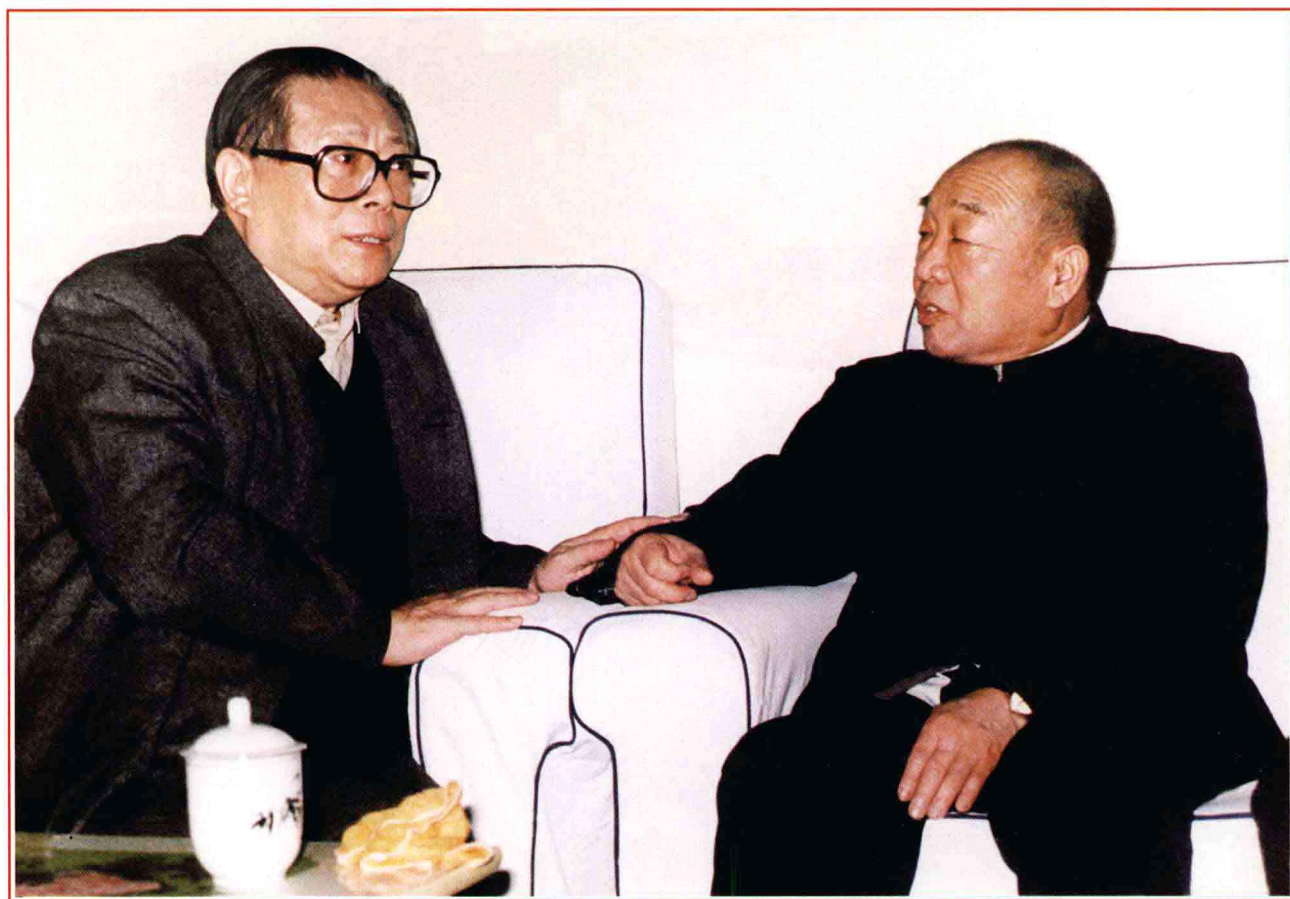
■ 1991年2月6日，中共中央总书记江泽民视察刘庄，与史来贺亲切交谈