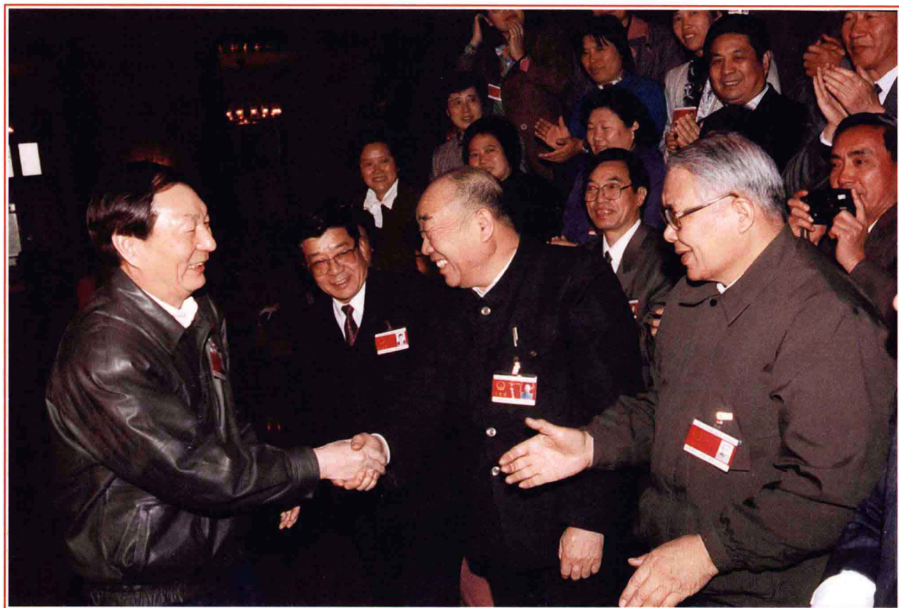
■ 国务院总理朱镕基接见河南代表团代表时，与史来贺亲切握手