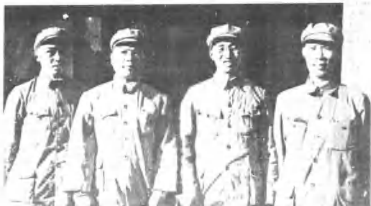
△ 徐向前、周士第（右一）、陈漫远（左二）、 王新亭（左一）在太原前线。