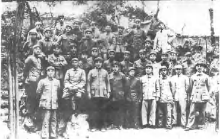
△ 1949年春十九、二十兵团奉命参加太原会战， 组成太原前线总前委。图为徐向前、罗瑞卿、 周士第、柏得志、杨成武、陈漫远、胡耀邦、 李天焕等同志合影。