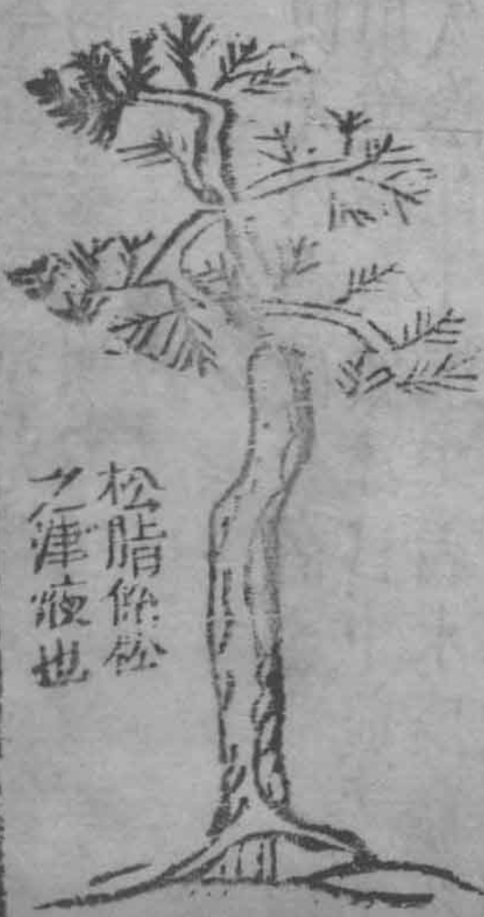
松脂餘松 之津液也