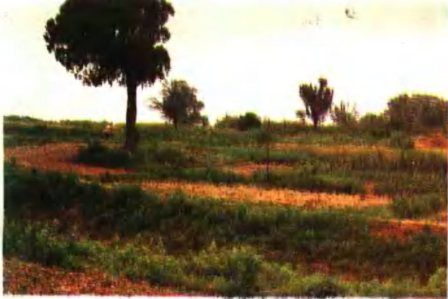
▲ 京山县屈家岭文化遗址，距今四千五百多年，是我国新石器时代长江流域的文化遗存。