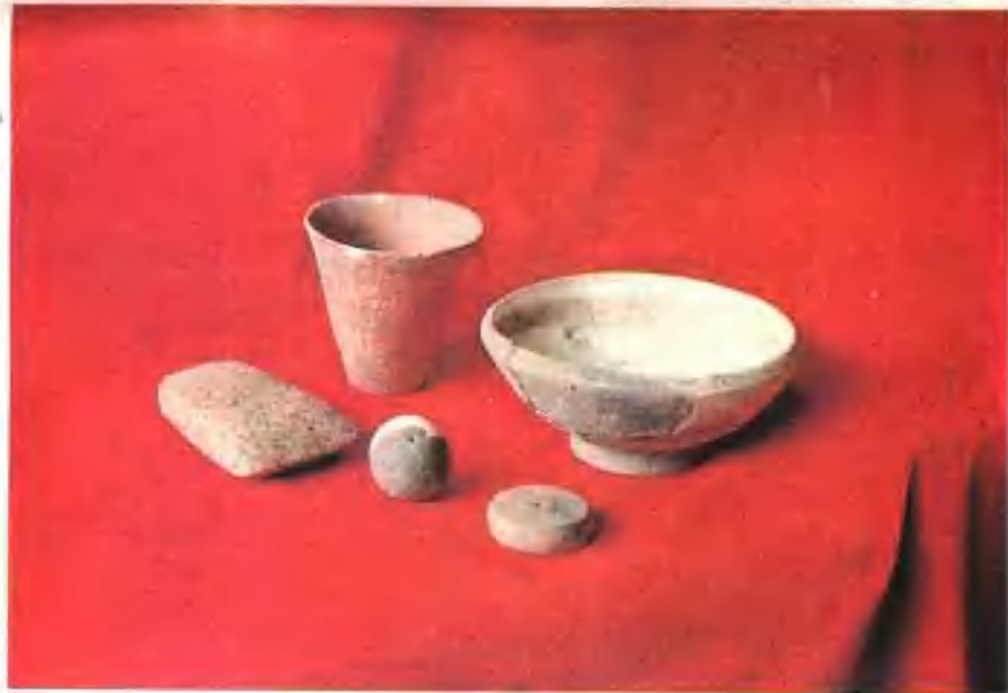
▲ 京山县境内出土的新石器时代的石斧、陶杯、陶球、陶纺轮、陶碗。