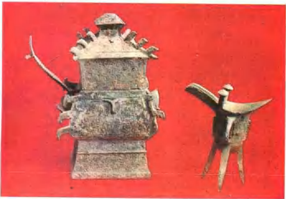
▲ 京山县城西北出土的西周时期的青铜器，提梁铜方鬲、铜爵。