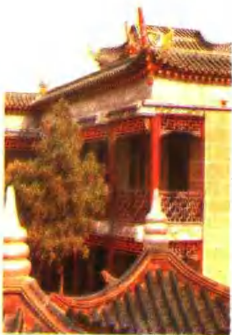
◀ 京山县图书馆一角