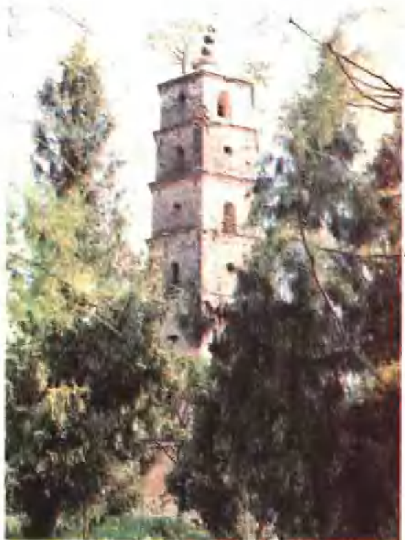
石阶一百二十五级旋转而上， 座塔共六面七层，高十余丈， 京山县城东端川山潭上。这 ▶ 文笔峰古塔，位于