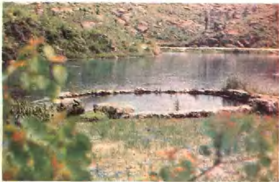
▲ 思故泉，位于京山县宋河区，相传唐太宗时期，新罗国太子随国僧来此学佛，终日思念故乡，泪洒泉内。