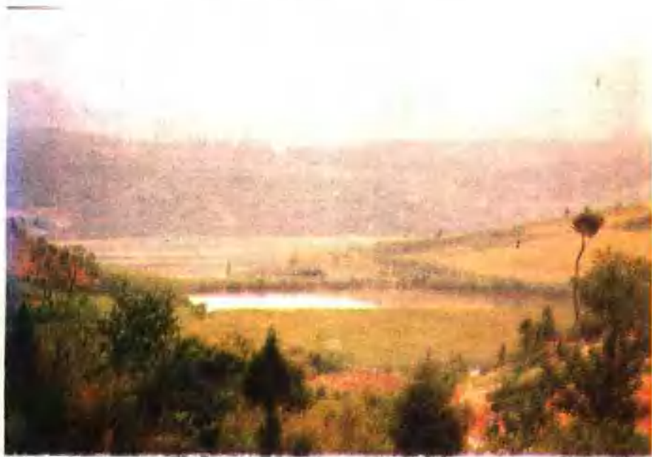
▲ 三王城遗址，位于京山县城北34公里，是西汉末年，王匡、王凤领导的“绿林起义”的屯兵地。