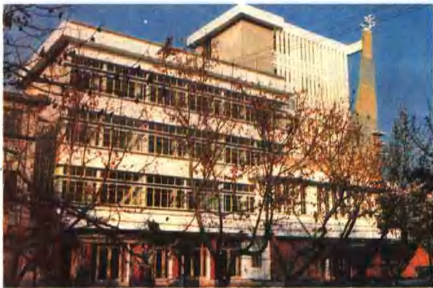
▲ 京山县群众文化馆