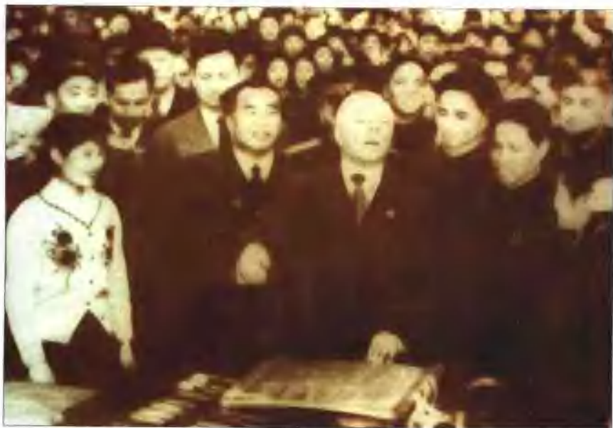
1957年4月20日朱德陪同前苏联最高苏维埃主席团主席伏罗希洛夫视察沈阳电缆厂