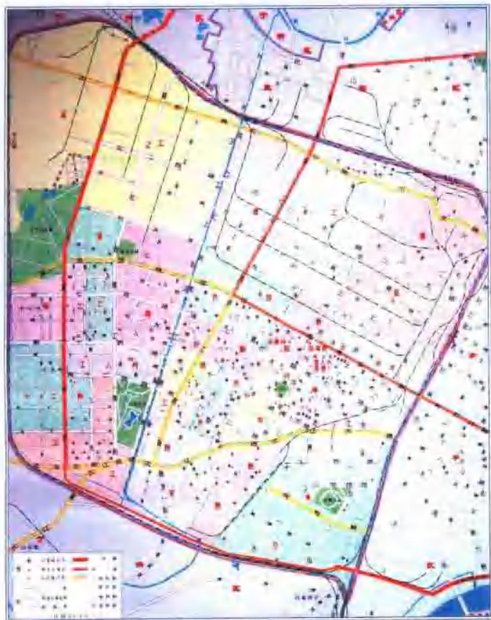
昔日铁西区规划图