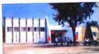
郑家洼子青铜墓出土文物