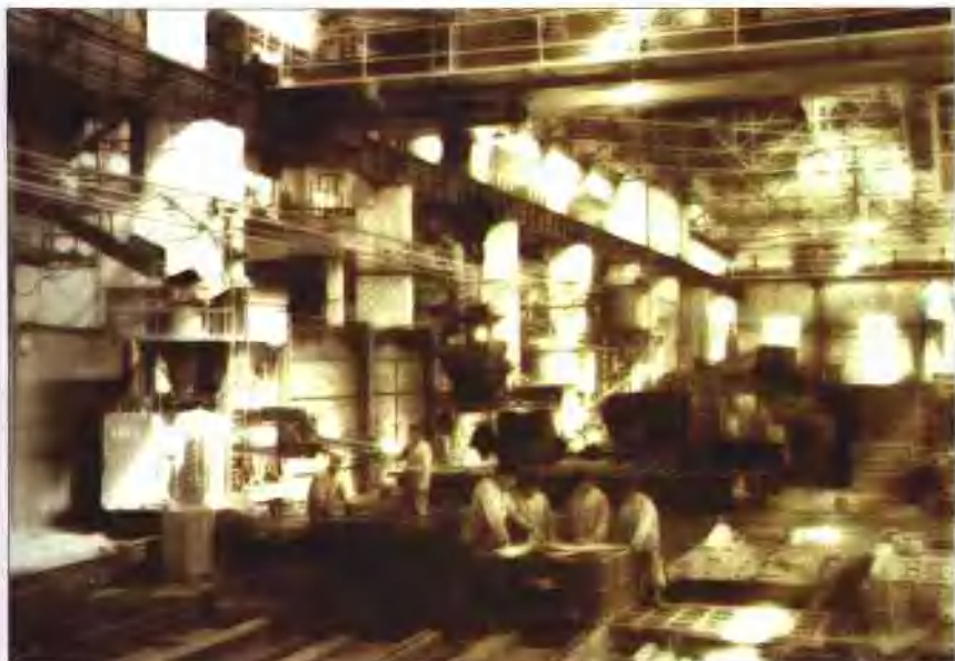
沈阳第一机床厂铸第一枚国徽的车间内景