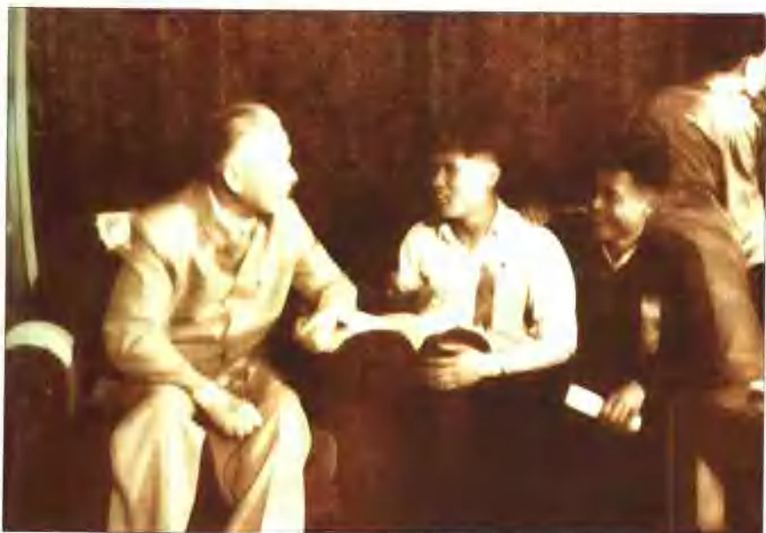
1964年6月11日刘少奇接见劳动模范吴大有