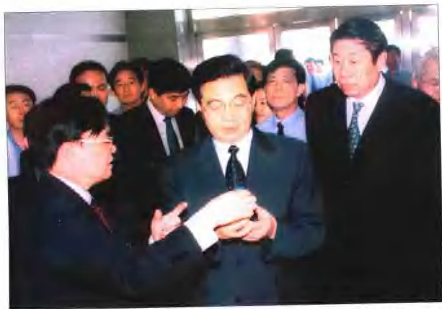
2002年6月16日胡锦涛同志视察东药集团