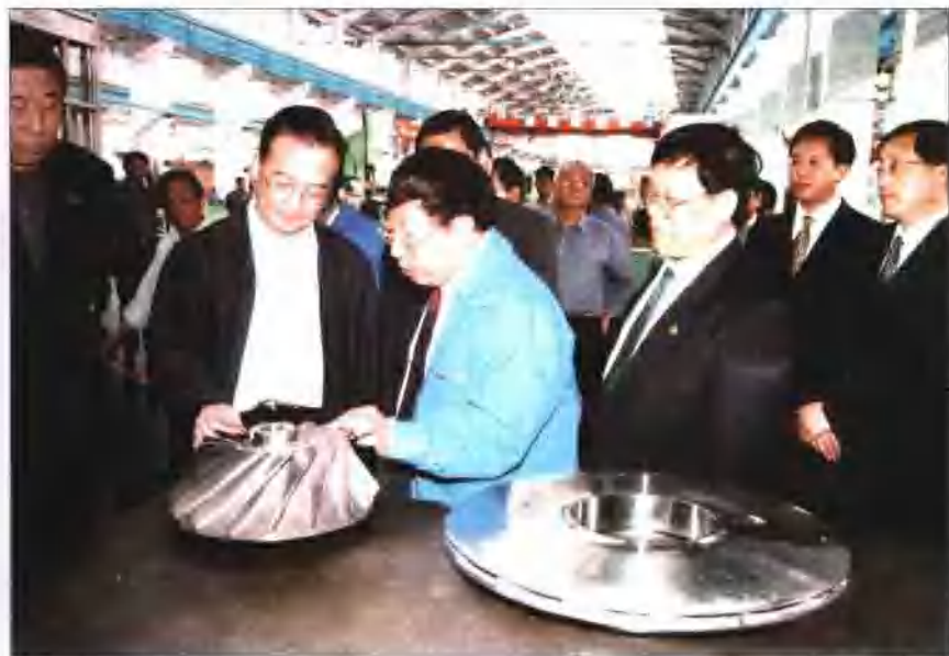
2003年6月2日温家宝视察沈阳鼓风机厂