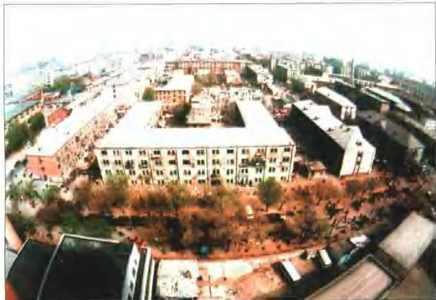
即将全面改造的铁西工人村