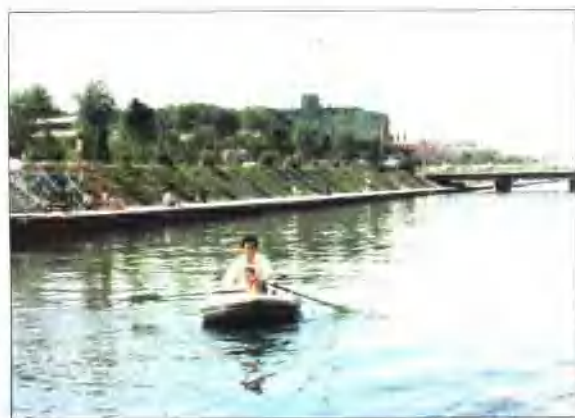
卫工明渠今昔对比