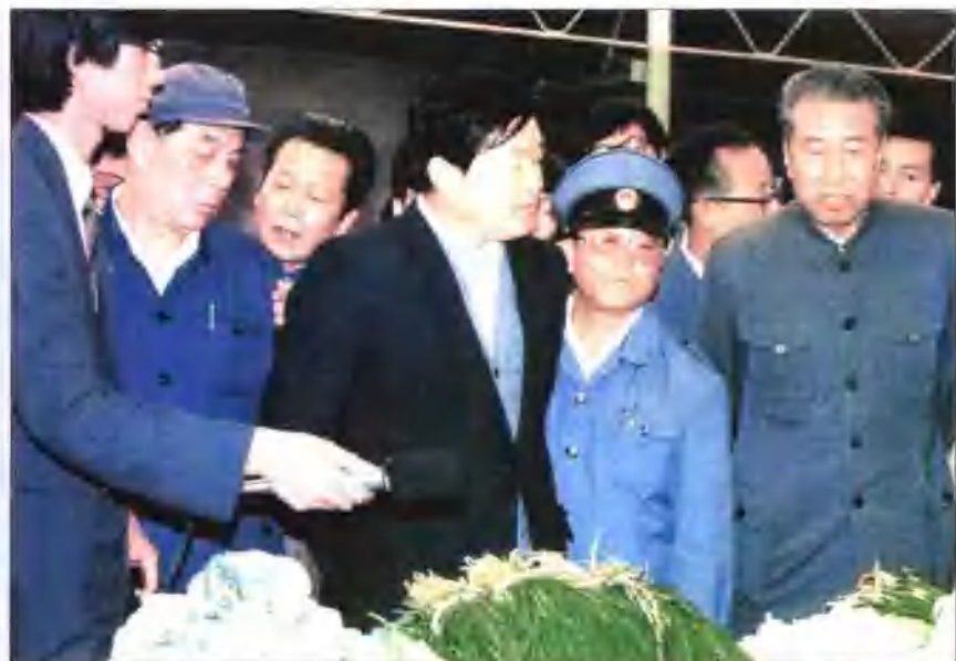
1987年李长春视察九路市场