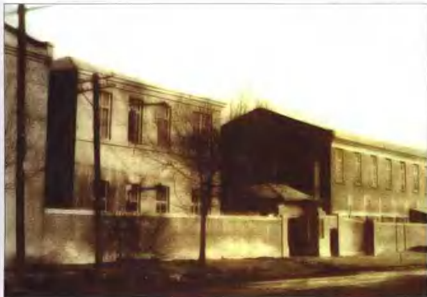
1945年时的沈阳自行车厂现沈阳鼓风机厂