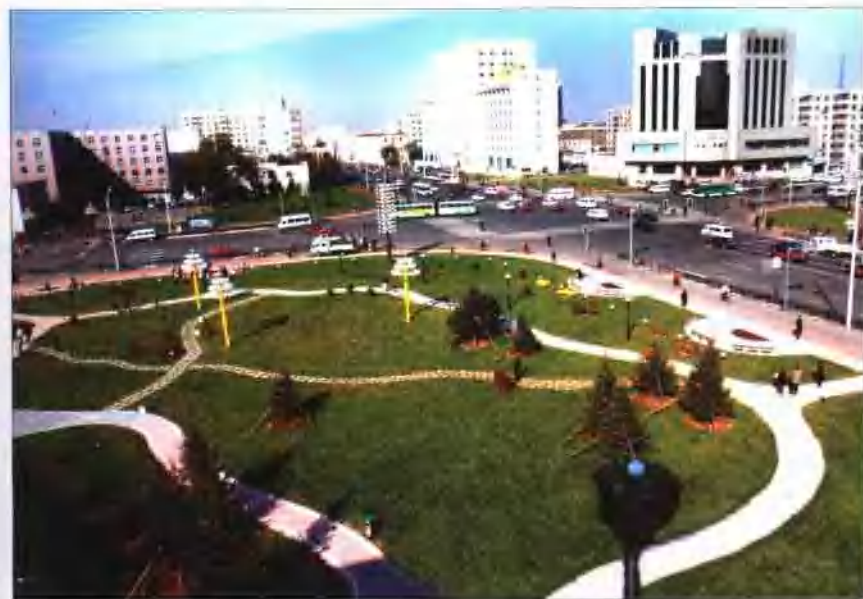
改造后的铁西广场