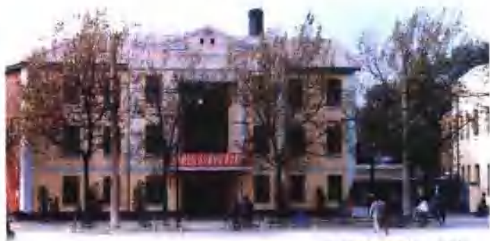
昔日区政府办公楼