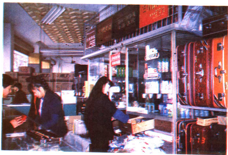
榕樹百貨大樓日用柜