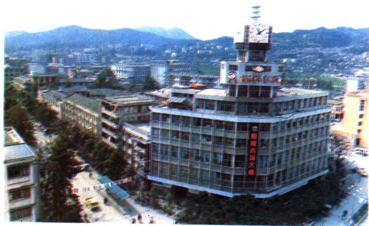
永安市榕樹百貨大樓