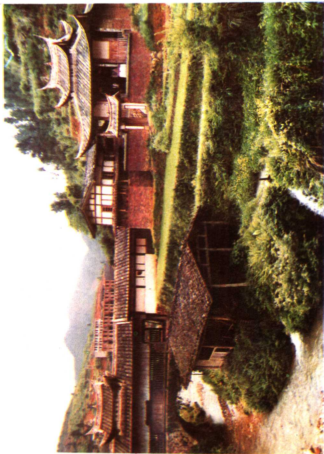
永安青水畲乡古戏台