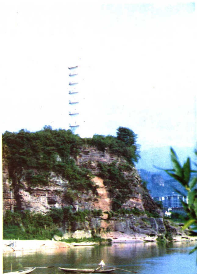
永安北塔