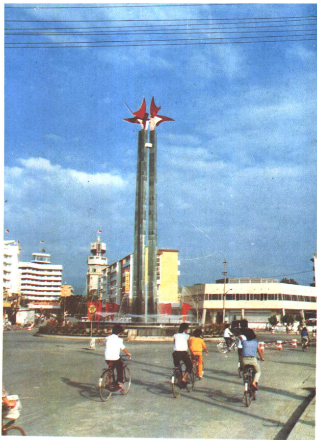
永安市标