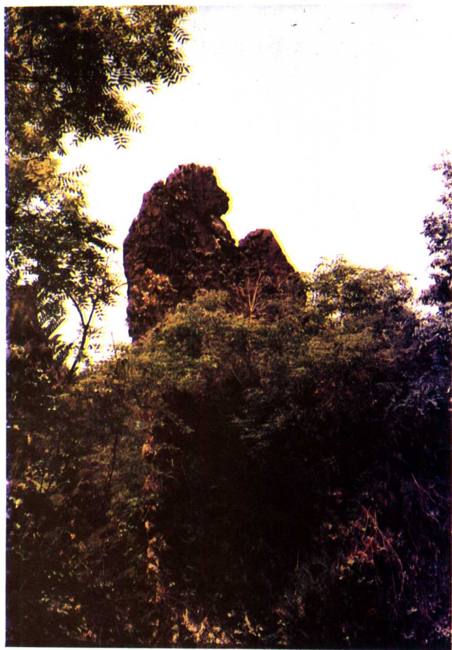
永安石林美猴抱桃