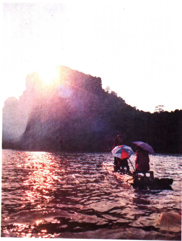
永安龟山夕照