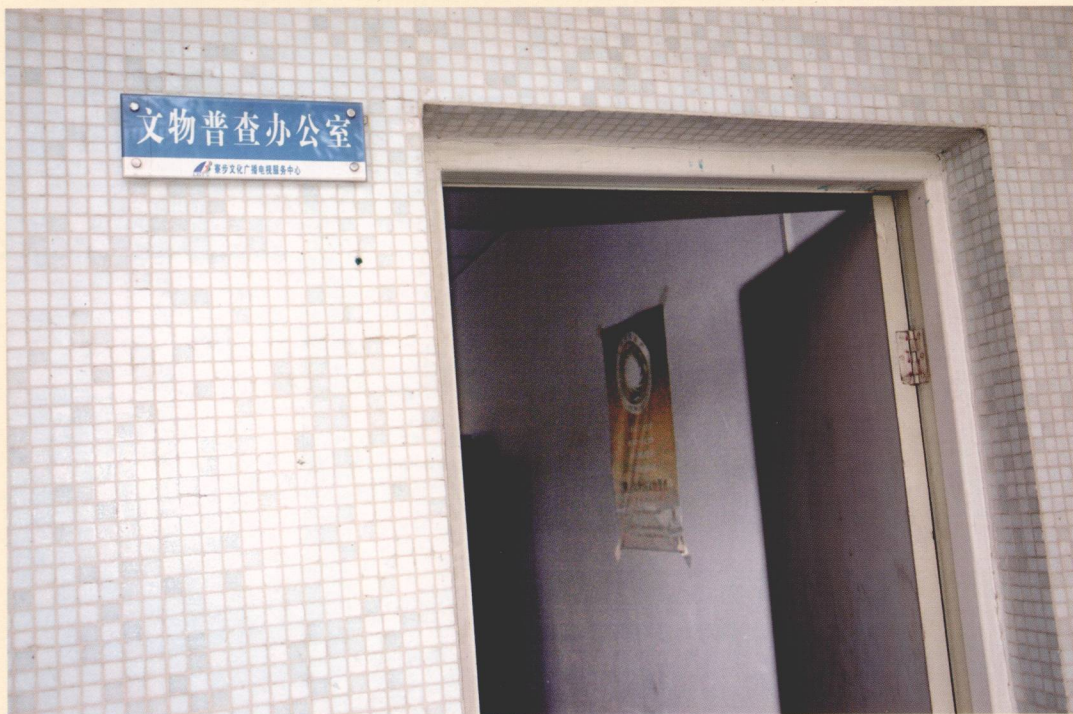
2007年12月25日，寮步镇第三次全国文物普查办公室在文化广播电视服务中心成立。

根据国家和省关于开展第三次全国文物普查工作的相关要求，2007年12月24日，寮步镇第三次全国文物普查领导小组成立，领导小组办公室设在镇文广中心，负责全镇文物普查工作的组织实施。全镇30个村（街）相继成立了文物普查领导小组及其工作室，各小组成员相继成立了文物普查联络组。