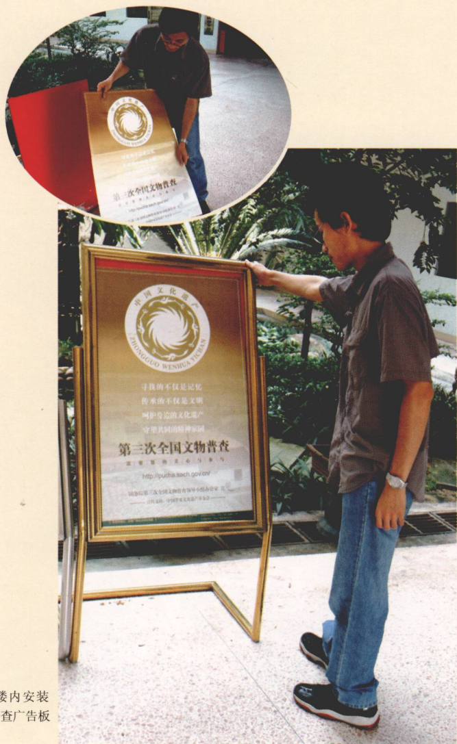
图文广中心大楼内安装 第三次全国文物普查广告板

2008年3月18日，寮步镇第三次全国文物普查动员大会召开，随后各村（街）也相继召开动员大会，部署普查工作。镇、村（社区）普查机构充分利用电视、广播、报刊等媒体以及通过张贴海报、悬挂横幅、派发宣传单、开通普查专栏网页等方式进行广泛宣传，为文物普查营造了浓郁的社会氛围。