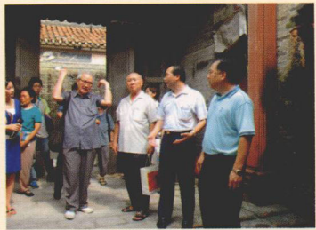
省文物专家莅临西溪指导工作