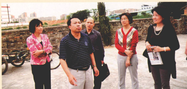
国家文物局文物处处长詹德华（右一）、省文化厅副巡视员苏桂芬（左一）、省文物局局长龙家有（中）、市文广新局副局长董红（左二）在镇文广中心主任杨林陪同下参观西溪古村。