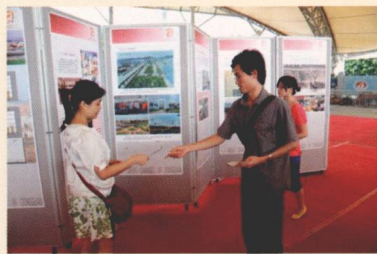
图 为镇图书馆展厅活动现场，派发宣传小册子