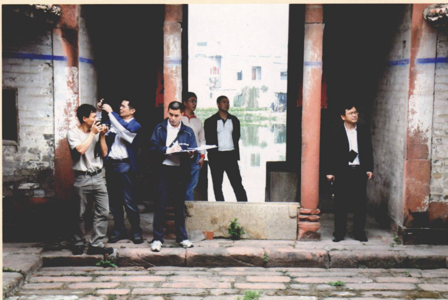
普查队深入西溪古村考察