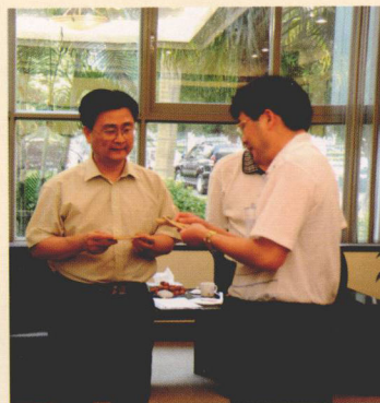
省文化厅厅长方建宏莅临寮步调研文物工作

寮步镇第三次全国文物普查工作得到了国家、省市领导、文物专家的高度重视和亲切关怀。领导亲临文物现场视察指导工作。