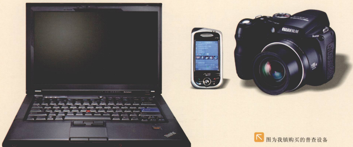
图为我镇购买的普查设备

第三次全国文物普查充分采用了信息网络、遥感、地理信息系统和全球卫星定位系统等现代科学技术手段。2007年，镇财政落实首批文物普查专项经费23万元，用于购买GPS全球卫星定位仪、红外测距仪、数码相机、摄像机、电脑等专业普查设备，先后购置了手提电脑2台，数码相机2台，GPS全球卫星定位仪1台及其他一批普查设备，使第三次全国文物普查工作的经费和设备问题得到了切实保证。