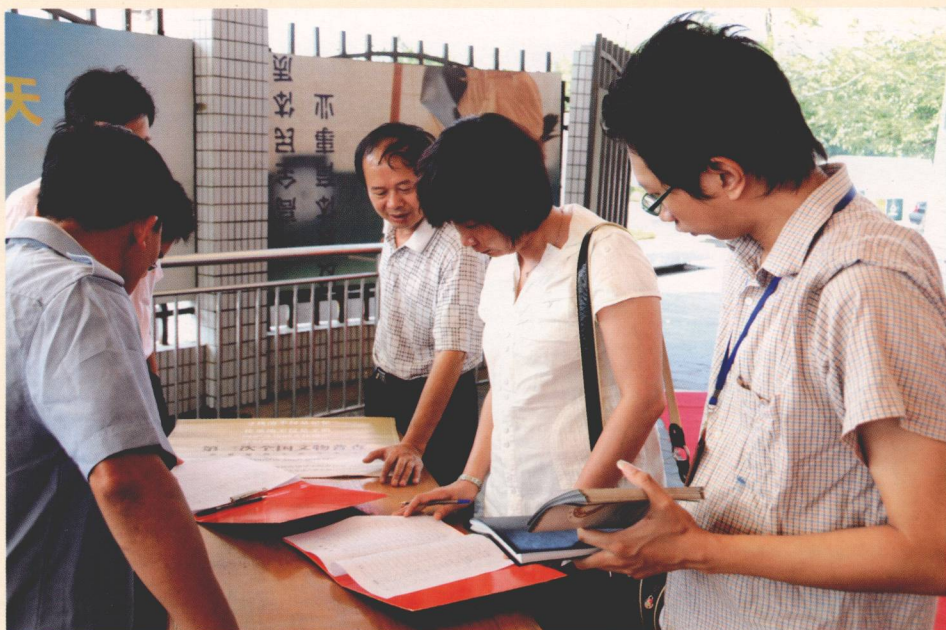
图 为镇图书馆展厅文物普查宣传活动签到现场