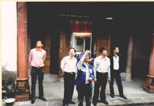
普查队深入西溪古村考察