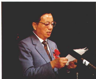
組委會名譽主任、天津市副市長錢耳嶺在開幕式上講話。