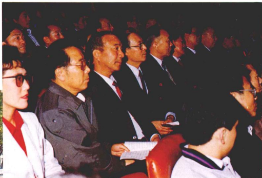
中共天津市委、市人大、市政府、市政協及主辦單位的有關領導參加了開幕式並觀看了演出。