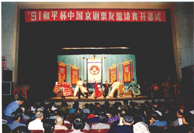
開幕式在天津市中國大戲院隆重舉行，天津市京劇界組織老、中、青、少、幼京劇演員五世同堂祝賀演出。