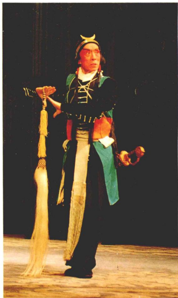
天津市著名京劇表演藝術家張世麟在《銀扣的》中飾武松。