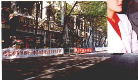
為祝賀盛會開幕，在天津各主要街道懸掛了大字標語。