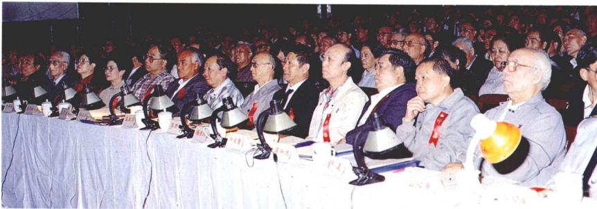
評委在複賽決賽中認真評判。