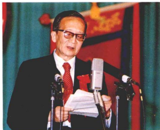
組委會主任中共天津市委宣傳部部長兼文化局長謝國祥講話。