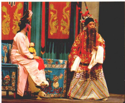
天津市京劇團著名演員楊乃彭和張學敏在演出《坐宮》片段。楊乃彭飾楊延輝，張學敏飾鐵鏡公主。