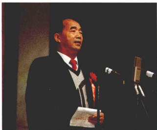
組委會名譽主任、文化部常務副部長高占祥熱烈祝賀盛會開幕。