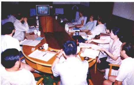
左列賽中 評委通過各 地區送來的參 賽節目錄像， 認真評選參加 複賽的演員。