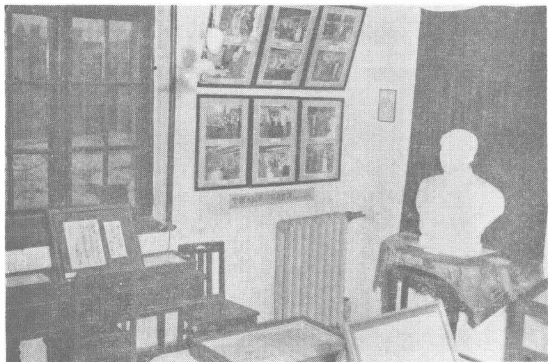
毛澤东同志在北京大学工作过的地方（現布置为“毛澤东紀念室”）