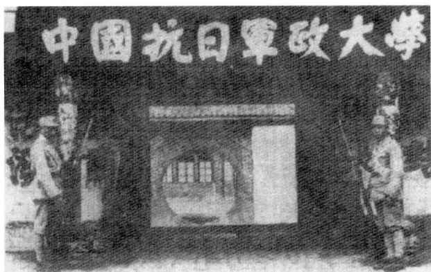
延安抗大总校校门