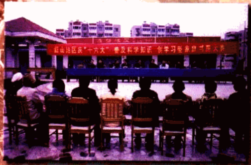
▲ 南京市首次“创学习型家庭书房”比赛