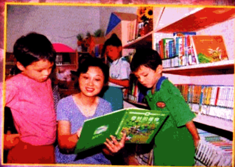
▲ 区少儿图书馆工作人员为国外小读者进行读书辅导