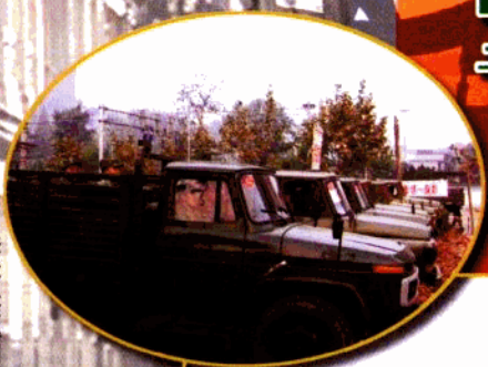
拆迁工作得到部队的关心和支持。