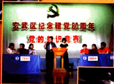
开展形式多样的活动纪念建党80周年