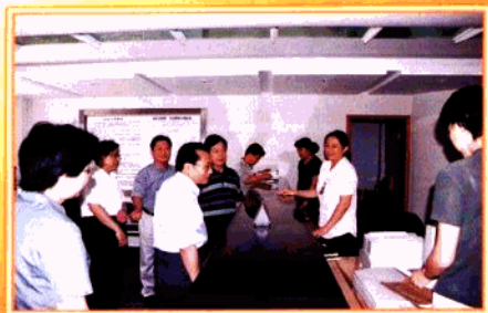
省委常委、省政法委书记孙文华在本院立案大厅看望干警

2001年1月，本院被最高法院授予“全国人民满意好法院”称号。一年来，区法院不满足于已取得的荣誉，认真查找工作中的薄弱环节，继续开展争创活动，进一步以“让人民满意”为动力和标准，以邓小平理论和江总书记“三个代表”为指针，紧抓“一个主题，二件大事”，以维护司法公正和提高司法效率为已任，各项工作取得新的发展，全年受理各类案件5444件，审结5201件，结案率为95.54%，为辖区社会稳定、经济发展作出新的贡献。继获得“全国人民满意好法院”称号后，本院先后被南京市委命名为“先进基层党组织”，被省高院荣记“集体一等奖”，被省委、省政府联合授予“文明单位”、省“纪检监察先进集体”等荣誉称号。