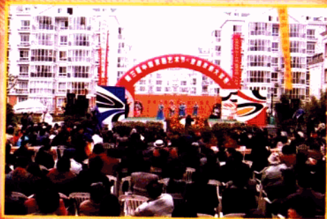
▲ 第三届中国京剧艺术节“家庭京剧大奖赛”暨第六届“玄武之春”开幕式

区少儿图书馆创办的“小蜜蜂”周末乐园常年开展形式多样的读书活动，拓展了全区中小学生的知识面，在素质教育方面发挥重要作用。多次荣获省级文明图书馆称号，1999年被评为“国家一级图书馆”。