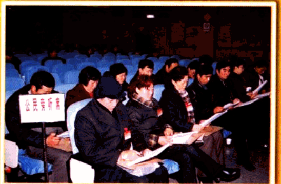
区十四届人大五次会议上,首次邀请公民到会旁听,并制定出台《公民旁听人代会暂行办法》进一步扩大公民有序的政治参与。