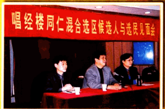
区人大通过区人大代表候选人与选民见面会等多种形式,让广大选民了解候选人,同时增强人大代表的责任感和使命感。