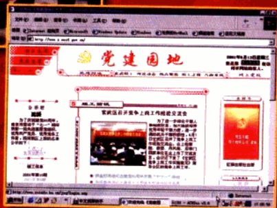
建成开通“党建园地”网站