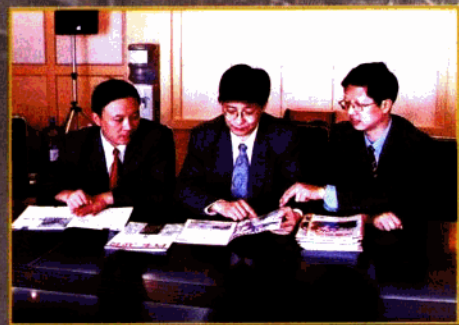
▲拆迁办领导班子在研究工作，筹划未来发展。