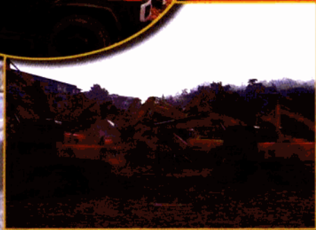
▲鼓楼—北极阁风貌区建设项目中，成功实施定向爆破，大型机械设备参加会战。