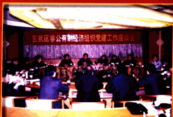
▲ 大力加强非公党建工作