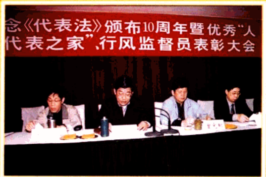
区人大在各街道设立“代表之家”,在有关执法部门派出行风监督员等形式,积极发挥代表的主体作用。