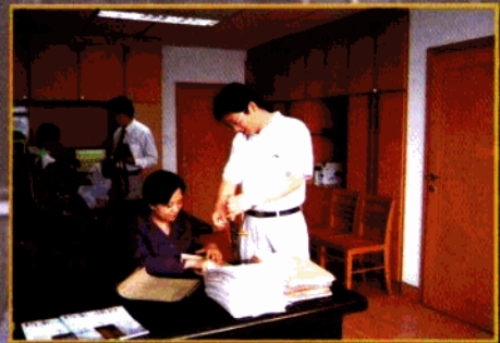
▲投资数万元建设全区一流档案室，抓好人员培训，及时进行资料收集归档。