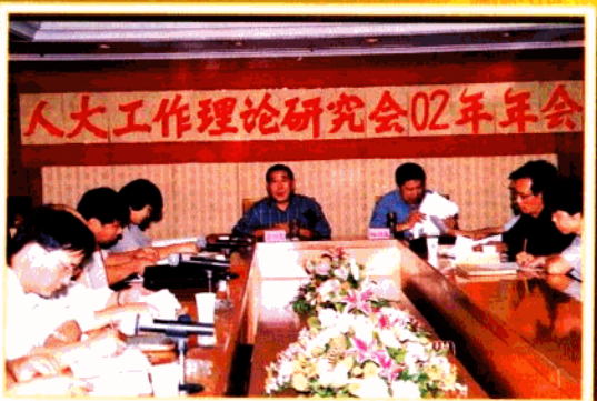
区人大理论工作研究会积极开展理论研究工作,为深化人大各项工作做了有益的探索,促进了三个文明的协调发展。