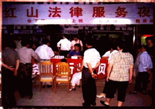
▲ “你下班，我上班，你困难，我服务”