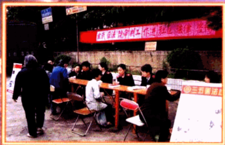
法院部分干警在后宰门社区开展社区法律咨询活动