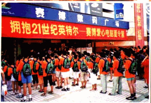
拥抱21世纪英特尔—赛博爱心电脑夏令营