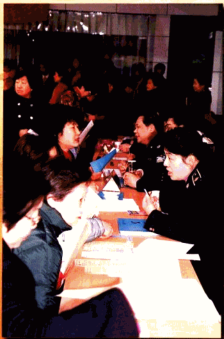
▲ 积极开展法律宣传咨询

区司法局在区委、区政府和市司法局的领导下，以邓小平理论和“三个代表”重要思想为指导，以“建一流班子、带一流队伍、创一流业绩”为主线，紧紧围绕政府中心工作，发挥司法行政职能作用，以创建“五好班子”、创建“学习型队伍”和“争创人民满意政法单位、争创人民满意政法干警”为契机，全面加强党组织的思想、组织和作风建设，党组织的战斗堡垒作用和党员的模范带头作用在区街两个文明建设中得到充分的发挥，有力促进了司法行政各项工作的开展。2001年玄武区被中共中央宣传部、国家司法部授予全国法制宣传教育先进区、区司法局荣获国家人事部、司法部“全国司法行政系统先进集体”；局党总支连续三次被区机关党工委评为优秀基层党组织。