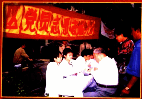
▲ 扎实抓好社区党建工作