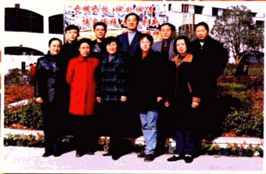
玄武区科技局全体成员