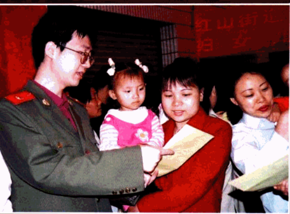
青年文明号在红山街道成立流动人口妇女儿童维权站揭牌仪式