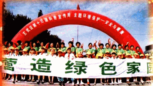
玄武区第十三届科普宣传团

玄武区科技局、科协坚持“科技是第一生产力”的指导思想，努力实践江总书记“三个代表”的重要精神，深入实施“科教兴区”战略。以珠路科技园区为龙头，大力发展科技信息业；以“数字玄武”建设为平台，加快打造信息化城区；以科普工作为抓手，提高地区公民科学素养。用科技进步推动区域经济和社会事业协调发展，为全区两个文明建设做出贡献。2000年玄武区被评为“全国科普文明示范城区”，连续8年被评为建设新南京有功(先进)区。