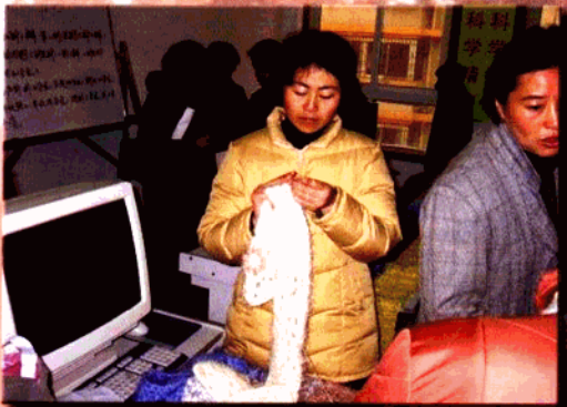
▲ 红山巾帼编织社，下岗女工学手艺