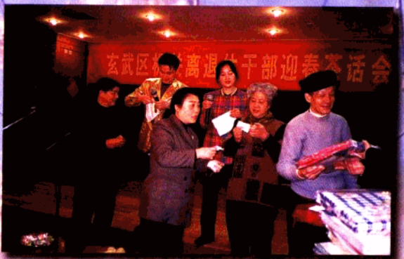
▲ 区人事局举办离退休干部迎春茶话会