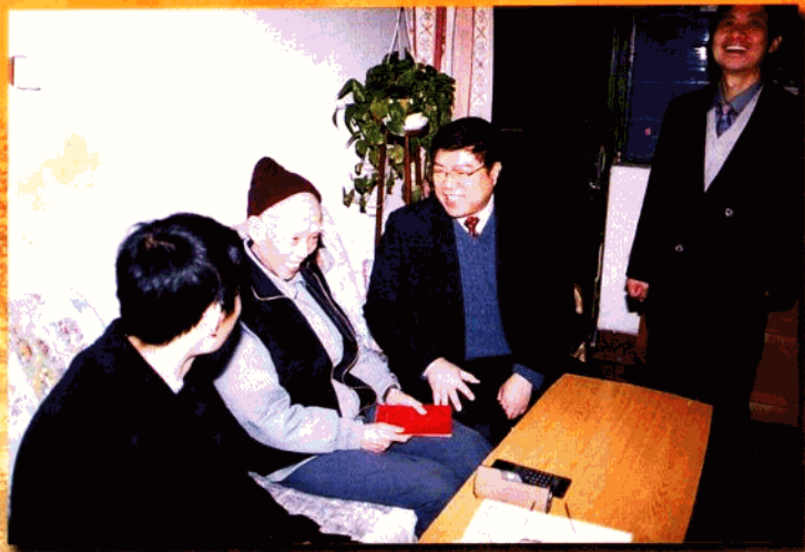
▲ 局领导为“两院院士”送上法律服务联系卡。

区司法局在区委、区政府和市司法局的领导下，以邓小平理论和“三个代表”重要思想为指导，以“建一流班子、带一流队伍、创一流业绩”为主线，紧紧围绕政府中心工作，发挥司法行政职能作用，以创建“五好班子”、创建“学习型队伍”和“争创人民满意政法单位、争创人民满意政法干警”为契机，全面加强党组织的思想、组织和作风建设，党组织的战斗堡垒作用和党员的模范带头作用在区街两个文明建设中得到充分的发挥，有力促进了司法行政各项工作的开展。2001年玄武区被中共中央宣传部、国家司法部授予全国法制宣传教育先进区、区司法局荣获国家人事部、司法部“全国司法行政系统先进集体”；局党总支连续三次被区机关党工委评为优秀基层党组织。