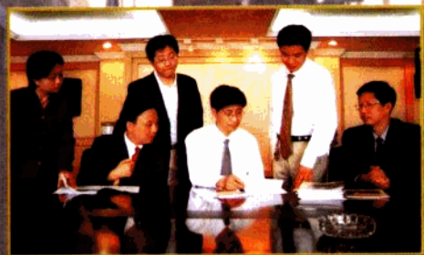
▲拆迁办领导和有关人员共同研究工作计划，制定工作方案，推进工作不断向前发展。

在不断发展的同时，自身实力也得到加强，位于珠江路48号9楼办公室宽敞、现代、气派，有固定资产数百万元。在完成好主业的的同时，积极涉足多元经济发展，以期待更快更高的腾飞。