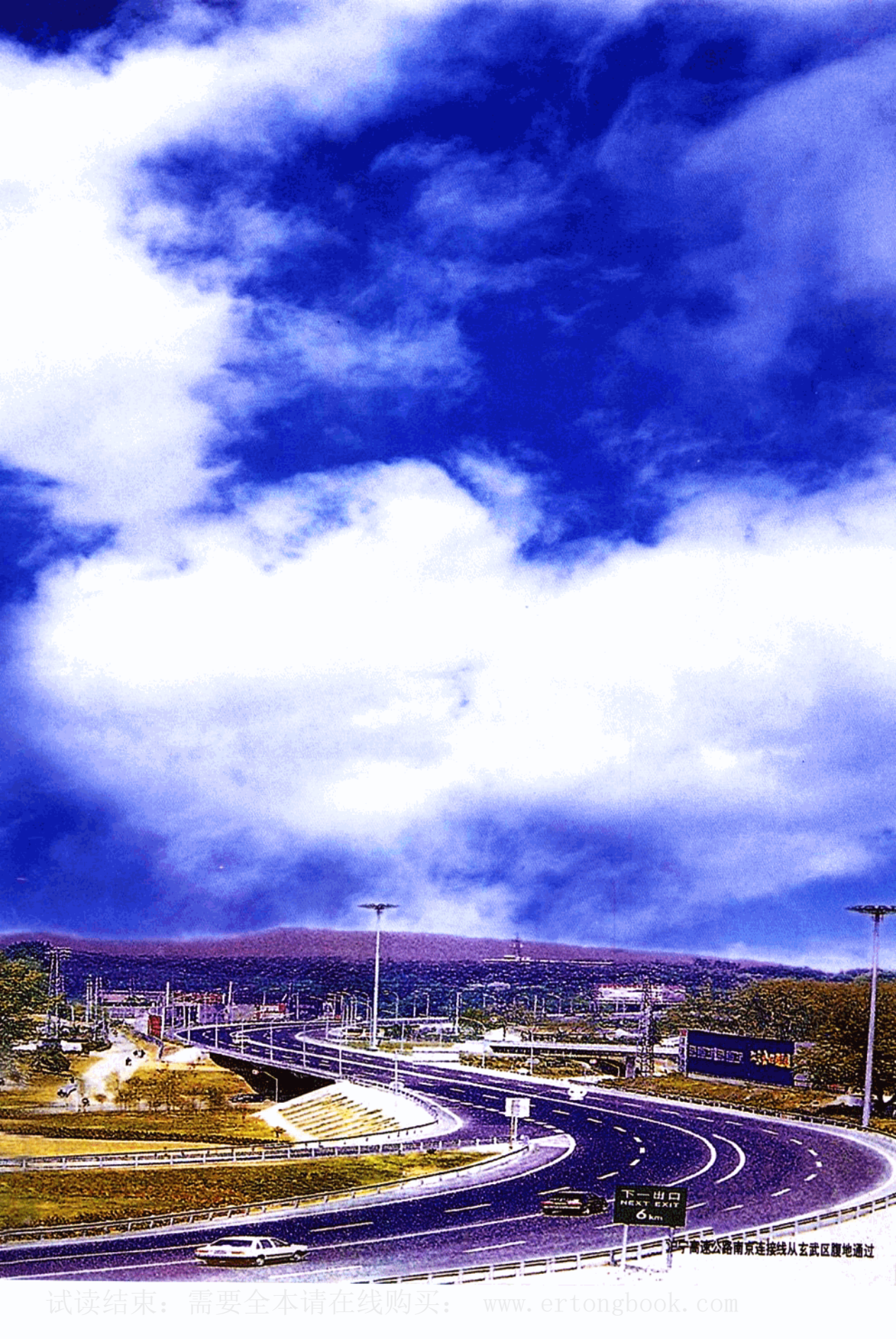
沪宁高速公路南京连接线从玄武区腹地通过