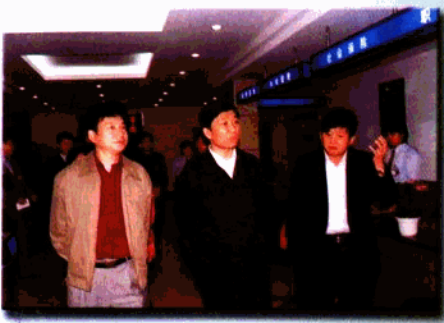
▲ 2001年10月21日省委副书记、南京市委书记李源潮, 市委常委、副市长李福全, 在区委书记曾宪翔陪同下视察锁金村街道。

锁金村街道地处玄武湖畔, 紫金山麓, 面积6平方公里, 人口4.6万。2001年, 街道制定“五心五以”的工作思路, 即围绕中心, 以税源为命脉, 街道整体实力不断壮大; 贴近民心, 以服务为主线, 社区创建工作前景广阔; 凝聚人心, 以党建为总揽, 自身综合素质显著提升; 鼓足信心, 以目标为动力, 全面完成区委、区政府下达的任务。在工作实践中, 坚持紧扣税源, 不断发展经济工作; 突出特色, 不断深化社区工作; 针对重点, 不断抓好城管工作; 围绕大局, 不断强化稳定工作; 注重创新, 不断加强党建工作。各项工作成效显著。