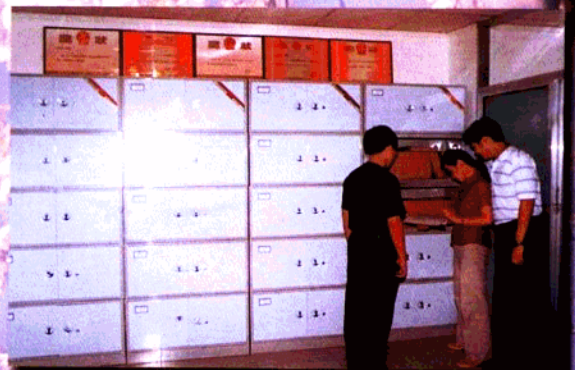
▲ 玄武区人事局进一步拓宽人事代理范围，工作人员正在查询代理人员资料