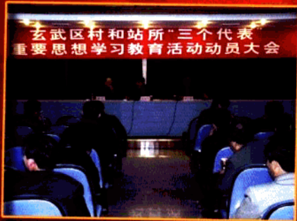
开展村和站所“三个代表”学教活动