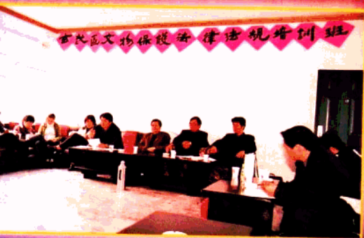
▲ 文物保护法律法规培训