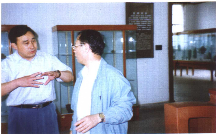
▲ 1997年6月，全国工商联副主席胡德平（右）在市政协副主席、市委统战部部长钮颂坚陪同下视察宜兴陶瓷博物馆