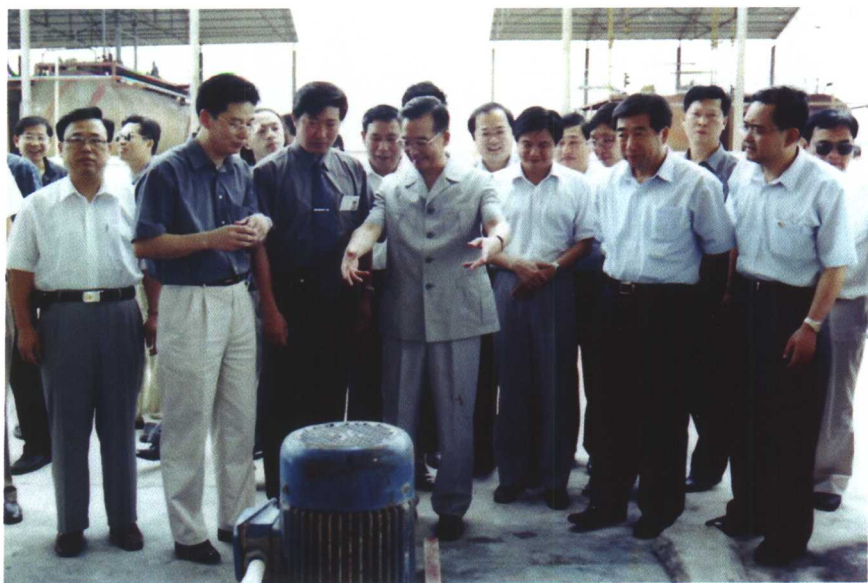
▲ 2001年9月3日，国务院副总理温家宝（前排右四）、省委书记回良玉（前排右二）等领导视察江苏银燕化工股份有限公司