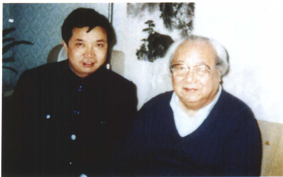
▲ 1989年11月，全国政协副主席费孝通（右）与市工商联副主委史俊棠合影