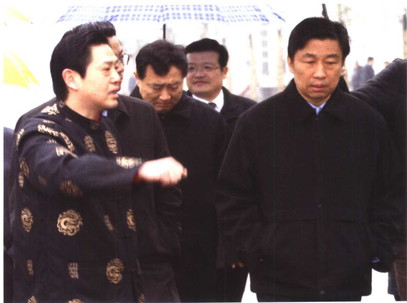
▲ 2006年2月，省委书记李源潮（右一）视察江苏华亚化纤有限公司