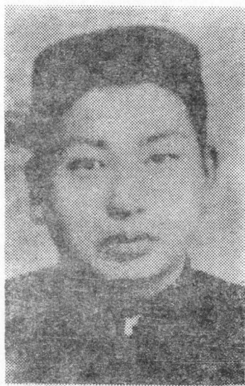
解 学 海