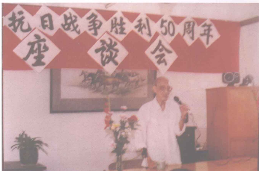
(摄于1995年9月8日广东省文史研究馆)