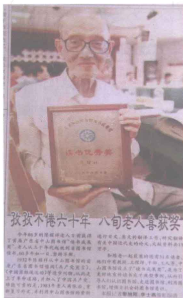
(摄于2000年6月2日,《人民日报》记者黎旭阳、李士燕摄影报道)