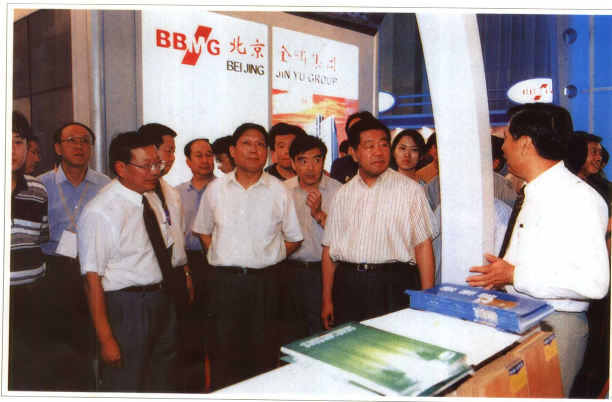
2001年8月 中共中央政治局委员、北京市市委书记贾庆林，市长刘淇到北京工业产品展示会金隅集团展厅参观。