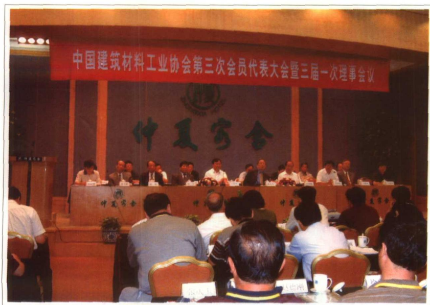
2002年9月 中国建筑材料工业协会第三次会员代表大会在大连召开。