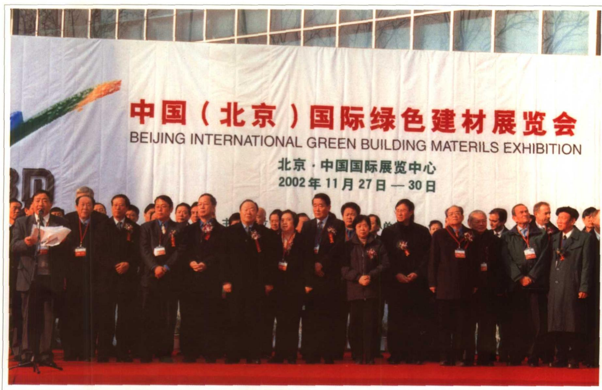
2002年11月 全国政协副主席万国权、国家经贸委副主任欧新黔及中国建筑材料工业协会会长张人为等出席中国（北京）国际绿色建材展览会开幕式。