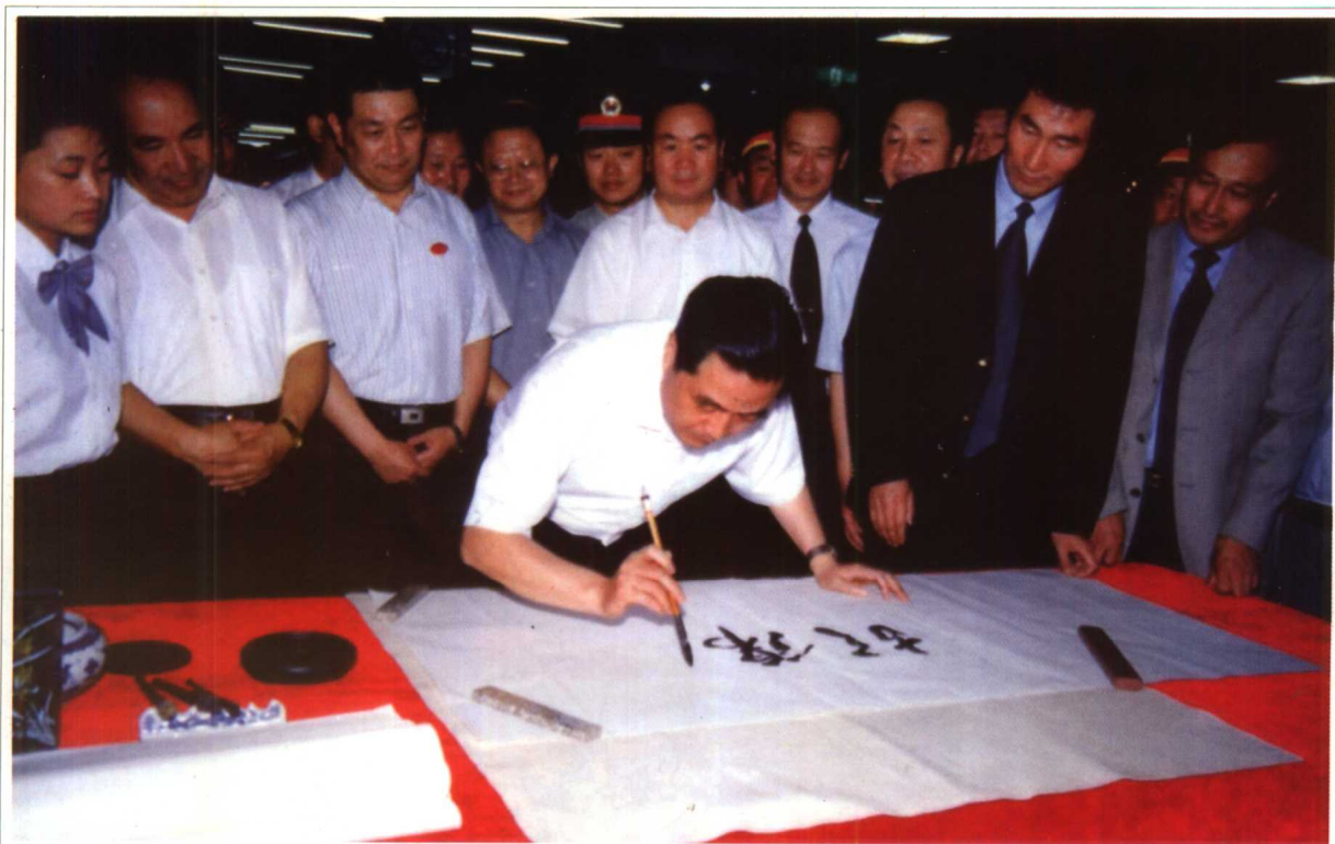
2001年6月12日 中共中央政治局常委、国家副主席胡锦涛在新疆华凌工贸集团建材市场参观时签名留念。