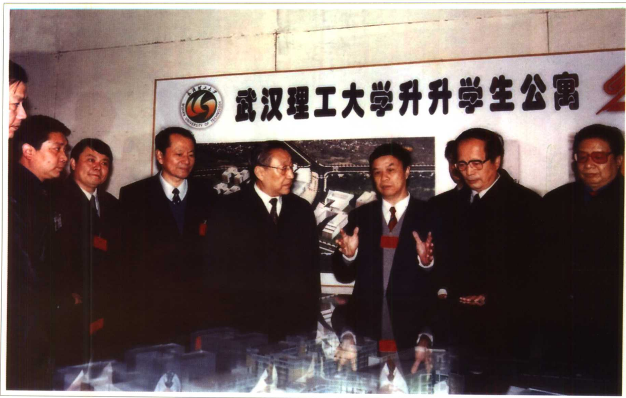
2001年元月 中共中央政治局常委、国务院副总理李岚清到武汉理工大学学生公寓建筑工地参观考察。