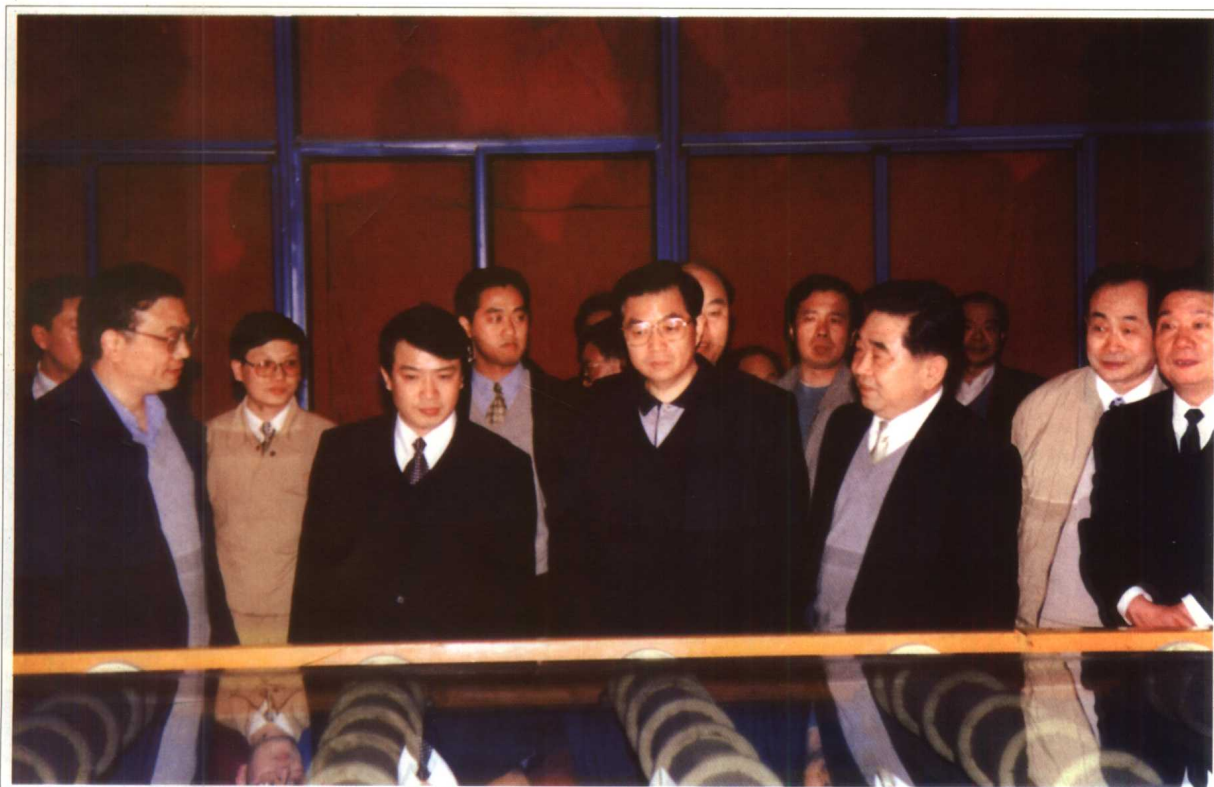
1999年3月27日 中共中央政治局常委、国家副主席胡锦涛在中共河南省委书记马忠臣、省长李志强、中共洛阳市委书记李柏拴、市长刘典立等陪同下到中国洛阳浮法玻璃集团有限责任公司考察工作。