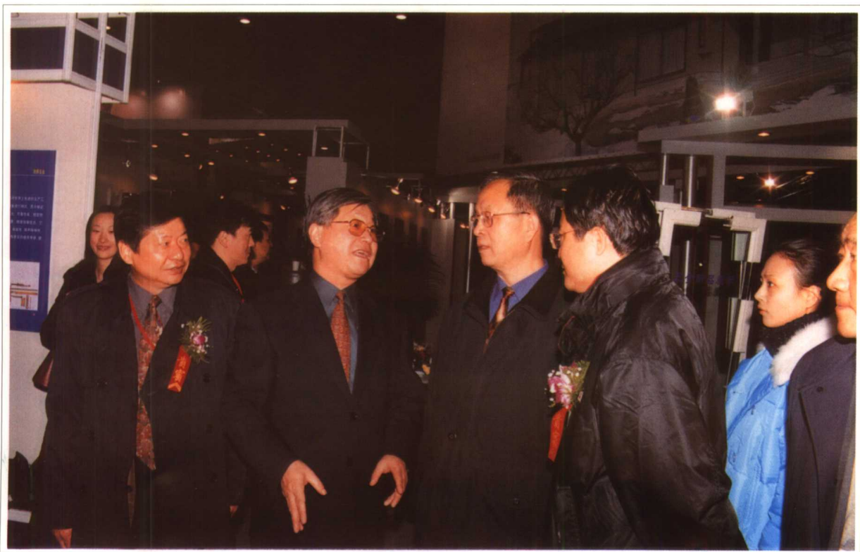
2002年11月 建设部部长汪光焘参观中国（北京）国际绿色建材展览会。