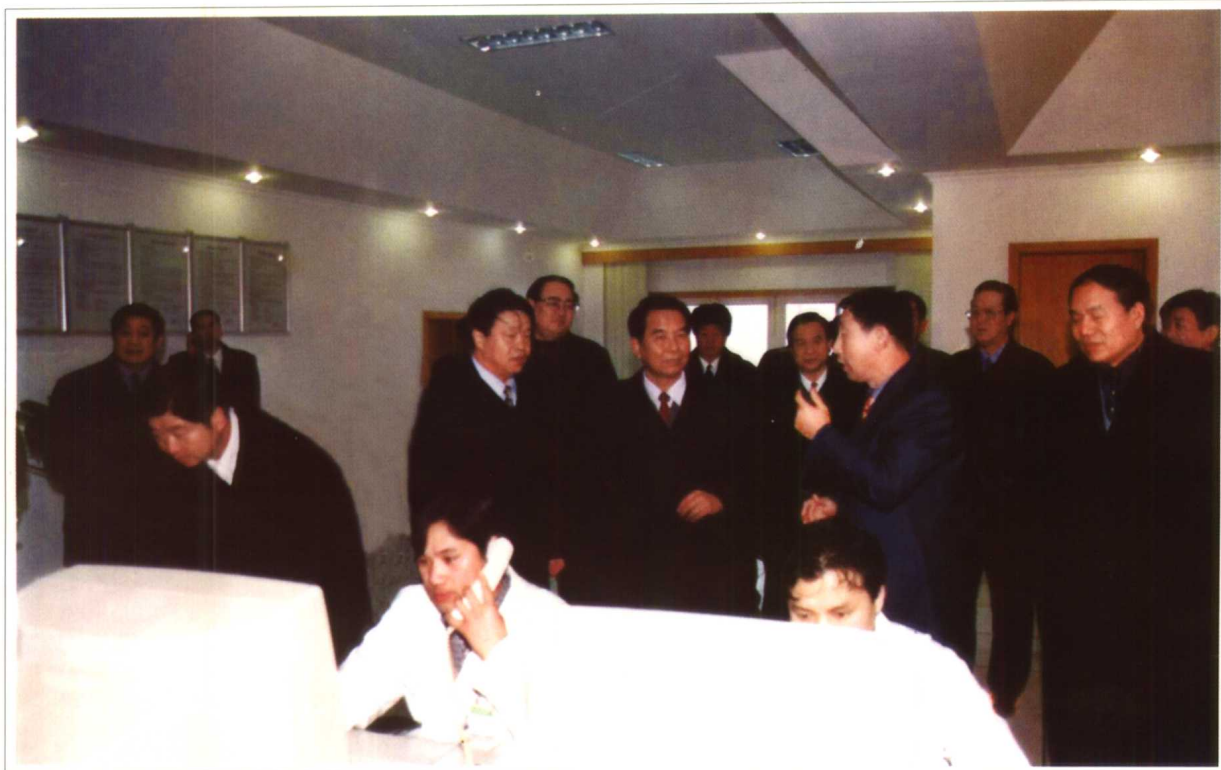
2001年农历大年初一 中共中央政治局委员、山东省省委书记吴官正到济南山水集团慰问坚持生产的干部职工。