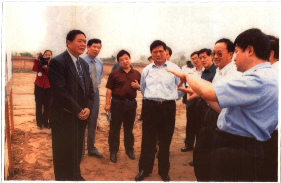
2002年6月 北京市市长刘淇、副市长刘敬民视察将要兴建的北京金隅集团朝阳新城。