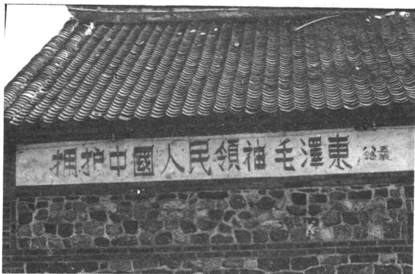
▲抗大学员在栖霞东乔写的宣传标语