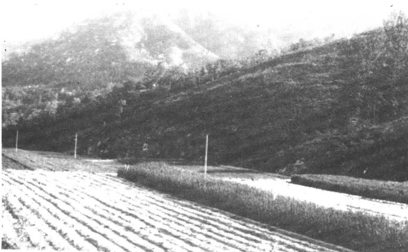
▲大泽山区铁夯寺战斗处