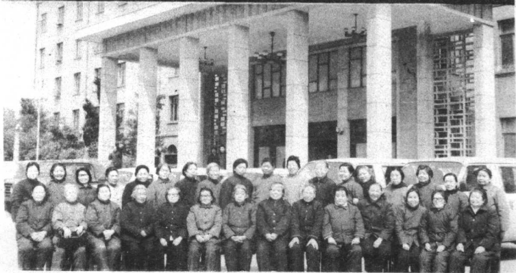
原新四军第五师在汉的部分女同志合影 84.3.23