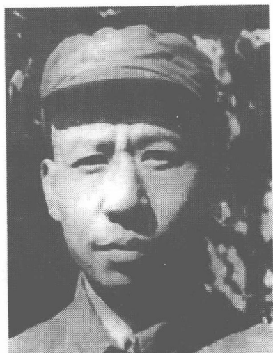
新四军政治委员刘少奇