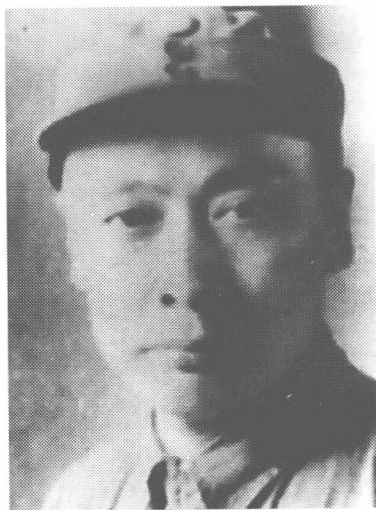
新四军代军长、军长陈毅