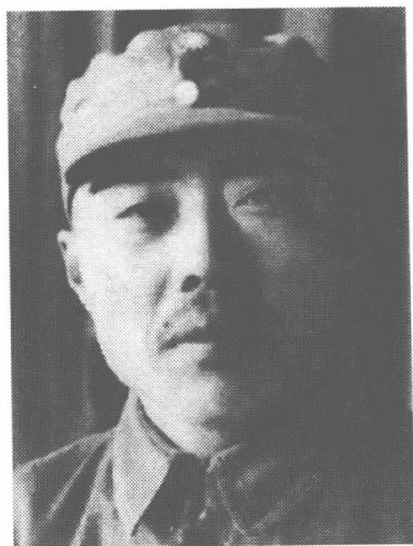
新四军副军长项英