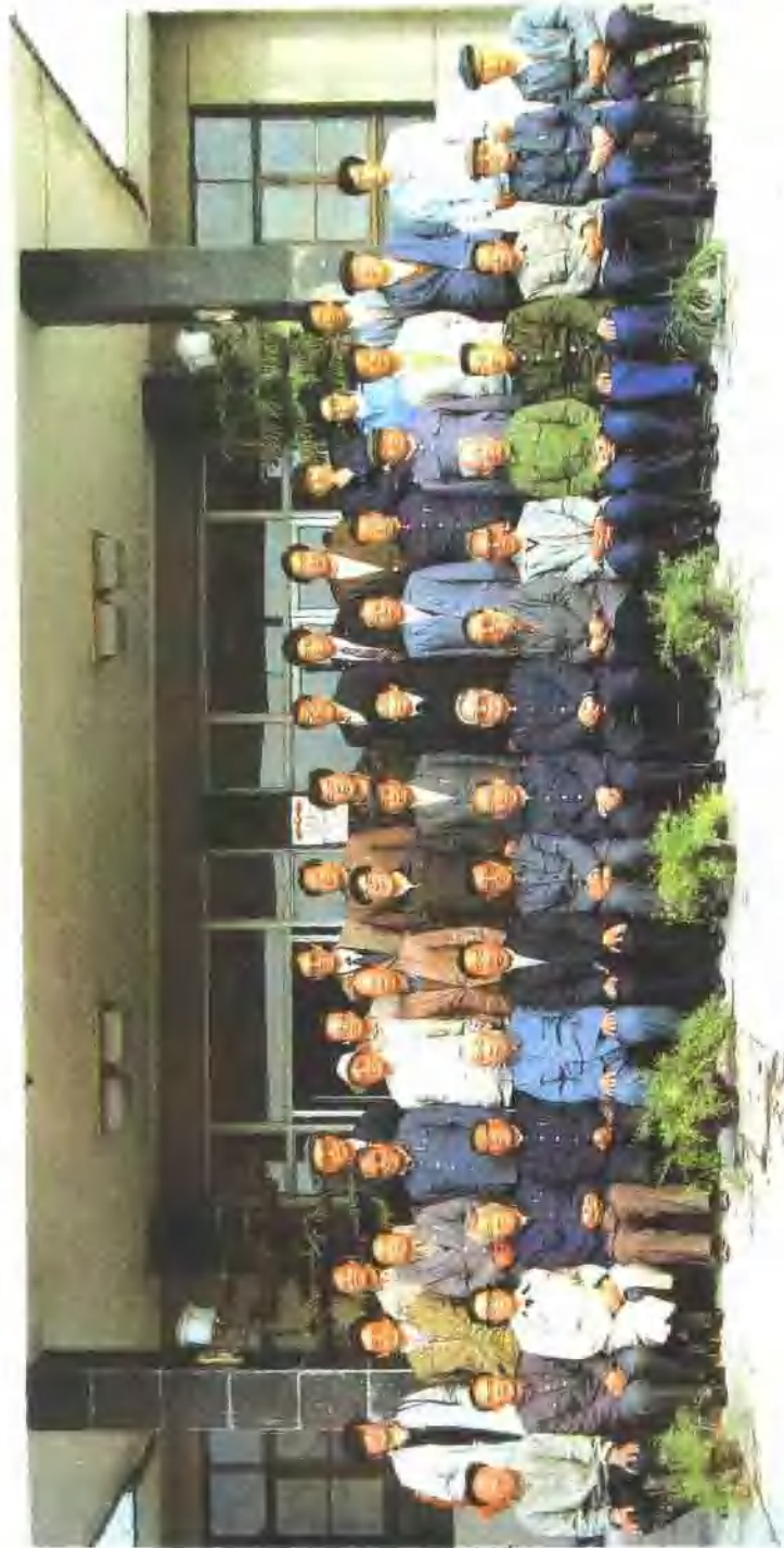
中共唐山市委领导与纪念唐山市文联成立四十周年座谈会历届文联在唐常委合影