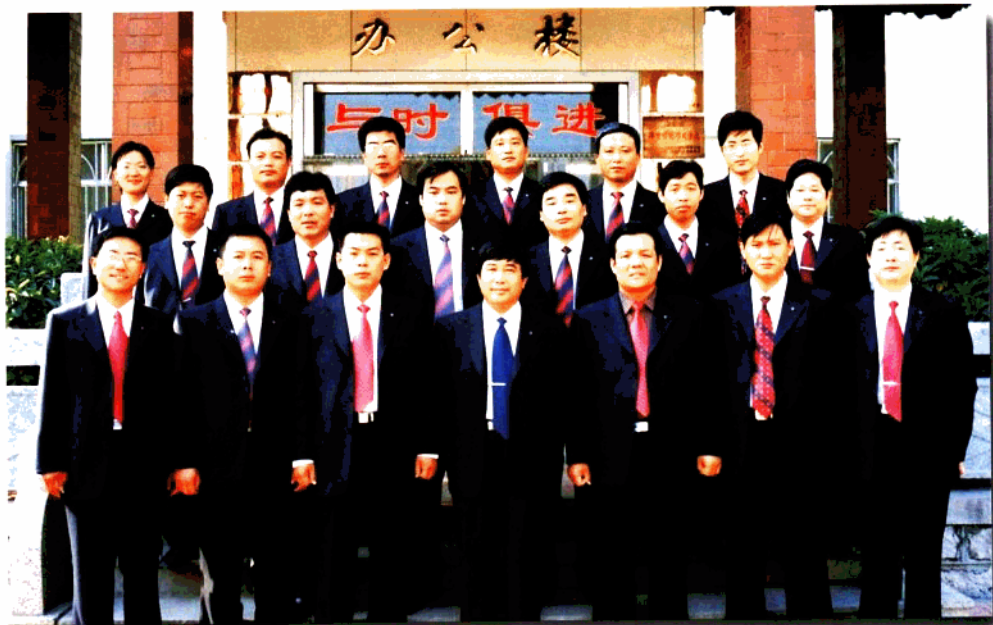
中层以上领导合影