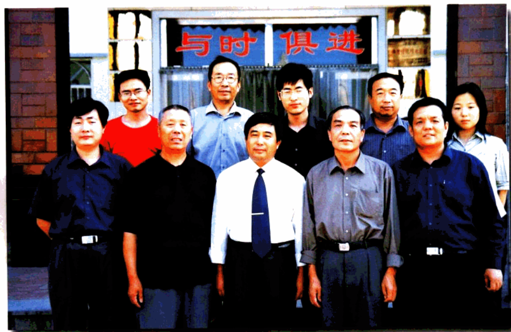
90周年校庆办公室人员合影