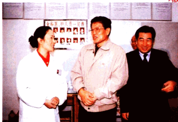
2001年10月13日社科院院长李铁映视察锁金社区卫生服务工作。