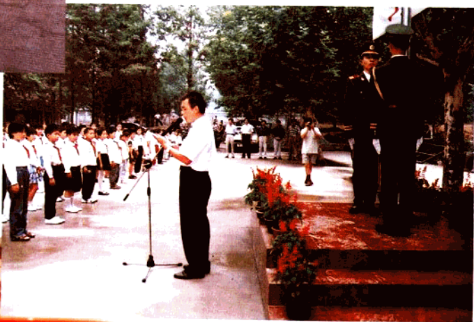
学校举行升旗仪式