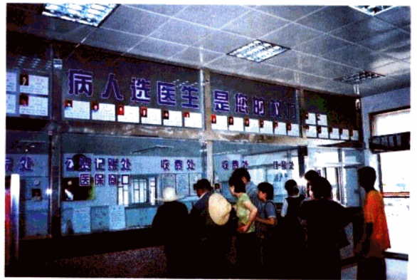
病人排队就诊,同时认真选择医生。