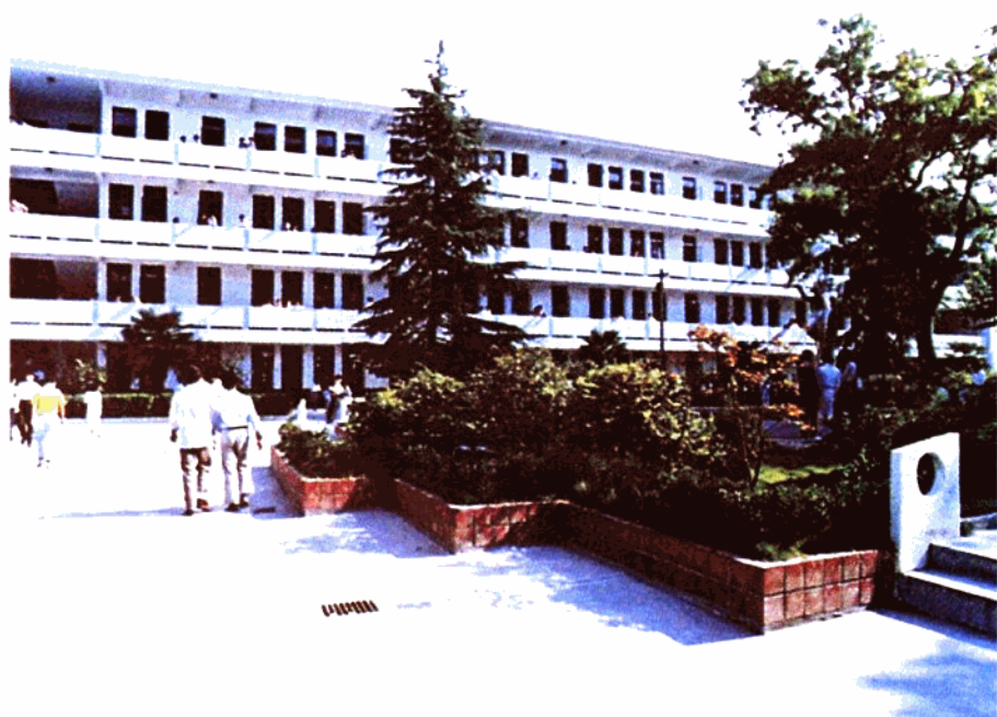
高大宏伟的教学楼(震旦楼)

南京市第九中学(东南大学附属中学)座落在六朝古都的中心——玄武区大行宫碑亭巷51号