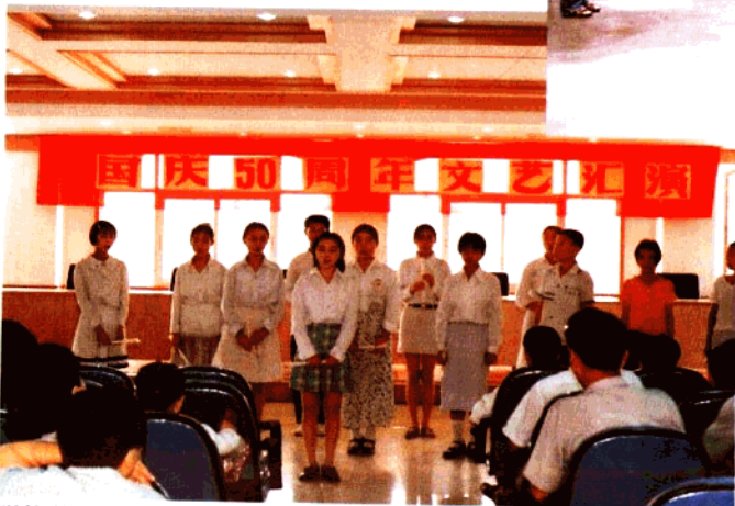
学校举行文艺汇演