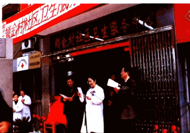
2001年4月13日，锁金医院成为全市首家由基层医院转换并正式挂牌成为“南京市玄武区锁金村社区卫生服务中心”，将作为玄武区锁金村、玄武湖、红山三个街道范围的社区卫生服务工作。