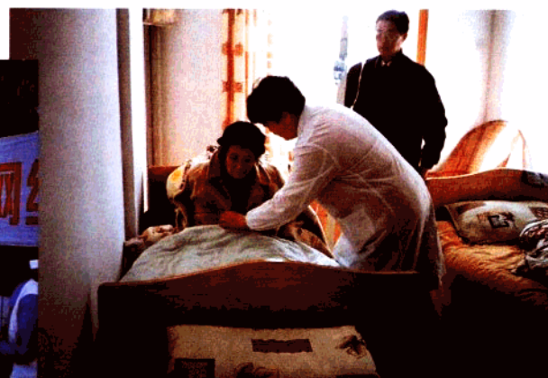
2000年9月19日锁金医院成功兼并原南京电影机械厂职工医院，根据社区居民需求创建了南京玄武锁金护理院，图为医务人员为护理院入住老人提供服务。