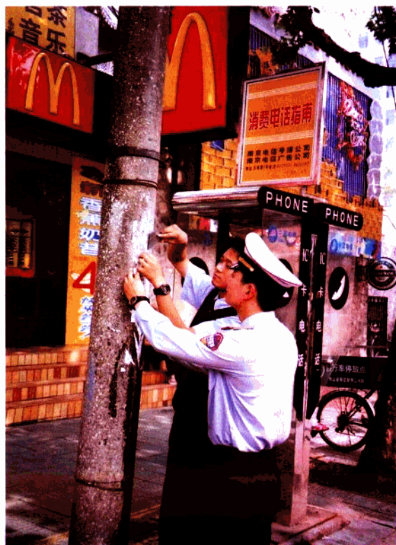
市容队员在清理城市“牛皮癣”