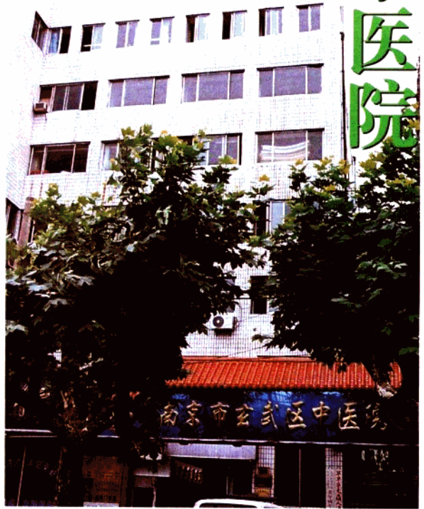
玄武区中医院外貌

玄武区中医院始建于1953年,地处珠江路318号,是“全国中医医疗质量监测网点建设单位”,和南京市中医重点专科建设单位。其特色专科中医外科经过几十年的发展,已初具规模,拥有高、中、初、老、中、青的人才梯队,形成疮疡、腮腺炎、痛风、带状疱疹四个特色专科门诊。近年来还研制开发了以“益黄膏”为主的外用中药,并荣获南京市科技进步三等奖。医院长年有主任医师坐诊,其中高级职称医师占全院人数的50%以上。在倡导患者择医就诊的同时,还送医送药上门,以多种形式开展社区卫生服务,并组建了“玄武区中医集团”,方便病人,扩大了医院的诊治范围。多年来医院以医疗质量为生命线,以中医中药治疗为特色,开展24小时门急诊工作,年门急诊量超过10万人次。医院以低廉的价格,周到优质的服务在南京及周边地区得到广大患者的赞誉。