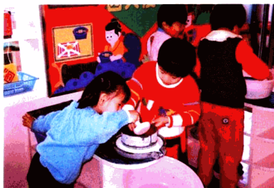
哇! 我们磨出豆浆啦!