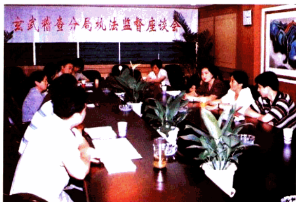
邀请外聘监察员召开执法监督座谈会,听取对税收工作的意见和建议