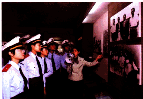
在梅园纪念馆接受爱国主义教育