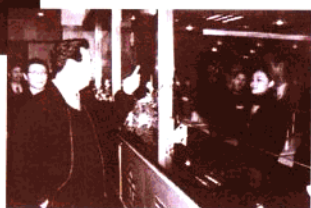
市长王宏民来我行视察

南京市商业银行是经中国人民银行批准设立的按照商业银行机制规范运作的股份制银行,是南京地区唯一具有独立法人资格的银行,在南京市有 60 家营业机构。我中山东路支行是其中之一。南京市商业银行与玄武区委、区政府有着传统、良好的合作关系。其共同发起创立的玄武区中小企业贷款担保基金和玄武区财政专户均设在本支行。我支行开办经人行批准的所有本、外币业务。我热忱欢迎四方宾客来玄武区投资办厂,我行将为您提供优良的金融服务。让我们为繁荣玄武经济,为您事业的不断成功共同携手努力!