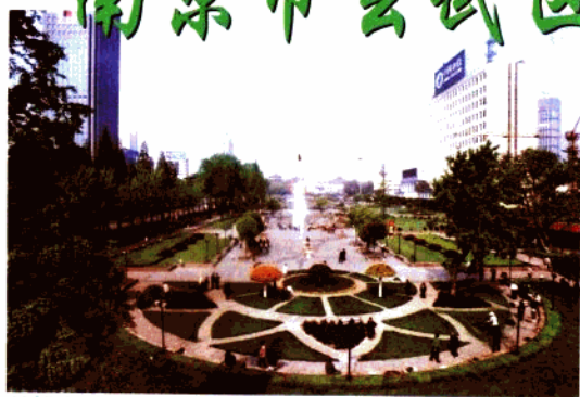
鼓楼市民广场全景图