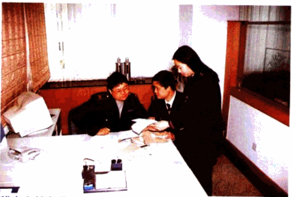
稽查人员在进行调帐检查

进税收收入大幅增长,全年稽查 988 户,结案税款 1572 万元,偷税处罚面 100%。规范稽查操作流程,强化稽查各环节量化指标考核,开展“最佳税务案件稽查报告评比”活动,促进稽查水平的提高。