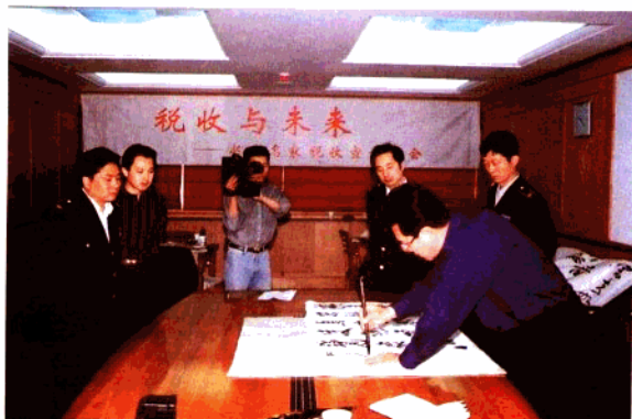
税收宣传月期间,邀请省书画名家来分局挥毫泼墨,表达对税收的理解与支持。