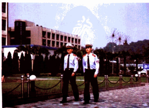
顶着烈日巡查,在鼓楼市民广场