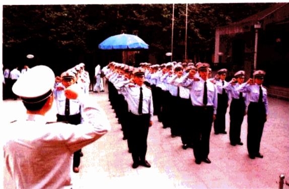
向周总理铜像庄严宣誓

党的十一届三中全会以来,玄武区逐步理顺市容管理体制,规范市容执法;市容管理监察队伍从无到有,发展壮大;长效管理措施不断摸索创新。全区市容管理工作围绕创建国家卫生城市的总体目标,从基础入手,从源头抓起,用改革的精神不断拓展市容长效管理的深度,全区区域发生了很大的改观。几年来,玄武区市容管理局强化市容卫生长效管理,先后组建了近二百人的市容管理队伍,制定了关于市容长效管理、市容监察队伍管理、市容协管员队伍建设、街道中队队员管理规定等一系列规章制度。实行依法管理,文明执法、公正执法。抓好“门前三包”、户外广告和占道摊点整治以及街景亮化和美化工作,抓好道路清扫保洁,实行生活垃圾、装潢垃圾、营业垃圾袋装、扎口和垃圾分类收集等,从源头上根治环境脏、乱、差,取得较为显著的成绩,在南京市1990年、1992年、1995年夺取全国“十佳卫生城市”“三连冠”中,成绩突出,被评为创建有功单位。1997年12月在全市率先建成“国家卫生城市达标区”。2000年市容局被评为玄武区2000年度“双十佳”单位。