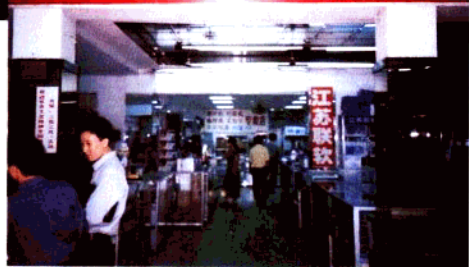
简结明亮,整齐有序,琳琅满目的商城大厅。