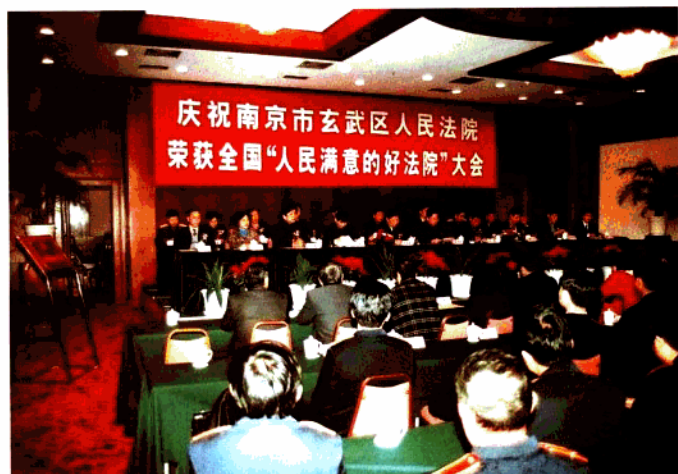
区委、区政府为玄武法院召开荣获全国“人民满意的好法院”庆功大会