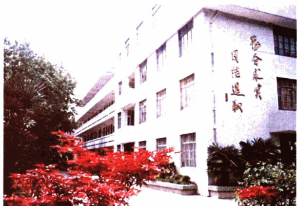
设施精良的科技楼

今天的九中，师资力量雄厚，学校有特级教师 3 人，享受政府津贴专家 1 人，高级教师 67 人，市、区优秀青年教师和学科带头人 22 人。校男子篮球 1997 年获亚洲中学生季军，1999 年获第七届全国中学生男子篮球冠军。