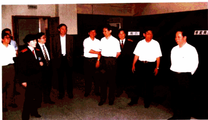
最高人民法院院长肖扬(右一)在省、市、区有关领导陪同下视察玄武法院

玄武法院在区委的正确领导下,在上级法院和区人大的指导、监督下,全院干警以邓小平同志建设有中国特色社会主义理论为指针,认真学习、贯彻江泽民同志“三个代表”的重要思想,努力提高政治、业务素质,充分发挥审判职能,积极维护社会稳定,为全区经济建设和社会发展保驾护航,作出了突出贡献。2000年,共审结各类案件4936件,结案率为97%。由于院党组的重视,在审判改革和队伍建设方面取得了丰硕成果,较好地解决了告状难、执行难问题,得到上级领导和广大群众的好评。为此,法院曾被三次荣记“集体二等功”,多次被评为省法院系统先进集体、文明单位、文明法院、人民满意法院。2001年1月被最高人民法院授予全国“人民满意的好法院”称号。