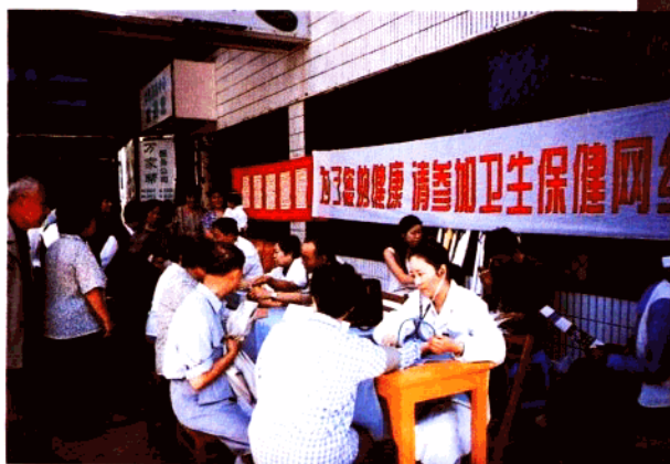
锁金医院多年来，紧紧围绕社区卫生服务做文章，经常深入社区为居民提供健康咨询服务，宣传加入社区卫生保健网。