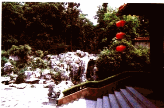
九华山乐游苑休闲中心