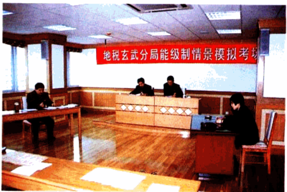
分局领导主持能级制测评