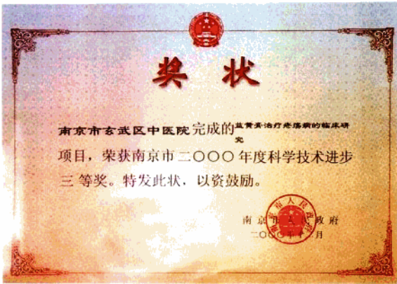
玄武区中医院研制的“益黄膏”获市二〇〇〇年科技进步三等奖

玄武区中医院始建于1953年,地处珠江路318号,是“全国中医医疗质量监测网点建设单位”,和南京市中医重点专科建设单位。其特色专科中医外科经过几十年的发展,已初具规模,拥有高、中、初、老、中、青的人才梯队,形成疮疡、腮腺炎、痛风、带状疱疹四个特色专科门诊。近年来还研制开发了以“益黄膏”为主的外用中药,并荣获南京市科技进步三等奖。医院长年有主任医师坐诊,其中高级职称医师占全院人数的50%以上。在倡导患者择医就诊的同时,还送医送药上门,以多种形式开展社区卫生服务,并组建了“玄武区中医集团”,方便病人,扩大了医院的诊治范围。多年来医院以医疗质量为生命线,以中医中药治疗为特色,开展24小时门急诊工作,年门急诊量超过10万人次。医院以低廉的价格,周到优质的服务在南京及周边地区得到广大患者的赞誉。