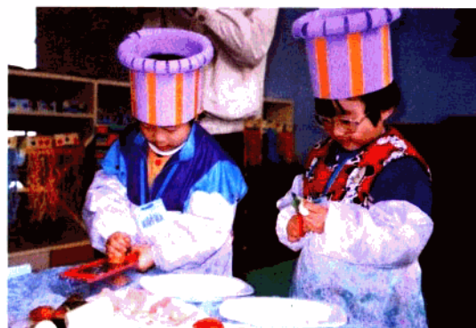
我们是小小配菜师