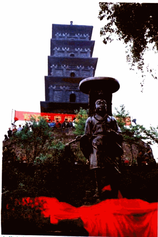
九华山玄奘大师像

南京市玄武区园林绿化管理所,全民事业单位,成立于一九五八年十月,隶属南京市玄武区建设局。业务主管:南京市园林局。资金情况:财政差额拨款。现有固定资产5千多万。下属机构有:九华山极限运动中心、九华山乐游苑、宾馆、餐厅、儿童乐园、工程部、机务队、花卉盆景基地等十多处。多年来被评为省、市、区两个文明先进单位、绿化先进单位、建设南京有功单位。