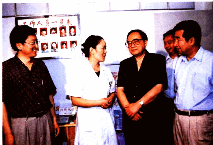
2000年9月4日，中宣部部长丁关根视察锁金社区卫生服务工作。