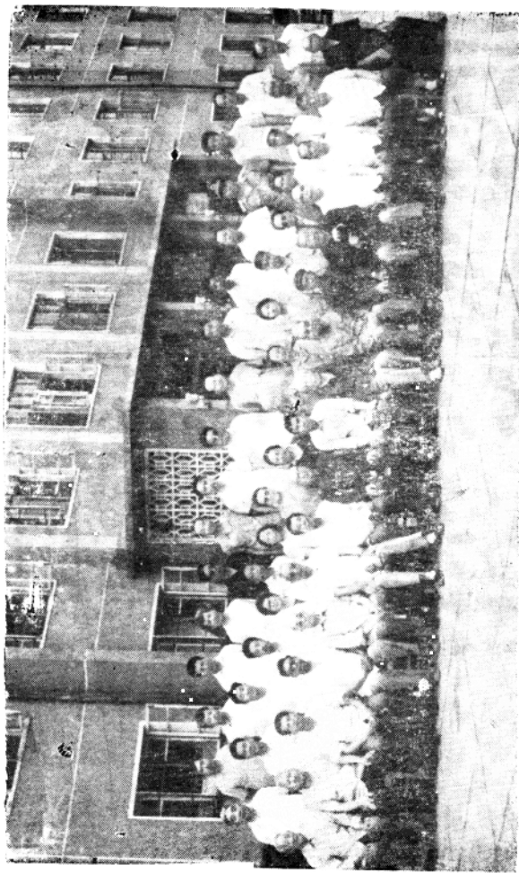
参加1938年冀东抗日大暴动部分老同志和玉田县领导干部合影