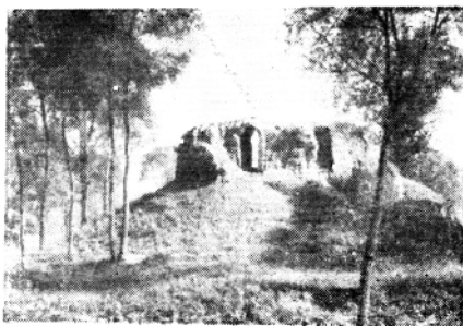
散水头北窑 战斗遗址