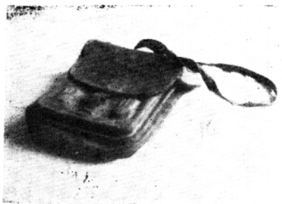
李兴在抗日战争 时期使用过的图囊