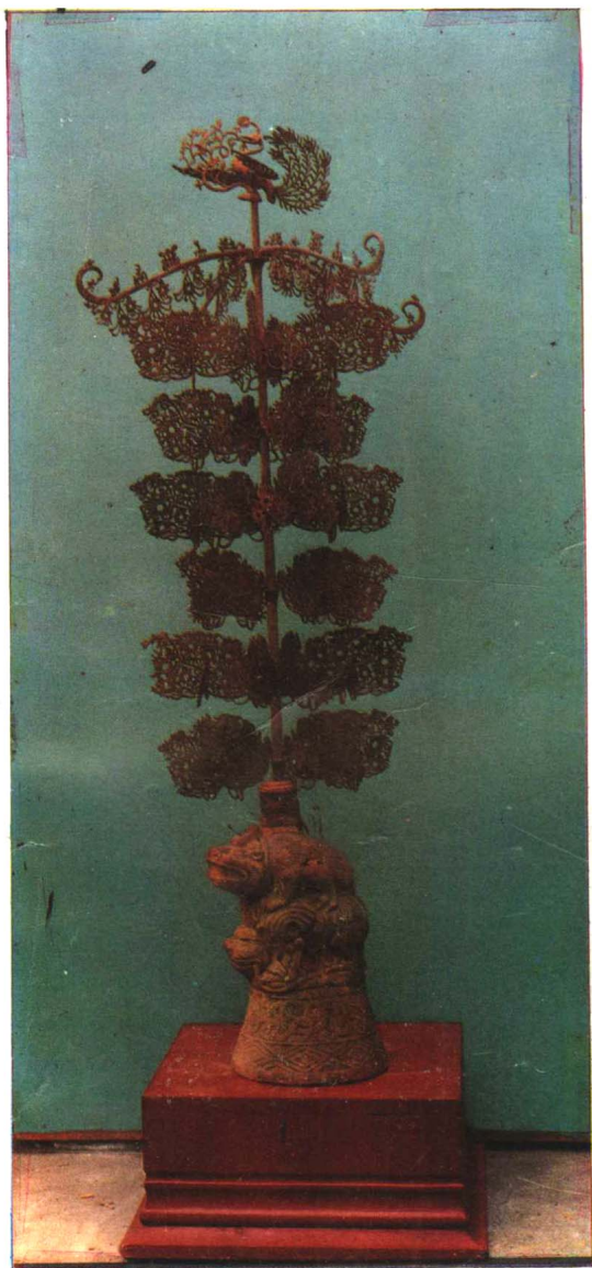
新津出土东汉摇钱树 县博古工艺研究所修复