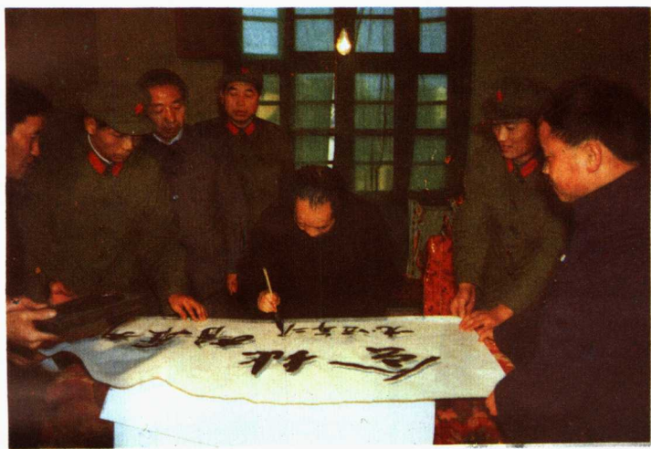
胡耀邦同志为扎西会议会址题字