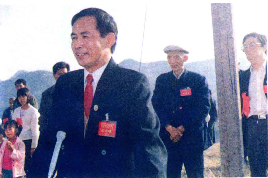
组委会主任、平乐县县长张明沛在商隐公园奠基典礼上讲话。