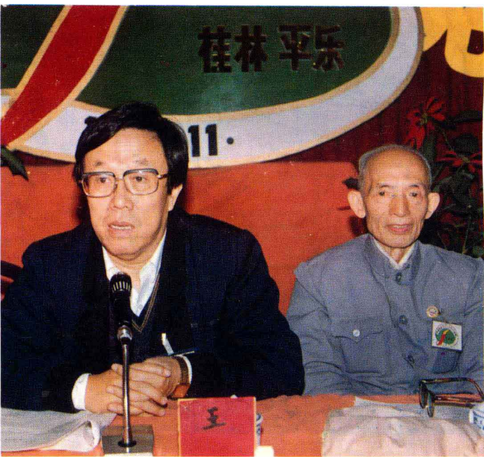
右：张明冲、梁超然、张葆全、张开政、周民震、王蒙、韦瑞霖、阳国亮。 左图：原文化部长、著名作家王蒙在大会上发言。右为广西区政协副主席韦瑞霖。