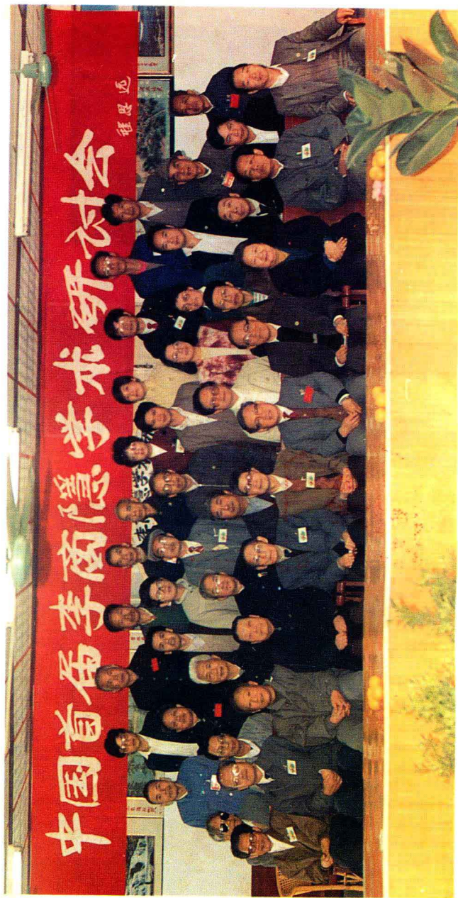
研讨会闭幕式留影(1992年11月25日于平乐鸿泰饭店)。