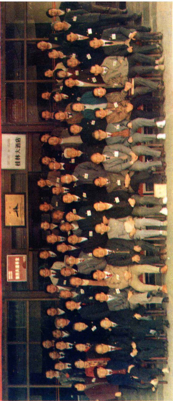
研讨会开幕式全体与会代表合影 (1992年11月21日于桂林大酒店)